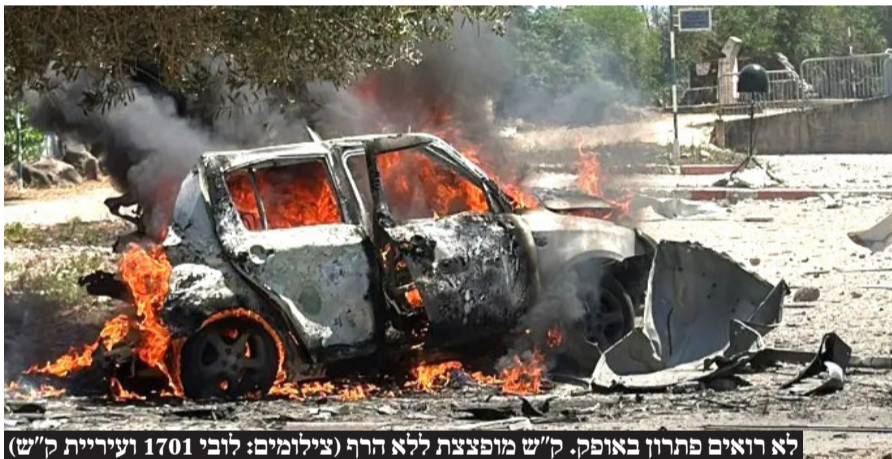
לא רואים פתרון באופק. ק"ש מופצצת ללא הרף

בעוד המלחמה השקטה בצפון ממשיכה וגובה קורבנות בחיי אדם, רבים מתושבי הצפון טרם חזרו לביתם. קולות הפיצוצים מרעידים את השטח ואזעקות עולות וירודות קוטעות את השקט המתוח ששורר בכל. ביקשנו לשוחח עם תושבים מהצפון בכדי להבין, איך נראים החיים כמעט תשעה חודשים אחרי מתקפת הפתע האכזרית שהובילה למלחמה בדרום ולמלחמה שקטה, לא פחות, בצפון, וכך גרמה להם לעזוב את ביתם למשך זמן בלתי ידוע, לעתיד לוט בערפל.