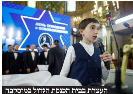
העצרת בבית הכנסת הגדול במוסקבה