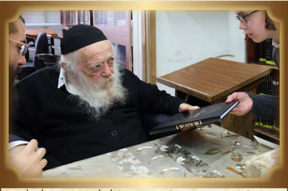
מרן זיע"א מעניק את ספרו 'ארחות יושר' לתלמיד שנבחן על תלמודו

ברק שיח ההלכה * ספר ב' י"ב אייר הרב חיים בורשטיין מודיעין עילית בתורתו * ספר ג' י"ג אייר סעדון אופקים בדרכו 8 דף * 500 ג' י"ג אייר הרב משה חיים אלדד מו"ע כהנהגתו * ספר ג' י"ג אייר הרב אהרן זילבר אשדוד * 100 ג' י"ג אייר הרב שמחה בונים דייטש משניות * ספר ג' י"ג אייר הבה"ח חזקאל קליין מודיעין עילית בתורתו * ספר ג' י"ג אייר חזקאל קליין מו"ע בדרכו 8 דף * 100 ג' י"ג אייר הרב בנימין וינר בני ברק ירושלמי י"ג אייר הרב משה טאוסקי חיפה שיח ההלכה * ספר ג' י"ג הבה"ח שמואל קטריס בדרכו 8 דף * ספר ג' י"ג אייר התלמיד ברק בתורתו * ספר ג' י"ג אייר התלמיד שלמה קרישר אלעד * ספר ד' י"ד אייר הרב מרדכי קנר בני ברק ירושלמי * ספר ד' י"ד אייר הרב נחמן זיגלמן אשדוד שיח ההלכה * ספר ד' י"ד הבה"ח שמואל בן-דוב בני ברק בדרכו 8 דף * 500 ד' י"ד אייר התלמידה אילה גרינברג אלעד כהנהגתו * ספר ד' י"ד אייר התלמיד צבי ברנדווין משניות * ספר ד' י"ד אייר הרב משה בני ברק ירושלמי * ספר ד' י"ד אייר הרב יוסף בן צבי בני ברק