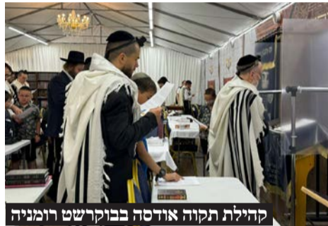
קהילת תקוה אודסה בבוקרשט רומניה