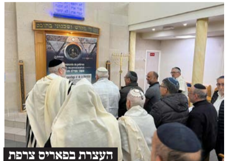
העצרת בפאריס צרפת