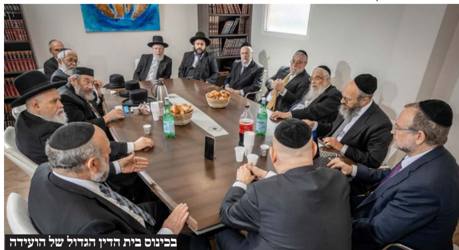
בכינוס בית הדין הגדול של הועידה

כמו כן קיימה הועידה תוכנית לבוגרי העתודה הרבנית. קורס מסדרי חופה וקידושין. קורס גישור, סדנת אימון - התחדשות לרבנים. סמינר הכשרה ל'שגרירים' במסגרת תוכנית שגרירי היהדות. ערב לימוד לקראת חג שבועות וזמינות עשרות שיעורי תורה הגות