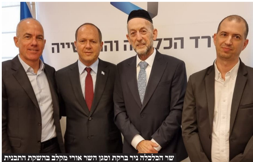
שר הכלכלה ניר ברקת וסגן השר אורי מקלב בהשקת התכנית

התכנית של הרשות החרדית במשרד ראש הממשלה והסוכנות לעסקים במשרד הכלכלה והתעשייה, בהיקף של 2 מיליון ש"ח במימון הרשות החרדית, פונה לעסקים בחברה החרדית ומסייעת להם בכלים מקצועיים לצמיחת העסק