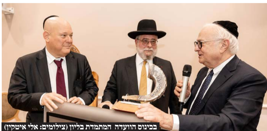
בכינוס הוועדה המתמדת בליון

סבוכות ביותר. בדיון שהתפתח סקר הגר"פ גולדשמידט את פעילותו במהלך כ 11 שנים והקשיים שעבר עד לחקיקת חוק העגונות ואח"כ את הפיכתו מהוראת שעה לחוק קבע. כזכור עפ"י החוק יש כיום סמכות לבתי הדין בישראל לדון בעניינין של עגונות יהודיות בחו"ל ולפעול בכלים חוקיים נגד בעלים סרבנים כשהם מגיעים לבקר בארץ, במטרה לקדם את שחרורן של נשים אלו מכבלי עגונות. "רשמנו הצלחות כבירות מאז נחקק החוק; מאות נשים שוחררו מכבלי עגונות וכאן המקום להודות לכל מי שנטל חלק במערכה".