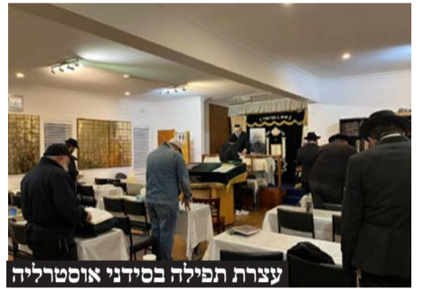
עצרת תפילה בסידני אוסטרליה