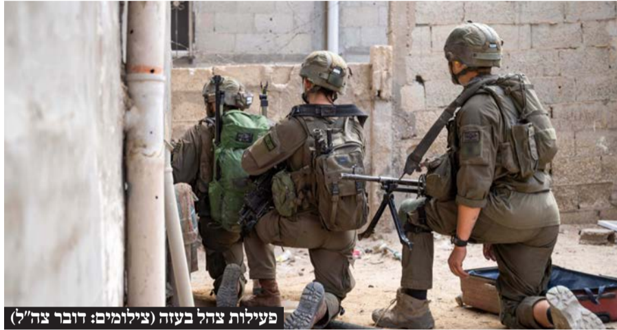
פעילות צהל בעזה

עם זאת, בצה"ל טוענים כי העיכוב בכניסה לרפיח השפיע על ההיערכות של חמאס אל מול הכוחות. מחבלי חמאס למדו את אופן הפעולה של צה"ל, הפיקו לקחים מאזורים אחרים ברצועה והיו מוכנים טוב יותר: בין היתר הם מלכדו יותר בתים ואף