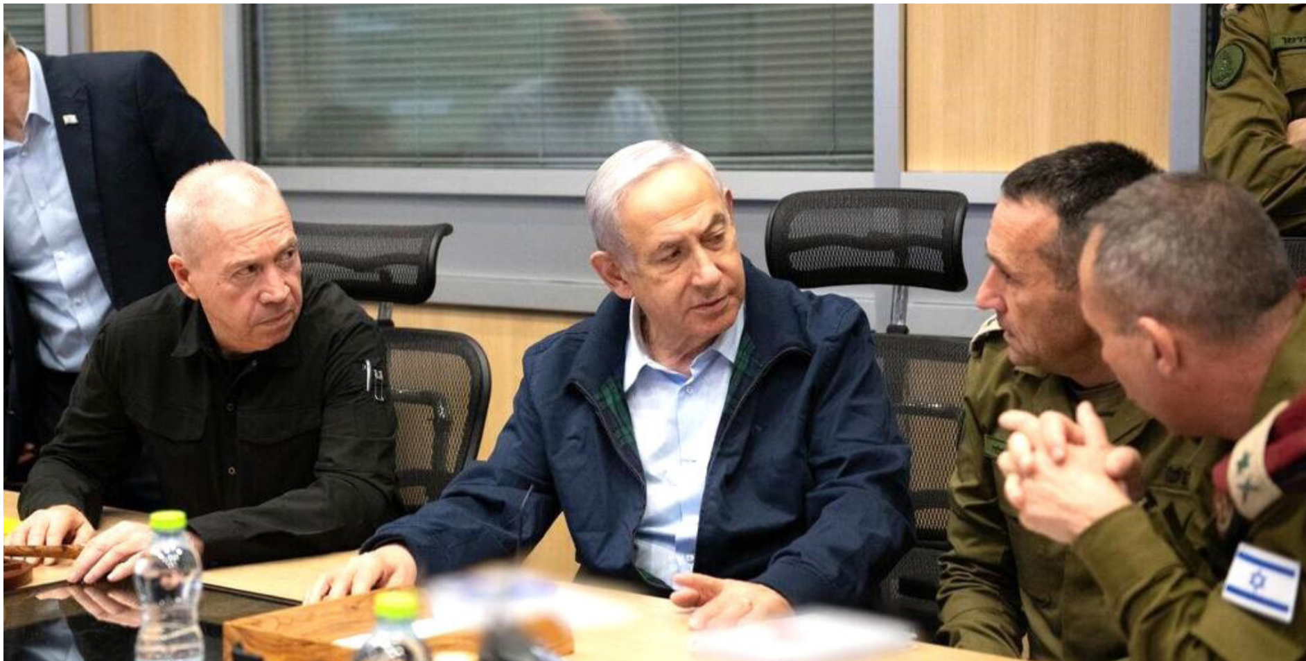
דין אחרון בקבינט מיותר? קבינט המלחמה לפני התפרקותו

» והנה חשיפה שעשויה לייצר טלטלה חדשה בגוף הבוחר: עוצמה יהודית מתכוונת לתמוך במועמדותו האפשרית של הגאון רבי שמואל אליהו לתפקיד הראשון לציון, ובמקביל לשקול במי תתמוך כמועמדה לרב האשכנזי. במסגרת זו, עשוי בן גביר להחליט לתמוך באחד מרבני הציונות הדתית המתמודדים לתפקיד, או לחלופין, לנסות לייצר ציר חלופי בתוככי הקואליציה, יחד עם יהדות התורה, שגם היא נדחקה לשוליים בדיל דרעי-סמוטריץ'. באיזה מסלול יבחר שר הביטחון הלאומי ברגע האמת? ימים יגידו