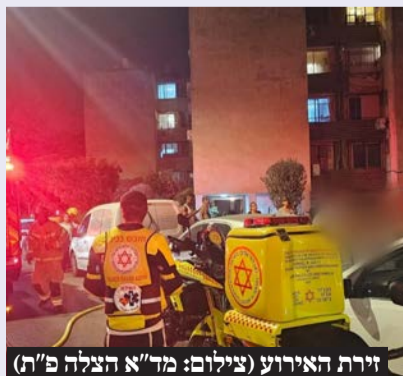
זירת האירוע