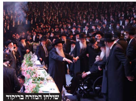
שולחן המזרח בריקוד