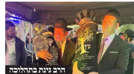
הרב גינת בתהלוכה