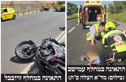
התאונה במחלף עמישב התאונה במחלף זרובבל

רוכב אופנוע נהרג ורוכב נוסף נפצע באורח בינוני בשתי תאונות דרכים בכניש 471