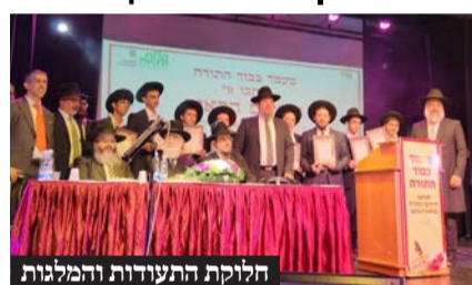
חלוקת התעודות והמלגות

במעמד מיוחד חולקו המלגות לאברכים והבחורים שכתבו "חבורות" בזמן חורף לעילוי נשמתו של מרן הגר"ע יוסף זצ"ל