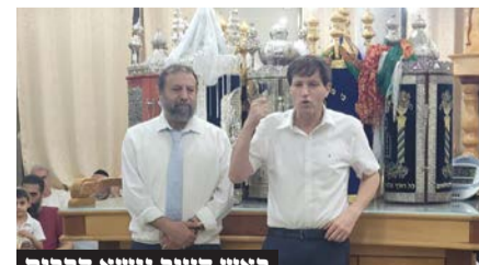
ראש העיר נושא דברים