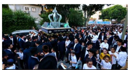
תהלוכת חברון היכל יחזקאל