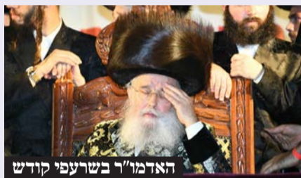
האדמו"ר בשרעפי קודש