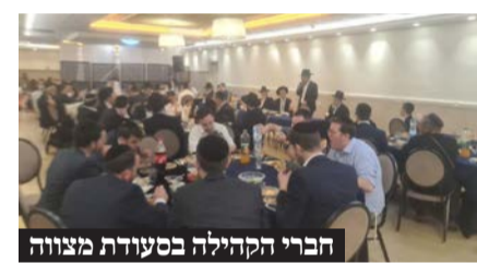
הכרי הקהילה בסעודת מצווה