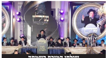
שולחן המזרח בשמחה