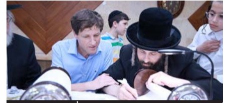
ראש העיר בכתיבת האותיות