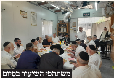
משתתפי השיעור בסיום