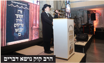
הרב קוק נושא דברים