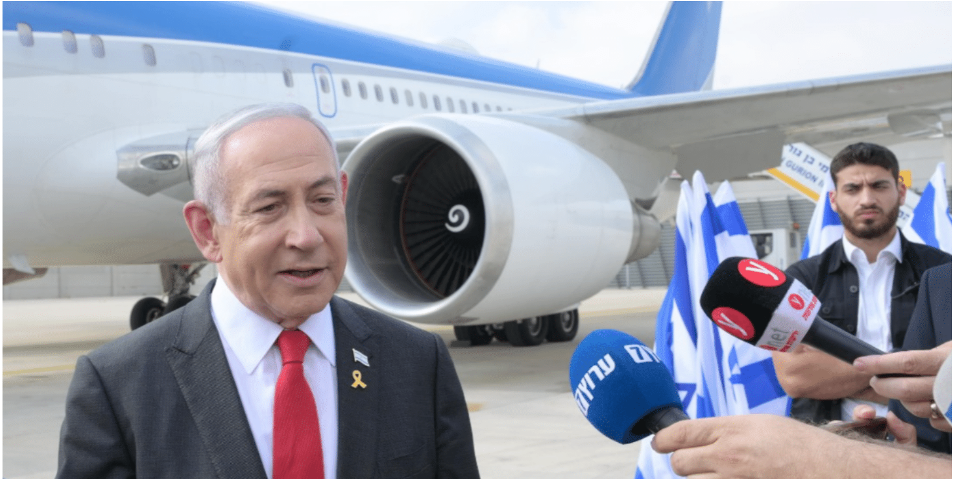
פורש נפיים. נתניהו בדרך לושינגטון

המוקש הוא כמובן בכך שהרבנים אינם יכולים לאפשר לעצמם לרמוז את מה שהבג"ץ מבקש מהם להירמוז, וכך, גם אם במישור המעשי היה ניתן להגיע לידי מינוי של עשרה רבנים בלבד, ייתכן שהתהליך יטורפד בגלל המישור התיאורטי-עקרוני.