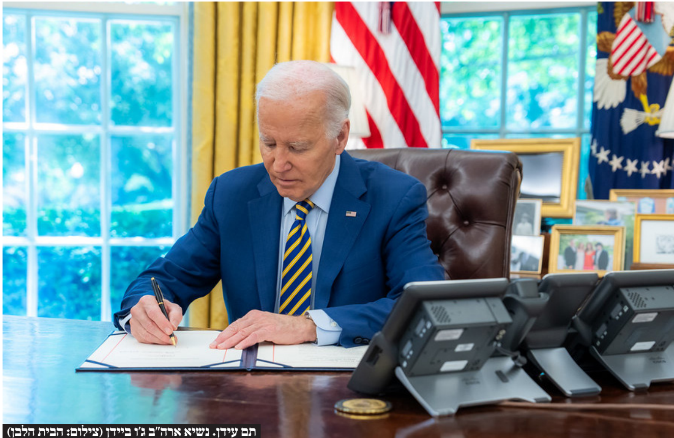
תום עידן. נשיא ארה"ב ג'ו ביידן

נשיא ארה"ב ג'ו ביידן נכנע ללחץ הכבד שהופעל עליו והכריז על פרישתו מהמרוץ לבית הלבן • המועמדת המובילה להחלפתו במירוץ: סגנית הנשיא קמלה האריס שזוכה לתמיכה במפלגה הדמוקרטית • טראמפ ממשיך להוביל בסקרים ומאיים על חמאס: "תחזירו את כלל החטופים לפני שאכנס לתפקיד כנשיא - או שתשלמו מחיר כבד מאוד"