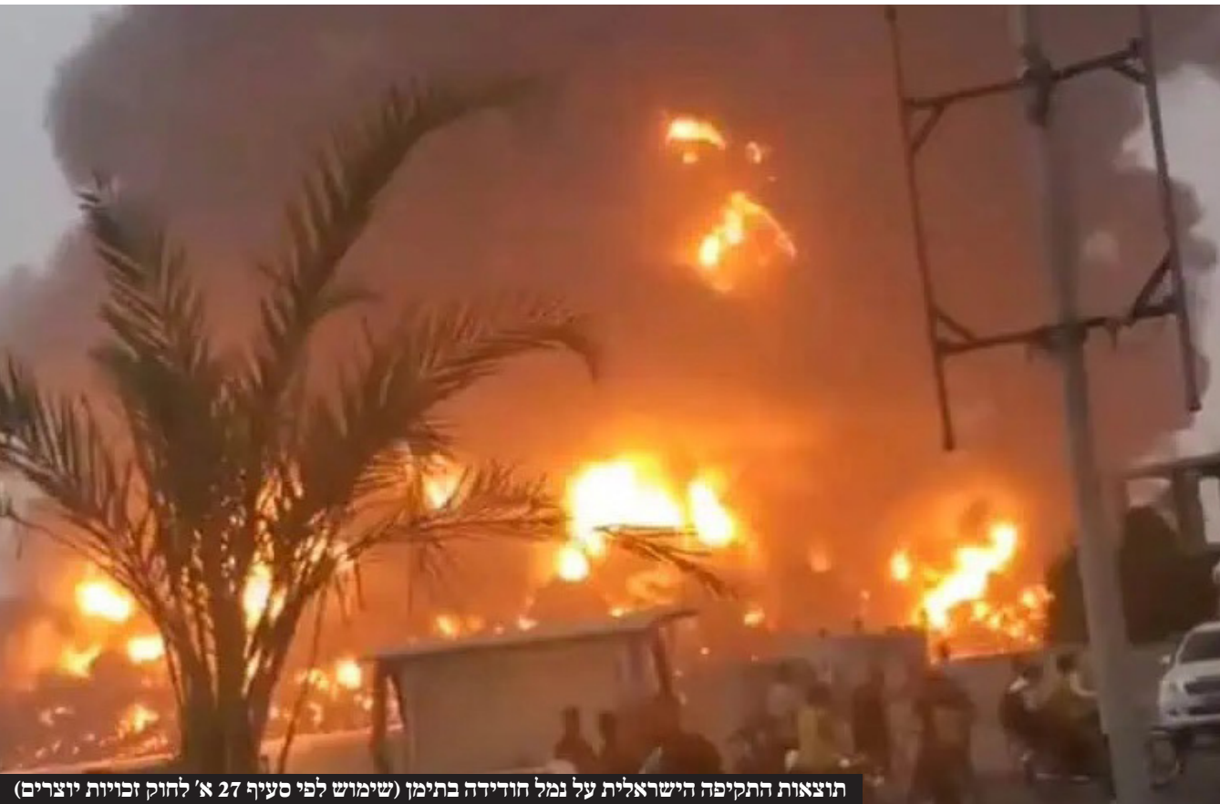
תוצאות התקיפה הישראלית על נמל חודידה בתימן (שימוש לפי סעיף 27 א' לחוק זכויות יוצרים)

בתגובה לירי כטב"ם שחדר לעומק תל-אביב והרג אזרחי ישראל שעלה מרוסיה, יצא חיל האוויר לתקיפה משמעותית בעיר הנמל בתימן • בתקיפה החריגה נהרגו ונפצעו לפי הדיווחים עשרות בני אדם, והמוקד שלה היה מצבורי נפט וגם מחסני אמל"ח איראניים • החות'ים מאיימים בנקמה: "ונכנסו למלחמה ישירה שפירושה שבנק המטרות יתרחב"