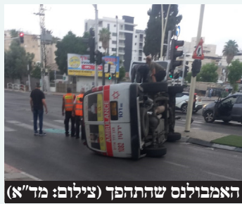
האמבולנס שהתהפך

בסוף השבוע שעבר התקבל דיווח במוקד 101 של מד"א במרחב ירקון על רכב שהתהפך ברחוב המכבים בפתח תקווה. חובשים ופראמדיקים של מד"א מעניקים טיפול רפואי ומפנים לבי"ח בלינסון, 3 פצועות במצב בינוני, בהן אישה בת 34, אישה בת 30 וצעירה בת 19, עם חבלות בגופם.