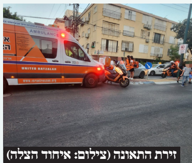
זירת התאונה

ביום שני בערב צוותי הרפואה של איחוד הצלה העניקו סיוע רפואי ראשוני להולכת רגל (כבת 70) שנפגעה מרכב ברחוב טרומפלדור פינת רחוב ניימן בפתח תקווה. מצבה בשלב זה מוגדר קל. תאונה זו מצטרפת לתאונה נוספת שהתרחשה במקום לפני ימים ספורים שגם בה נפצעה גברת באורח קל. תושבים הגרים בסמיכות לצומת מדווחים על נהגים שחונים כנגד החוק ורכביהם חוסמים את שדה הראייה.