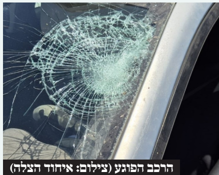
הרכב הפוגע