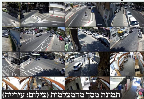
תמונת מסך מהמצלמות

בעיריית פתח תקווה ממשיכים ברישות העיר במצלמות אבטחה. בהודעה שפרסם רמי גרינברג, ראש העיר נכתב: "ממשיכים לרשת את העיר במצלמות בכדי לתת מענה חזק ומיידי לבטחון התושבים. המצלמות מחוברות למרכז שליטה עירוני שמופעל 24/7 ויועד להפעיל עשרות צוותי בטחון עירוניים הפרוסים בשטח".