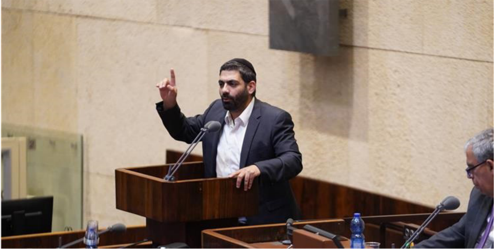
שר הדתות בפיליבסטר באדיבות בן גביר

» בשלב מסוים הוצעה לבן גביר גם הצעה שכבר הועלתה על ידי נתניהו בעבר, הקמתו של פורום מצומצם יותר מהקבינט הרגיל, ובו יינתנו סקירות עומק מרחיבות יותר על המלחמה והיבטיה השונים. אבל בן גביר לא קיבל את ההצעה כבר בזמנו, משום שלדבריו, הוא לא מחפש "לדעת" יותר על המלחמה, אלא להשפיע באופן ממשי על דרך קבלת ההחלטות ועל תוכנן. לפיכך נדחו גם ניסיונות קלושים להרגיע אותו באי אלו שילומים ופיצויים, דוגמת תפקיד סגן שר נוסף למפלגתו וכדומה. "התחילו כל מיני הצעות ואמרנו שאין בהם טעם, אנחנו רוצים לא קונים ספציפי זהו. אותנו לא קונים בג'ובים, אנחנו רוצים להיות מעורבים בניהול המלחמה", אומרים לנו מקורביו של השר