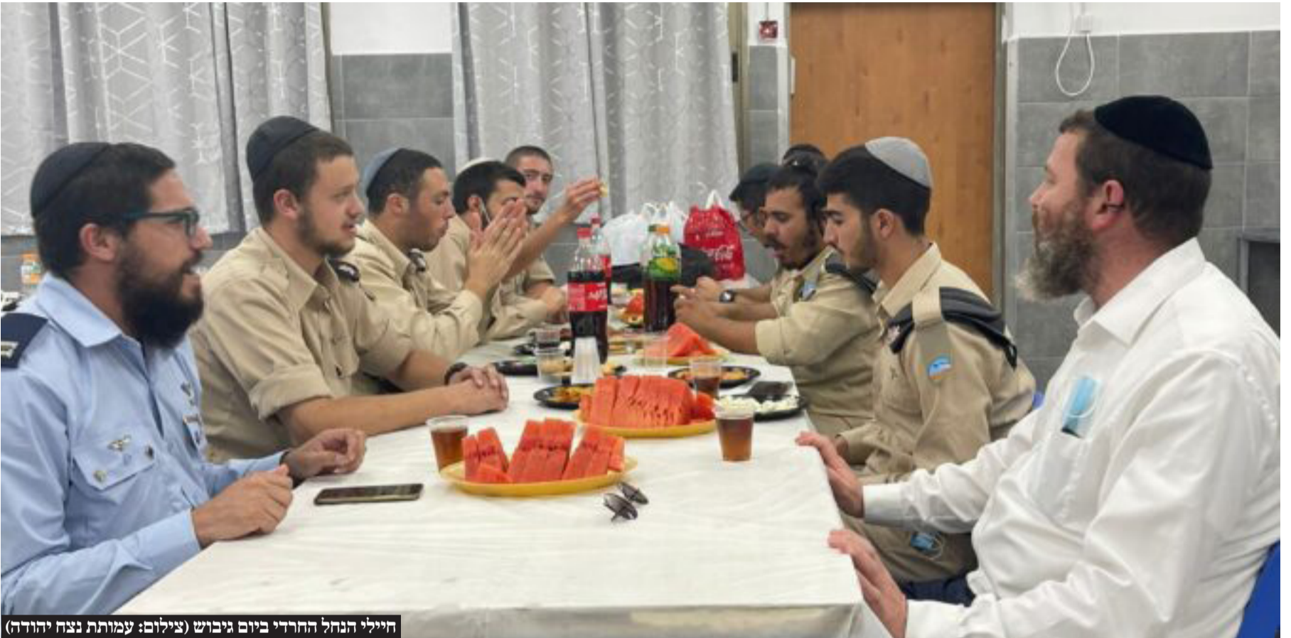
היילי הנחל החרדי ביום גיבוש

אחרי החלטת בג"צ, במערכת הביטחון הצהירו שיתאפשר לגייס השנה רק 3,000 גברים חרדים בעקבות פקיעת חוק הגיוס • ראש הממשלה בנימין נתניהו נגד גלנט: "מי שנותן לאופוזיציה זכות וטו, נותן להם את האפשרות למנוע גיוס חרדים במטרה אחת: להפיל את הממשלה" • בקואליציה מעריכים כי חוק הגיוס החדש יחוקק במושב החורף של הכנסת