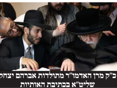
כ"ק מרן האדמו"ר מתולדות אברהם יצחק שליט"א בכתיבת האותיות

בכתיבת האותיות כונד כ"ק מרן האדמו"ר מתולדות אברהם יצחק שליט"א