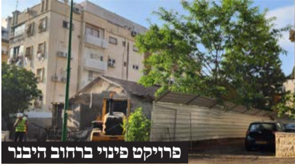
פרויקט פינוי ברחוב היבנר

ההיתר, יש להעביר למינהלת דו"ח מיפוי אוכלוסיות סופי ותוכנית ליווי לאזרחים קשישים, בעלי דירות עמידר, אנשים עם מוגבלויות ובעלי צרכים מיוחדים ואישור סופי מול המחלקה לעבודה סוציאלית. כמו כן תתקיים פגישת עדכון של המלווה החברתי, קיום כנס לבחירת דירות התמורה ועוד.