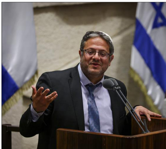
« מתעקש להשיפע. השר לביטחון לאומי איתמר בן גביר

« אף אחד לא רוצה שהעסק יתפרק, אומר לנו אחד מאנשיהם, "המפלגות החרדיות לא תצבענה בעד פיזור הכנסת - אולי למעט אנשי אגודת ישראל שמהווים סוג של שחקן עצמאי באירוע, ועושים קולות של פרישה אקטיבית מהקואליציה אם חוק הגיוס לא יושלם בשבועות הקרובים, בגלל לחצים מכמה מחברי ה'מועצת' החסידי, אבל זה בדרך לשם גם בלעדיו", הוא מסכם. "גפני אמר מה שאמר כי הגיעו מים עד נפש כבר, אבל גם כשהוא אמר את זה עוד היינו משוכנעים שנתניהו ייכנס בעובי הקורה וירגיע את בן גביר"»