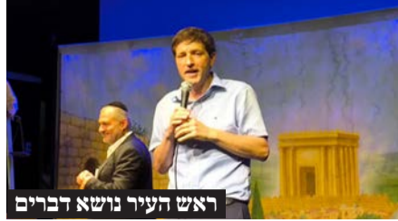
ראש העיר נושא דברים