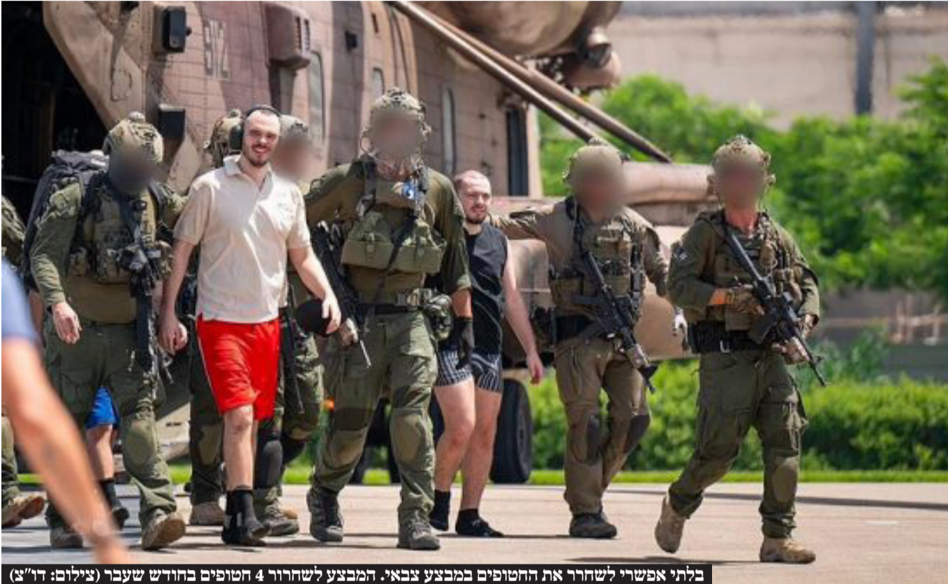
בלתי אפשרי לשחרר את החטופים במבצע צבאי. המבצע לשחרור 4 חטופים בחודש שעבר

העסקה המדוברת כוללת שלושה שלבים - כשבשלב הראשון ישוחררו כל הנשים, החולים והמבוגרים שנותרו בשבי. מדובר ב-33 חטופים חיים ומתים, לפי הדיווחים, שישוחררו במשך שישה שבועות. בשלב ב' שעליו ינהלו חמאס וישראל ומתן - אמורים להשתחרר יתר החטופים החיים, ובעיקרם הגברים הצעירים והחיילים. על השלב הזה סובבת המחלוקת החריפה ביותר בהסכם, שכן חמאס מתנה את קיומו בהפסקת אש קבועה - ואילו ישראל לפי שעה מסרבת לה. בשלב השלישי אמורים להשתחרר שאר הגופות. בכל שלב במסגרת העסקה ישראל אמורה לשחרר מאות מחבלים מבתי הכלא. אלא שבינתיים, ישראל מאוד מוטרדת