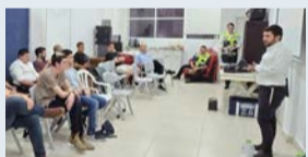
מנהל מרחב ירקון נושא דברים

השבוע התקיים ערב הדרכה בסיסית למתנדבים חדשים בסניף פתח תקווה. במהלך הערב הוכשרו המתנדבים שהצטרפו לאחרונה לארגון, בפתרון בעיות במגוון מקרים: החלפת גלגל - תוך שימת דגש על בטיחותם האישי; הנעת רכבים באמצעות כבלים או בוסטר; תיקון פנצ'ר בשטח באמצעות 'תולעת' וברגי