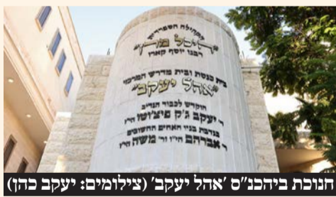
הנוכת ביהכנ"ס 'אהל יעקב'