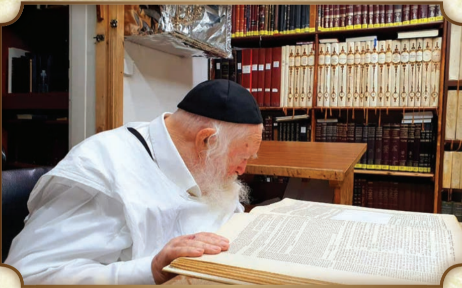
מרן זיע"א בעת לימוד שולחן ערוך יורה דעה