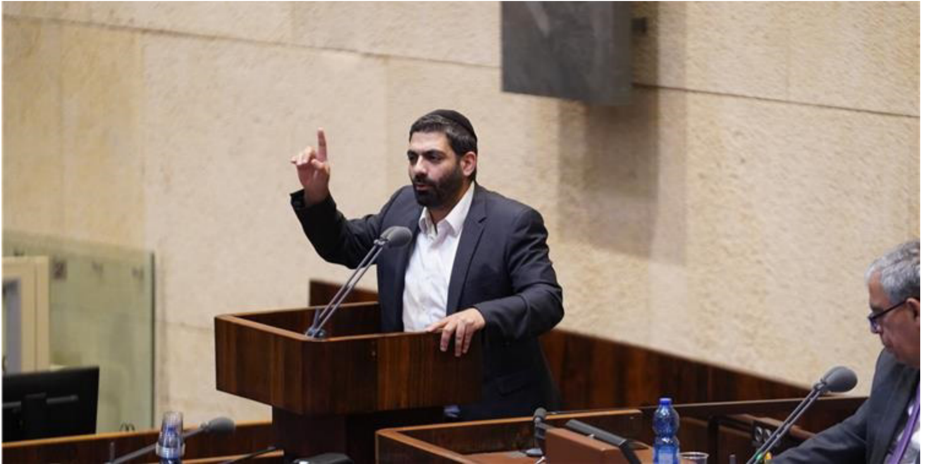
שר הדתות בפליבסטר באדיבות בן גביר

» בשלב מסוים הוצעה לבן גביר גם הצעה שכבר הועלתה על ידי נתניהו בעבר, הקמתו של פורום מצומצם יותר מהקבינט הרגיל, ובו יינתנו סקירות עומק מרחיבות יותר על המלחמה והיבטיה השונים. אבל בן גביר לא קיבל את ההצעה כבר בזמנו, משום שלדבריו, הוא לא מחפש "לדעת" יותר על המלחמה, אלא להשפיע באופן ממשי על דרך קבלת ההחלטות ועל תוכנן. לפיכך נדחו גם ניסיונות קלושים להרגיע אותו באי אלו שילומים ופיצויים, דוגמת תפקיד סגן שר נוסף למפלגתו וכדומה. "התחילו כל מיני הצעות ואמרנו שאין בהם טעם, אנחנו רוצים לא קונים ספציפי זהו. אותנו לא קונים בג'ובים, אנחנו רוצים להיות מעורבים בניהול המלחמה", אומרים לנו מקורביו של השר.