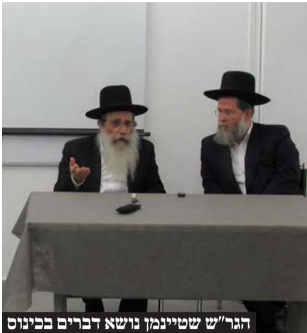
הגר"ש שטיינמן נושא דברים בכינוס

את הדברים נשא הגר"ש שטיינמן בכנס שהתקיים ע"י 'איגוד מנהלים רוחניים', שעל ידי עיריית בני ברק בראשות ראש העיר חנוך זייברט, באמצעות מרכז 'הקשיבה', המפעילה תכנית סדרת שיעורים ייחודיים שמסייעת לצוותי הישיבות להתמודד עם בעיות חינוכיות שונות