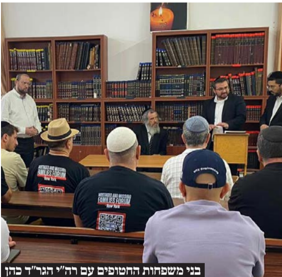
בני משפחות החטופים עם רה"ג הגר"ד כהן

בני משפחות החטופים הגיעו לביקור מיוחד במעונו של חבר מועצת גדולי התורה וראש ישיבת חברון הגר"ד כהן שאמר לבני המשפחות: "כולנו מתחננים ומבקשים - בשביל אחינו ואחיותינו לעשות את כל המאמצים, כל מה שרק אפשר - להחזיר אותם בשלום. אנחנו מרגישים שזה ממש אחינו ואחיותינו, וכך צריכים כולם להרגיש, זה בנינו ובנותינו"