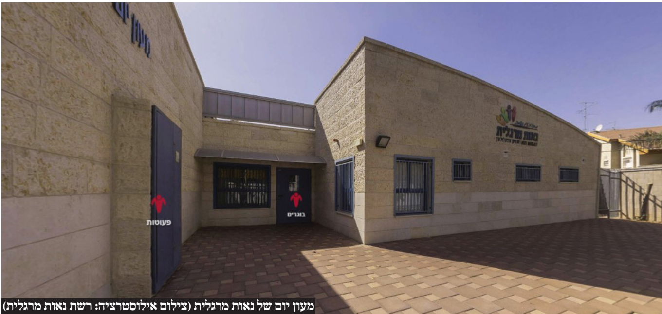
מעון יום של נאות מרגלית

בהחלטה שערורייתית ומקוממת, היועצת המשפטית לממשלה, גלי בהרב מיארה, הודיעה במכתב ששלחה לשר העבודה כי על הממשלה להפסיק לממן מעונות יום למשפחות חרדיות שאב המשפחה מועמד לגיוס לצבא. מדובר באברכים צעירים מגיל 18 ועד גיל 26 שמעתה לא יהיו זכאים לסבסוד במעונות, כך שמדובר במכה הכואבת ביותר שהונחתה עד כה על המגזר החרדי והאברכים הצעירים.