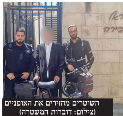
השוטרים מחזירים את האופניים

ולמתגדבים על פעילותם ומאמציהם להגן על רכוש הציבור.