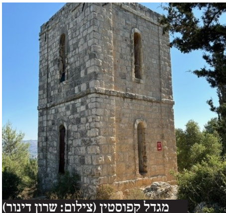
מגדל קפוסטין ואת כוחות צה"ל במלחמת העצמאות לצורכי הגנה ותצפית.