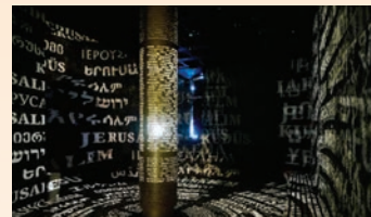
כיכר השער הקדום