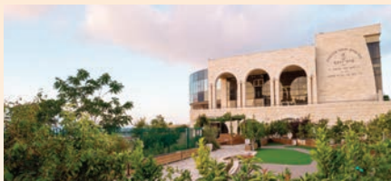
מרכז מבקרים 'אמונת ארץ'

כניסה חינם למגוון אטרקציות במהלך בין הזמנים ימים ראשון-חמישי - י"ד-י"ח, כ"א-כ"ה אב 18-22, 25-29.8