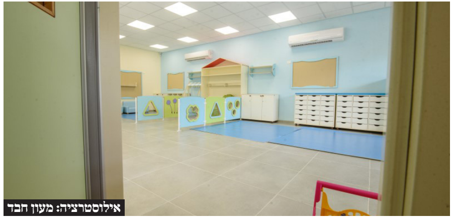
אילוסטרציה: מעון חדר

בשלב זה, הצטרף השר סמוטריץ: "יש הצעות חוק שונות בקשר לסמכויות שלהם תביאו עכשיו. הציונות הדתית תתמוך". השר בן גביר תמך בדבריו של שר האוצר: "עוצמה יהודית תתמוך". השר לוין, תקף בחריפות את היעוץ המשפטי: "שהיועצת המשפטית תוריד את הידיים מהילדים החרדים!". נציין כי הוראת היועמ"שית איננה