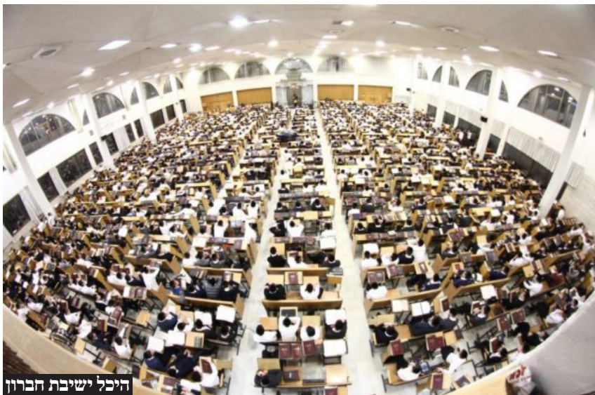
היכל ישיבת חברון

סוגיית גיוס בני הישיבות מסעירה את המדינה בימים אלו, וזה הזמן לצלול לאינטרסים הסמויים של מי שמלבים את האש ועומדים מאחורי הקמפיילים סביב הנושא שקורע את הציבור בישראל. ספוילר: אף אחד מהם לא באמת מעוניין בגיוס חרדים באמת. למעשה, חלקם הגדול חושש מהשתלטות חרדית על הצבא ומשתמש בסוגיה הרגישה בכדי לפרוץ את הברית שבין הציבור החרדי לציבור הימני והמסורתי בישראל. הא ותו לא.