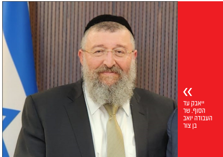
« ייאבק עד הסוף. שר העבודה יואב בן צור