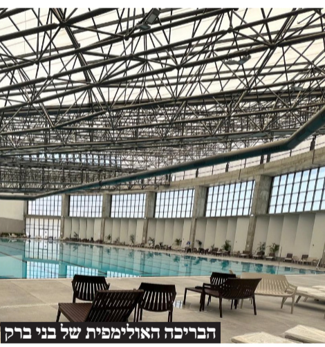
הבריכה האולימפית של בני ברק

התארגנו: מה להביא לבריכה? בגדי ים. הכרחי, לא? וכעת ברצינות, לא מזמן גילינו שאחרי ימי רחצה מסוימים לפעמים המים פחות צלולים. מתברר שישנם ששוחים