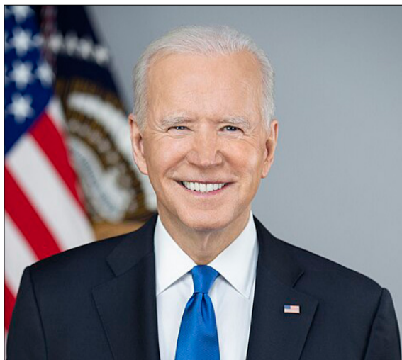
עדיף על הארץ, נשיא ארה"ב ג'ו ביידן

בדרך כלל נקבל 'פרסום ראשון' עם פרטי העסקה המתגבשת (שהם, כאמור, פחות או יותר העתק הדבק מההצעה הקודמת), ואחר כך שטף של פרשנים, הוגי דעה, יוצרי הגיגים, אלופים במיל. וגורמים בכירים, כולם - כמה מפתיע - תומכים חד משמעית בעסקה, גם אם אין להם שמץ של מושג מה היא כוללת ומה נאמר בחדרים הסגורים. מבחינת