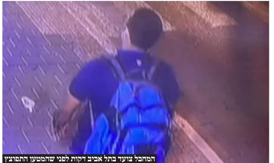
המחבל צועד בתל אביב דקות לפני שהמטען התפוצץ