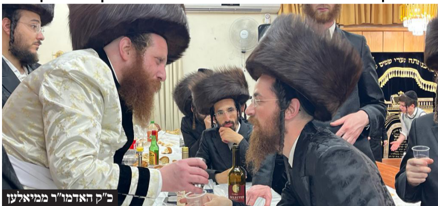
כ"ק האדמו"ר ממיאלען

שבת היסטורית: בשבת הקרובה תתקיים 'שבת אבן הפינה' לרגל התיישבות כ"ק מרן אדמו"ר ממיאלען שליט"א ומרכז הקהילה בשכונת 'מתחם הסופרים' בצפון בני ברק