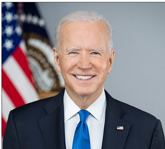
« עדיף על הארץ נשיא ארה"ב ג'ו ביידן

« בשלב הגרוע מכל, מכיוון שהתקשורת חייבת לייצר כותרות מתחדשות על בסיס יומי, ובמקביל היא מחויבת בלהט כמעט דתי לשמר את נושא החטופים בראש סדר היום התקשורת, היא עוברת לשלב השכנוע העצמי. במסע מפואר של אוטוסיגסטיה מסבירים לנו שהפעם זה ממש קורה והנה עוד רגע הרכבים של הצלב האדום מעמיסים את החטופים ומגיעות התמונות של החיבוקים מבתי החולים. זה מחזיק יום או יומיים, עד להבהרה התורנית של חמאס שאין בכוונתם להתייחס ברצינות לעסקה שלא כוללת הפסקת לחימה, נסיגה מרפיח ועוד כהנה וכהנה