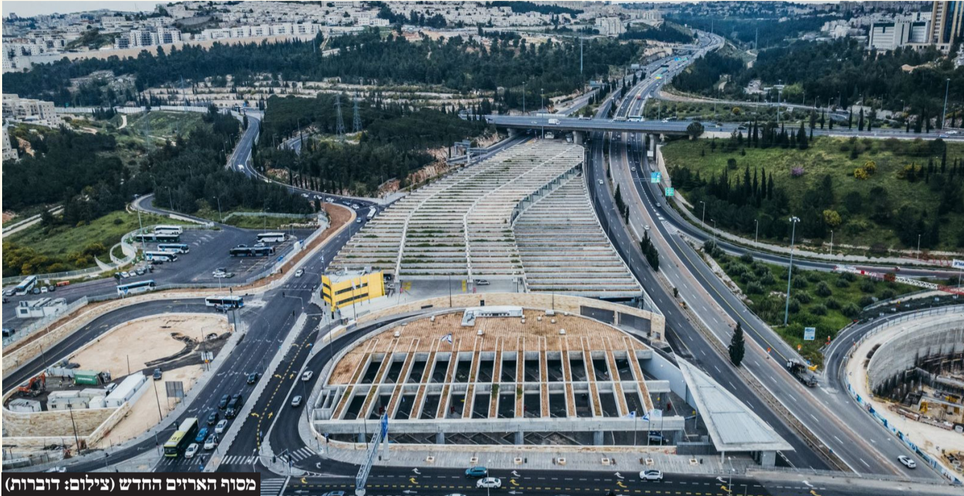
מסוף הארזים החדש

המסוף, הכולל חניון אוטובוסים חשמלי ומתקדם, ממוקם בקרוב למרכזי המסחר והמגורים של העיר, נבנה בהשקעה של חצי מיליארד שקלים ומתפרס על פני שטח של 50 אלף מ"ר • סגן שרת התחבורה, ח"כ אורי מקלב: "מדובר בבשורה חשובה לתושבי השכונות, שמנגישה עבורם קווי אוטובוס לתוככי העיר ומקצרת את זמני הנסיעה. נפח התחבורה הציבורית בירושלים גדול מאוד בשנים האחרונות ומסוף הארזים נותן לכך מענה הולם, כעידוד לשימוש בתחבורה הציבורית כאשר המסוף יאפשר לתת שירות זמין ומדויק יותר, ובזמנים מיוחדים"