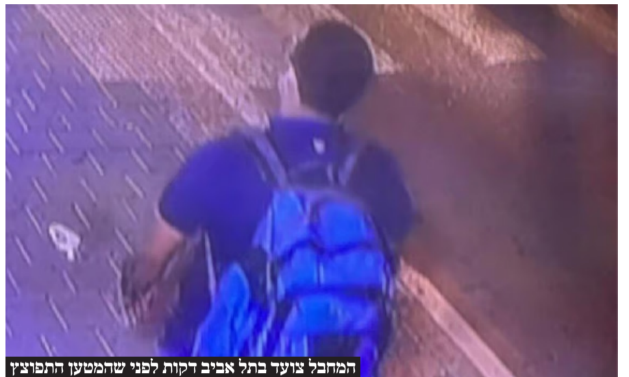
המחבל צועד בתל אביב דקות לפני שהמטען התפוצץ