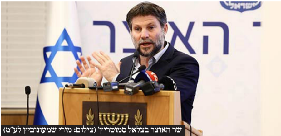
שר האוצר בצלאל סמוטריץ'

שר האוצר שיגר מכתב מפורט ומנומק למשנה ליועצת המשפטית לממשלה, בתגובה על החלטת היועצת המשפטית לאסור את המשך סבסוד מעונות היום לילדי נשים חרדיות שעובדות: "מדהים בעיניי שאתם מנהלים דיונים, מחליפים תכתובות ומקבלים החלטות בעלות משמעויות מרחיקות לכת בנושאים תקציביים וכלכליים ביניכם לבין עצמכם"