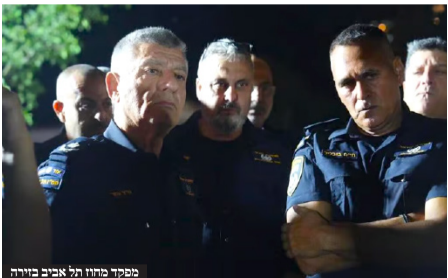
מפקד מחוז תל אביב בזירה