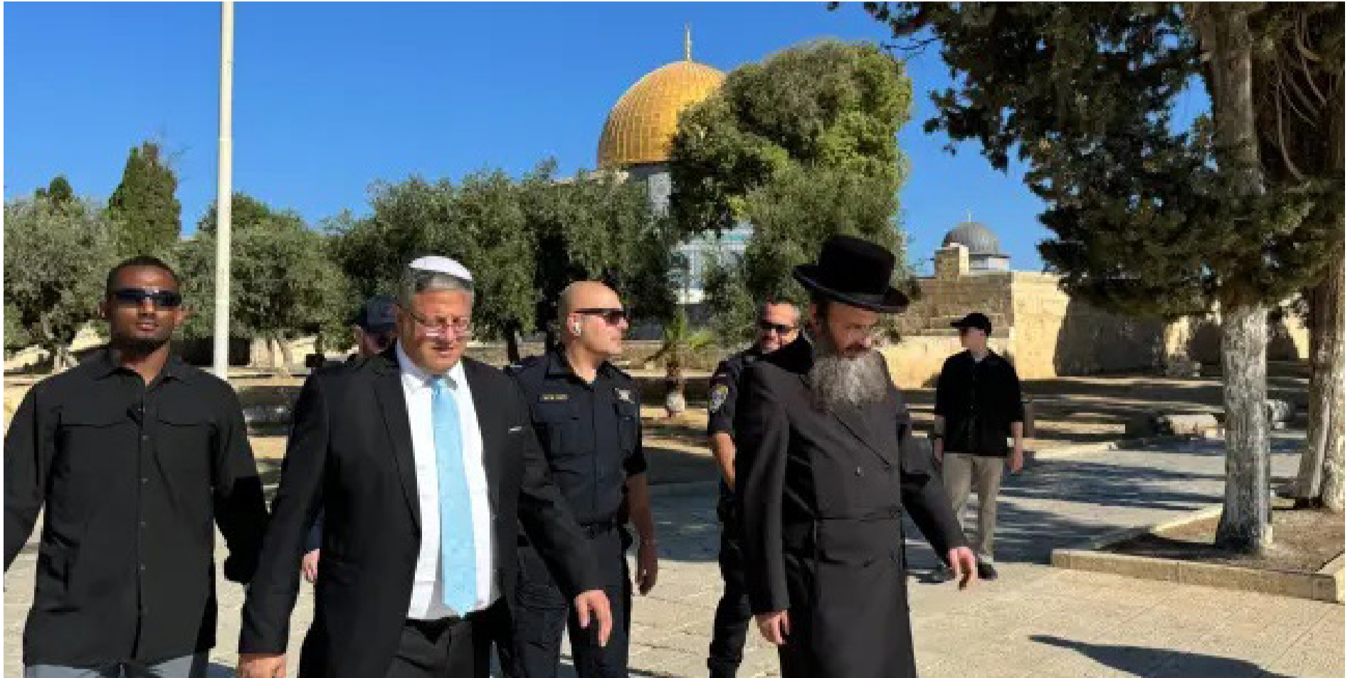
יוביל לפירוק הקואליציה? השר לביטחון לאומי בהר הבית

» גם אם טיפול באיראן עצמה נשמע כמו חלום באספמיא, נתניהו מכיר היטב את הגזרה הצפונית וידוע שהותרתם של עשרות אלפי אזרחים כשהם עקורים מבתייהם ומסרבים לחזור למטולה ולקרית שמונה ולחיות שוב בצל איומי האש והמנהרות הסמויות של חיזבאללה, תחנתו של כישלון במלחמה. כדי לנצח, ישראל לא יכולה להסתפק בגיחות עלומות של האוויר לפרברי ביירות ודמשק, לשם כך נדרשת תמונת ניצחון מאסיבית יותר ותחושת ביטחון ברורה וקוהרנטית יותר.