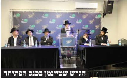
הגרש שטיינמן בכנס הפתיחה

מתחם יחיד מסוגו הוקם בפתח תקווה לרגל בין הזמנים • בטקס הפתיחה למתחם השתתפו מאות והאיזינו לדבריו של מרן ראש הישיבה הגר"ש שטיינמן