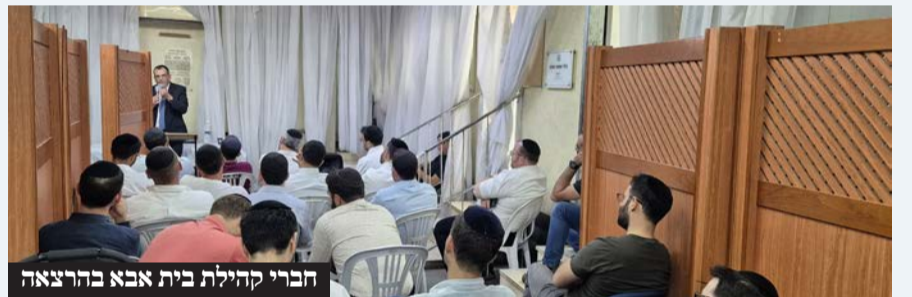
חברי קהילת בית אבא בהרצאה

לאחר שהמפגש הראשון נחל הצלחה גדולה, החליטו להרחיב את המפגש לסדרת הרצאות