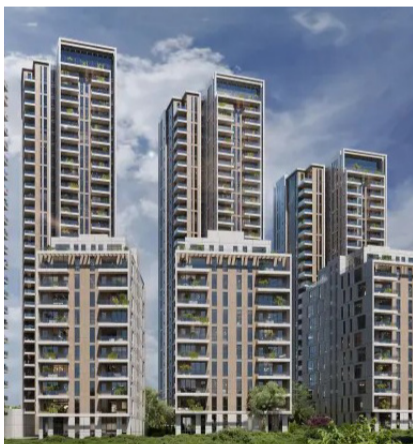
המגדלים החדשים שיוקמו ע"י 'שפיר מגורים' (צילום: א.ב. אדריכלים ומתכנני ערים בע"מ)

הוועדה המחוזית לתכנון ובנייה אישרה הפקדת תכנית להתחדשות עירונית בשכונת רמת ורבר בפתח תקווה, הכוללת ארבעה מגדלים בני 26-35 קומות ובהם 826 יחידות דיור ו-5 מבני מגורים בני 10 קומות בסמוך לפארק יד לבנים