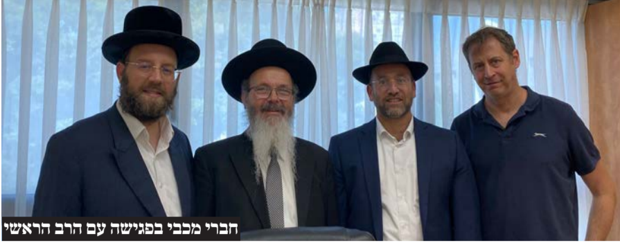
חברי מכבי בפגישה עם הרב הראשי