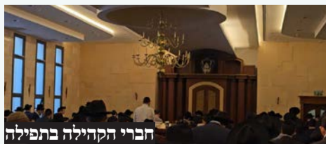
חברי הקהילה בתפילה

בבית המדרש 'חברון - היכל יחזקאל' במרכז העיר התאספו חברי הקהילה לעצרת תפילה ושיחת חיזוק מיוחדת ומעוררת על המצב השורר בארץ הקודש. השיחה הועברה על ידי הרב זאב גולדברג שליט"א.