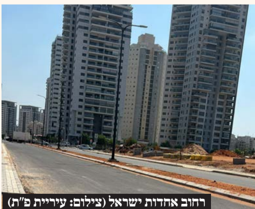
רחוב אחדות ישראל

ראש העיר, רמי גרינברג: "לשמחתנו, פתח תקווה התברכה במגוון אוכלוסיות המרכיבות את הפסיפס העירוני, וניתן לראות את הסיוע והכבוד ההדדי שנוקם בתקופת המלחמה"