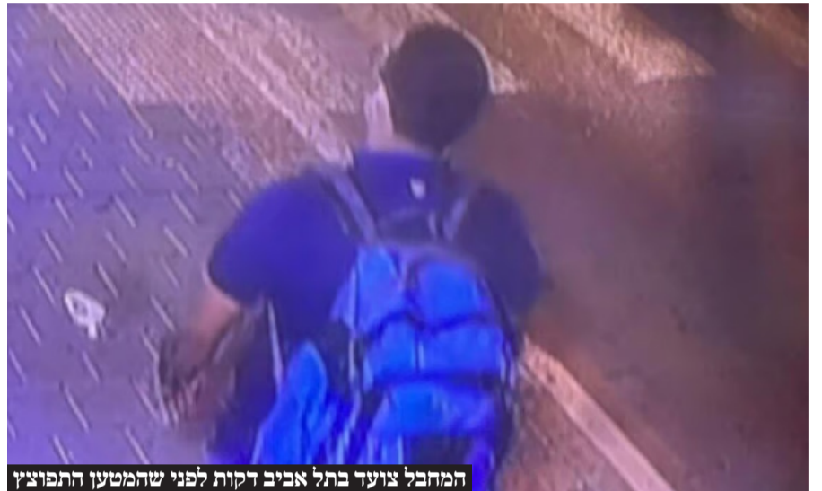
המחבל צועד בתל אביב דקות לפני שהמטען התפוצץ