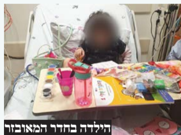
הילדה בחדר המאובזר

ימים ספורים לפני תשעה באב, עלתה קריאה בקבוצת 'מחוברים לחיים' על ילדה שנכנסת לכיכור למשך תקופה ועזר מציון רוצים לארגן לה חדר מאובזר בכובות וחומרי יצירה. מתנדבי ומתנדבות סניף פתח תקווה נרתמו לעזרה ושימחו את הילדה. רפואה שלמה