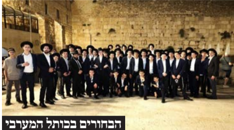
הבחורים בכותל המערבי