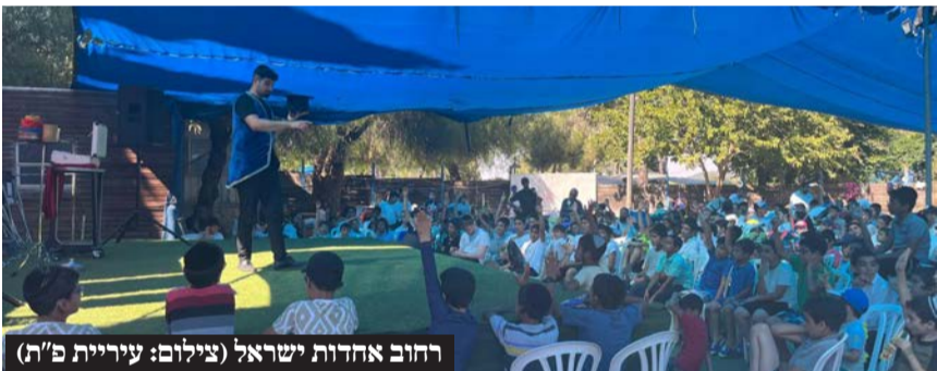
רחוב אחדות ישראל

ביוזמת האגף לתרבות תורנית יצאו אוטובוסים מהשכונות בעיר ובמקום התקיימו הופעות לבני המשפחה