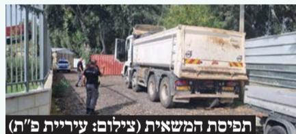
תפיסת המשאית

וכי לא נעשות פעולות הפוגעות באיכות הסביבה. נמשיך לגלות אפס סובלנות כלפי עבריינים הזורקים פסולת בשטחים פתוחים ופוגעים בניקיון העיר ובאיכות החיים בה!"