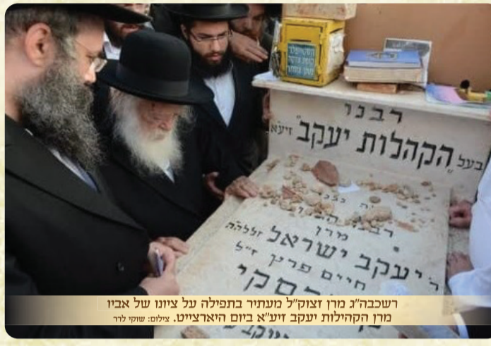
רשכבה"ג מרן זצוק"ל מעטיר בתפילה על ציונו של אביו מרן הקהילות יעקב זיע"א ביום היארצייטו.