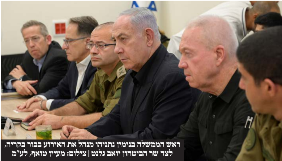
ראש הממשלה בנימין נתניהו מנהל את האירוע בבור בקריה, לצד שר הביטחון יואב גלנט

מאז הפעולה בלבנון, ישראל וארה"ב מנסות להביא להורדת המתחיות. במהלך הועברו בין ישראל לחיזבאללה מסרי הרגעה הדדיים. בירושלים פועלים כדי למנף את הצלחת הסיכול הזה כדי לקדם את ההסדרה בצפון, ללחוץ את חיזבאללה דרך האמריקנים וגורמים בעלי השפעה אחרים לחתור