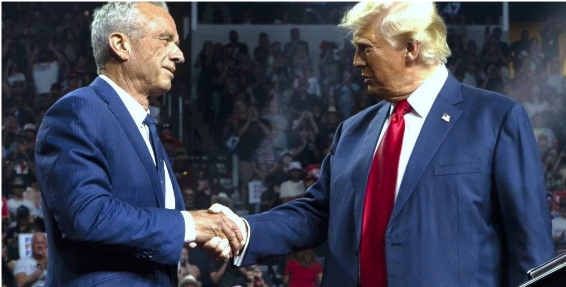
דומה אמריקאית. קנדי מודיע על תמיכתו בטרומפ