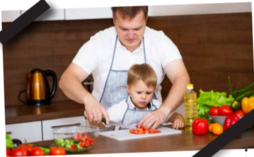
עיק 3 צאון

כולנו נחשפים למזון דרך החושים שלנו - מראה, מגע, רעש, טעם וריח, ככה גם ילדינו • כשאנחנו דורשים מהילדים שלנו לטעום מאכלים חדשים אנחנו יוצרים לא פעם התנגדות מצדם, לכן צריך לנסות לשלב את החשיפה בפעולות יומיומיות טבעיות ללא ויכוחים וללא התניות שייצרו למתוקים דווקא מקום מועדף