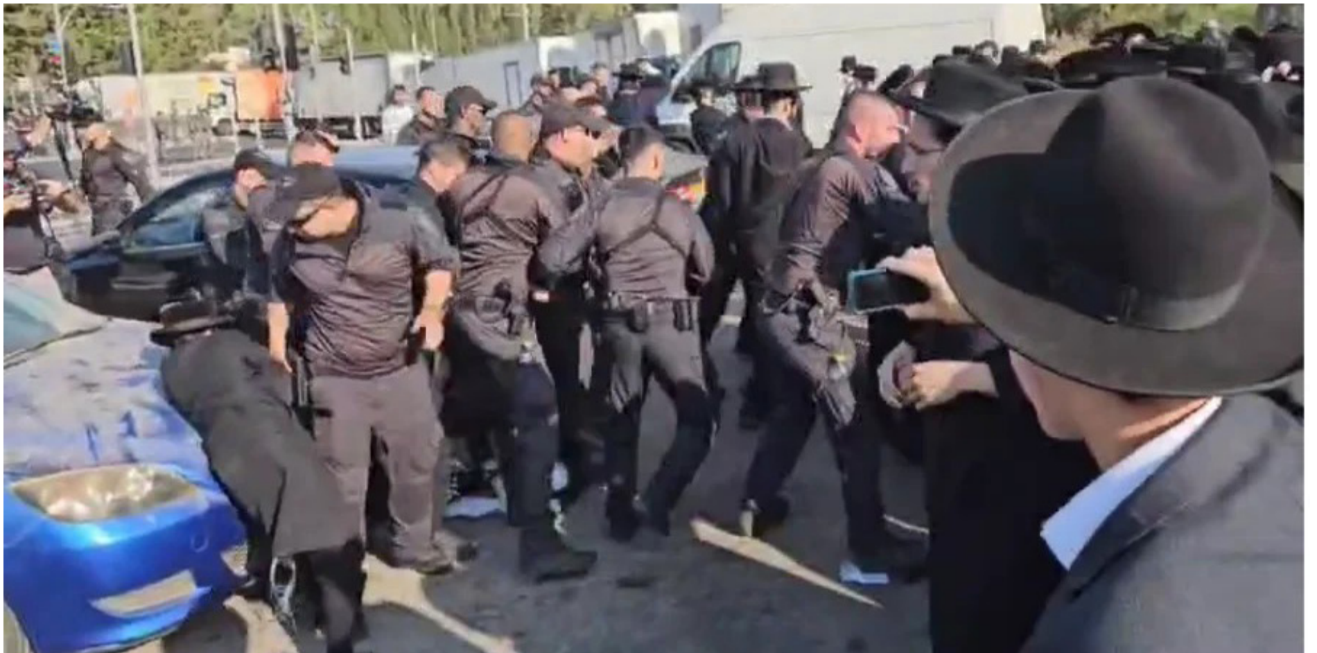
כישלון קולוסאלי והתנגשות עם מפגיני הפלג. ניסיון הגיוס השבוע