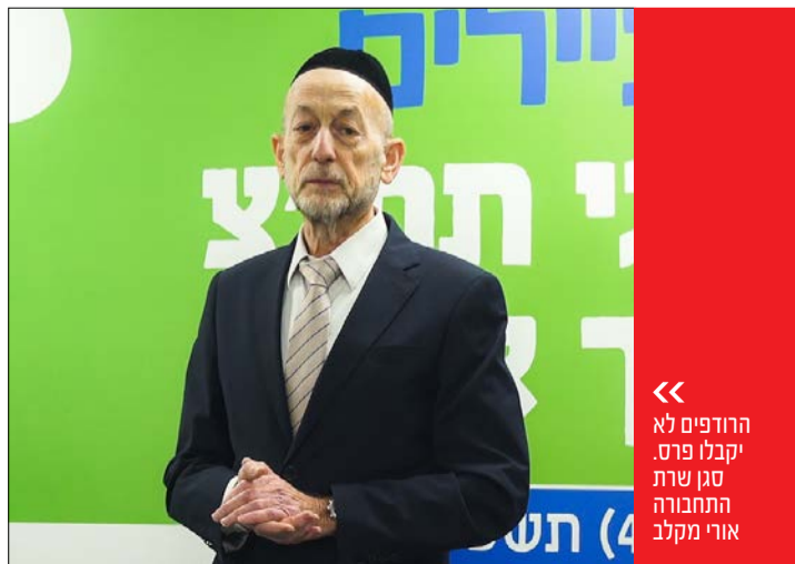
« הודפים לא יקבלו פרס. סגן שרת התחבורה אורי מקלב

במילותיו של מקלב, שמתייחס גם למשבר התקציבי מול רשתות החינוך החרדיות, "אם אתם חושבים שתאתגרו אותנו בחינוך העצמאי ובאופק חדש ובגיוס ובסוף זה יוביל לכך שנצא מהממשלה - זה לא יקרה. שאף עלינו בכל מיני כלים ותרגילים, אז בגלל זה נצא מהממשלה. יש לנו קווים אדומים משלנו, ואנחנו נחליט אם הליכוד עושה את שלו ועומד בהתחייבויותיו כלפינו לפי מה שאנחנו דורשים. אבל לא ניתן לאותם אלו שמנסים להזיק לנו שכן על הרשעות הזו"