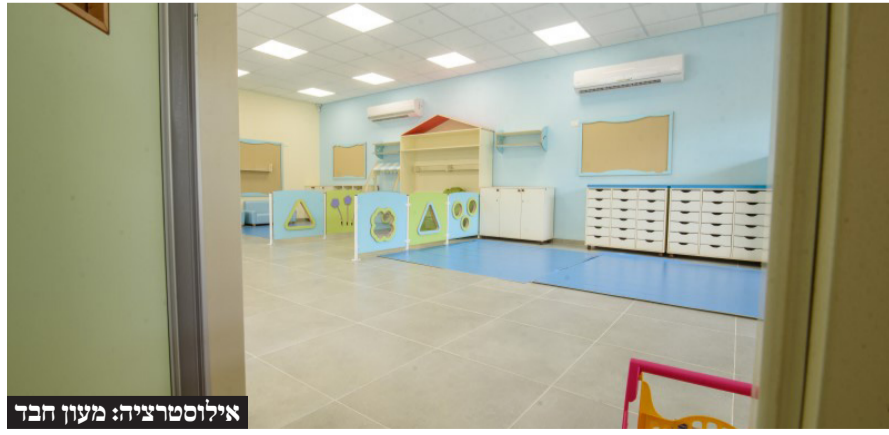
אילוסטרציה: מעון חבד

במהלך ישיבת הממשלה שנערכה השבוע התפתח דיון על סבסוד המעונות