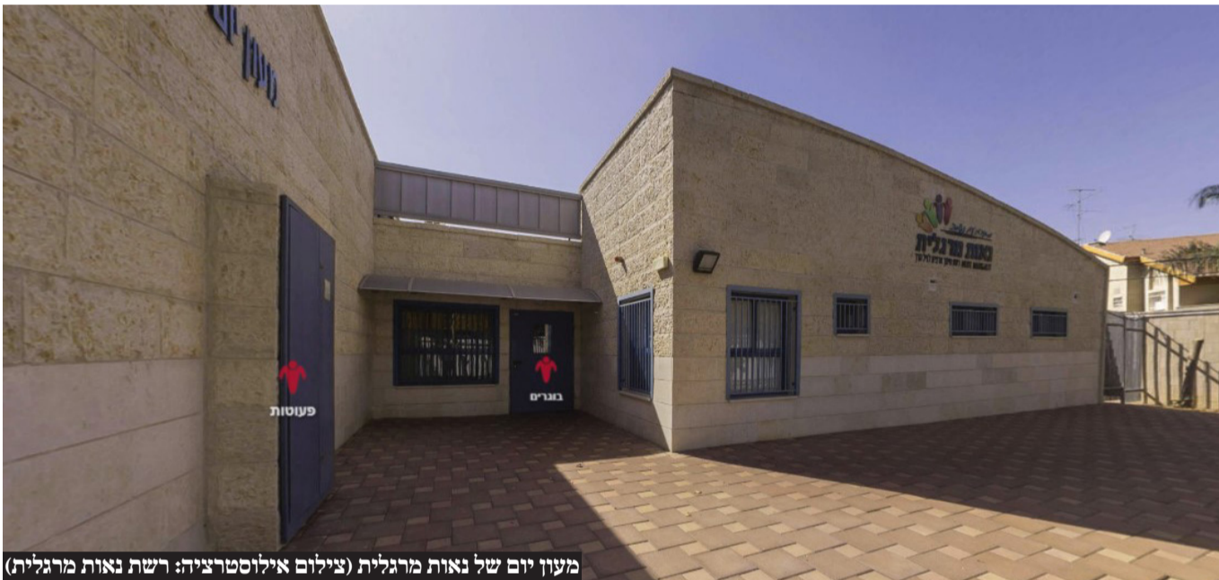
מעון יום של נאות מרגלית

בהחלטה שערורייתית ומקוממת, היועצת המשפטית לממשלה, גלי בהרב מיארה, הודיעה במכתב ששלחה לשר העבודה כי על הממשלה להפסיק לממן מעונות יום למשפחות חרדיות שאב המשפחה מועמד לגיוס לצבא. מדובר באברכים צעירים מגיל 18 ועד גיל 26 שמעתה לא יהיו זכאים לסבסוד במעונות, כך שמדובר במכה הכואבת ביותר שהונחתה עד כה על המגזר החרדי והאברכים הצעירים.