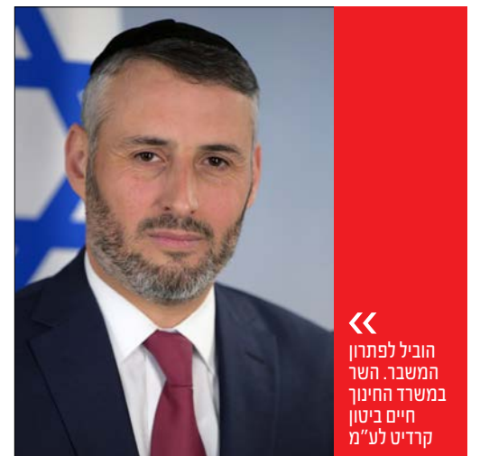
הוביל לפתרון המשבר. השר במשרד החינוך חיים ביטון

בזהירות רבה אפשר לפרט את עיקרי ההבנות בין הצדדים: מחד גיסא, הסכמה של משרד האוצר על כך שהתקציב שהיה עד כה יישאר על כנו, כך גם תנאיהם של המורים והמורות, וגולת הכותרת - כל זה ייעשה ללא התערבות כלשהי בתכני הלימוד. מאידך גיסא, הוסכם על אסדרתו של מנגנון הבקרה על הוצאותיהן של רשתות החינוך, כך שהוצאת כספים על ידי הרשתות תהיה מפוקחת באופן אדוק יותר. בכך בא לידי סיום אחד המשברים היותר חמורים שהתעוררו לאחרונה. וכפי שידענו בחודשים האחרונים לחבוט ולבקר את נציגינו על אוזלת היד בשטחים רבים, כך יש להחמיא להם על טיפול נקי ושקט ופתרון לבעיה מהותית כאשר זו הושגה.