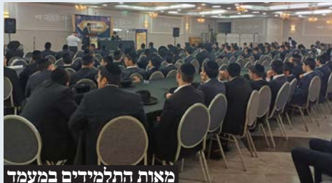
מאות התלמידים במעמד

המעמד התקיים על ידי ארגון 'אקשיבה' בשיתוף עיריית בני ברק