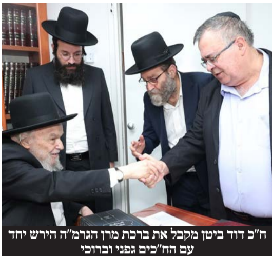
ח"כ דוד ביטן מקבל את ברכת מרן הגרמ"ה הירש יחד עם הח"כים גפני וברוכי

חברי הכנסת משה גפני ואליהו ברוכי הגיעו יחד עם יו"ר ועדת הכלכלה ח"כ דוד ביטן כדי להתברך ע"י מרן הגרמ"ה הירש לאחר אישור חוק הקומה הכשרה • "ישר כח גדול, הקב"ה יתן לך סייטא דשמיא בכל מה שצריך, הזכות הגדולה שעשית תעמוד לצידיך, תהיה לך בוכה עד בלי די", בירך מרן רה"י את ח"כ ביטן