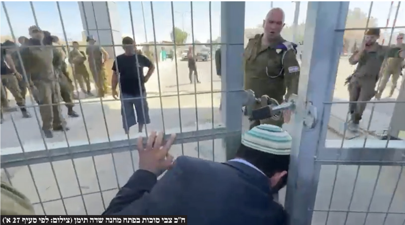
ח"כ צבי סוכות בפתח מחנה שדה תימן (צילום: לפי סעיף 27 א')

השר יריב לוין הגיב: "הודעתי לראות את התמונות הקשות של מעצר חיילים בשדה תימן, בדרך שמתאימה למעצר פושעים מסוכנים. אי אפשר לקבל את זה, גם אם אין ויכוח באשר לחובה לשמור על החוק ועל פקודות הצבא. אסור לשכוח שמדובר בחיילים שעושים עבודת קודש קשה מאין כמוה עבור כולנו, של שמירה על הגרועים שבמחבלים".