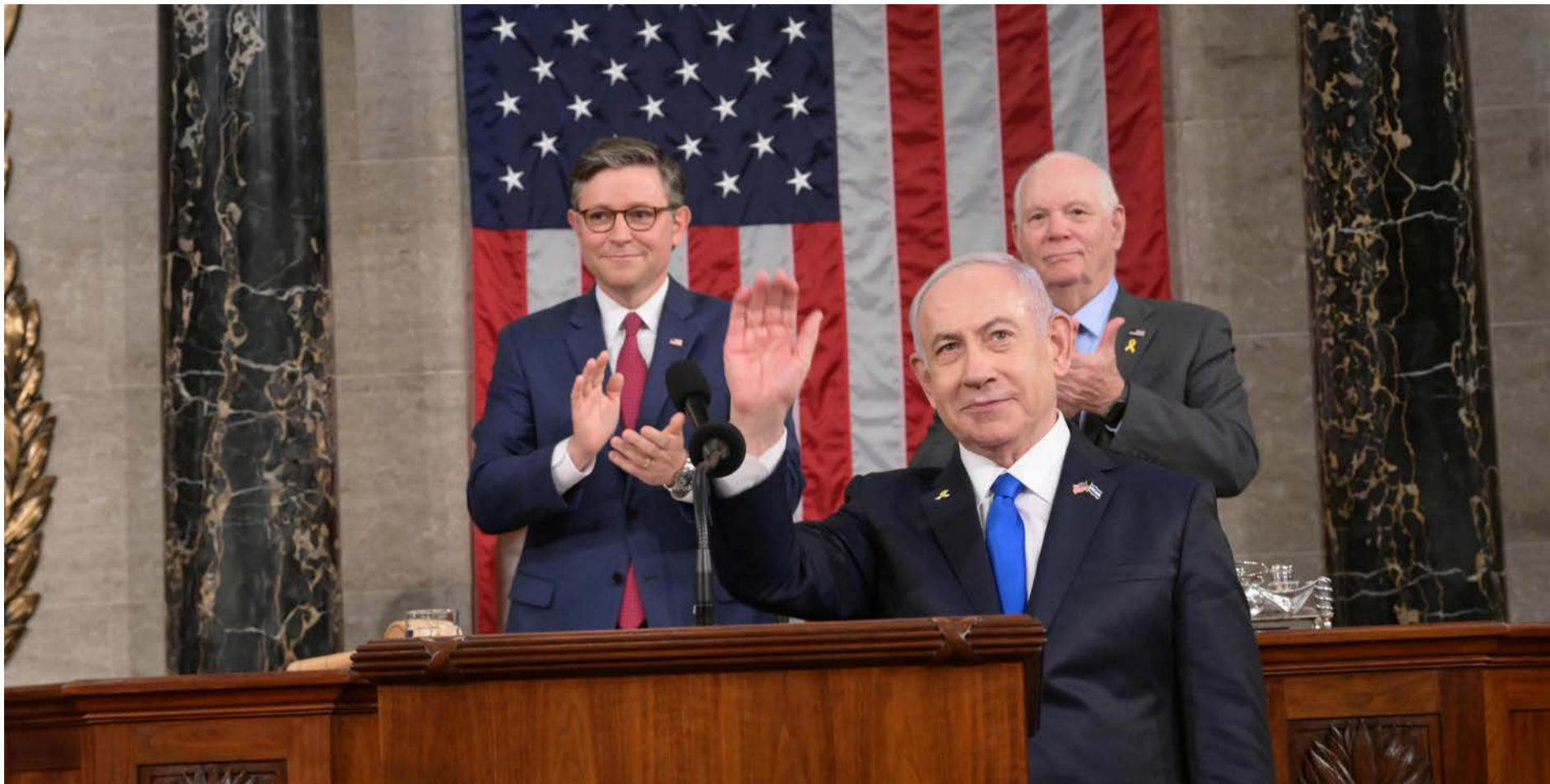
ארבעה מסרים ועוד קצת. ראש הממשלה בבית הנבחרים האמריקני

מה שקרה ביום שני מהווה תגובה אינסטינקטיבית ומתבקשת. בל נטעה, אין הצדקה משום סוג שהוא לפריצה אזרחית לבסיס צבאי, אבל אותם אלו שהכשירו במשך שנה ויותר תופעות אגרסיביות של אנרכיזם, של חסימת כבישים ועורקי תנועה ראשיים, של ניסיונות פריצה למעון ראש הממשלה, לכנסת ולתחנות משטרה, אלו שתקפו שוטרים ולפעמים גם עוברים ושבים, אלו שאיימו במרי אזרחי, בהשבת הצבא וההרס הכלכלה, הם האחראים שיכולים להתלונן על אירועי שדה תימן ובית ליד. המסקנה המתבקשת, כפי שנכתב כאן לא אחת, היא שאין לימין את הפריבילגיה לזוטר על רפורמה משפטית, גם ואולי בעיקר בימי מלחמה. אם מערכת המשפט הייתה מצטרפת גם היא להפסקת האש' הזמנית מצד המערכת הפוליטית, נחא, אבל אם בג"ץ והפרקליטות ממשיכים כמעשה שגרה לרמוס את הרשויות האחרות, להתעלם מהצרכים הלאומיים ולהכתיב את האג'נדה שלהם בכפייה, אזי לא נותרה ברירה ואם הממשלה מעוניינת למשול, היא חייבת לחדש את החקיקה המשפטית.