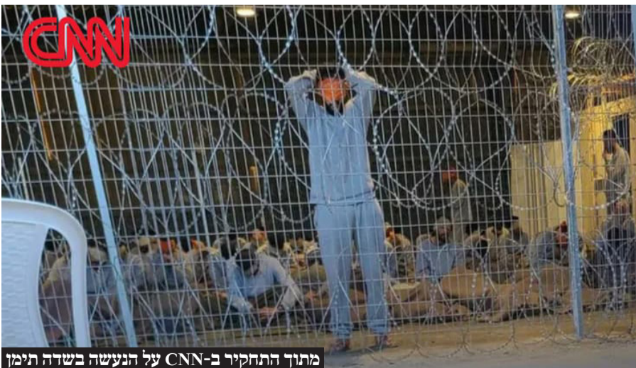
מתוך התחקיר ב-CNN על הנעשה בשדה תימן

בארגון "אימהות הלוחמים" הגיבו: "מדינת ישראל לא מצליחה לעצור את מנגנון ההרס העצמי שלה, חקירתם של חוקרי מחבלי הנוח'בה בחשד להתעללות היא הפקרות ובגידה לאומית בכל מי שנפגע מהמרצחים הנתעבים הללו. המידע