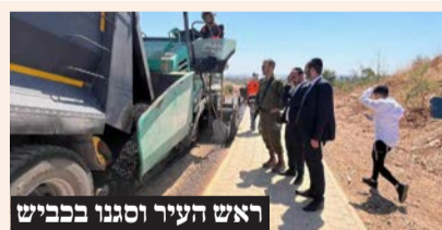
ראש העיר וסגנו בכביש

בעיר אלעד משמשים כ-140 חובשים, פראמדיקים ומגישי עזרה ראשונה במד"א מתנדבים ועובדים בעיר אלעד, ונותנים מענה למקרי חירום רפואיים בעיר ובסביבותיה. האמבולנס של מד"א הוא רכב רפואת חירום ייעודי להענקת טיפול רפואי מציל חיים ופינוי לבית חולים. בכל האמבולנסים של מד"א פועלים חובשי רפואת חירום. הציוד הרפואי שקיים בכל אמבולנס כולל ציוד להנשמה בעת