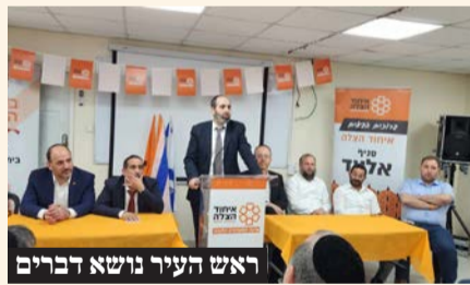
ראש העיר נושא דברים

בית המתנדב של 'איחוד הצלה' באלעד ששופץ לאחרונה נחנך בטקס מיוחד בהשתתפות ראש העיר