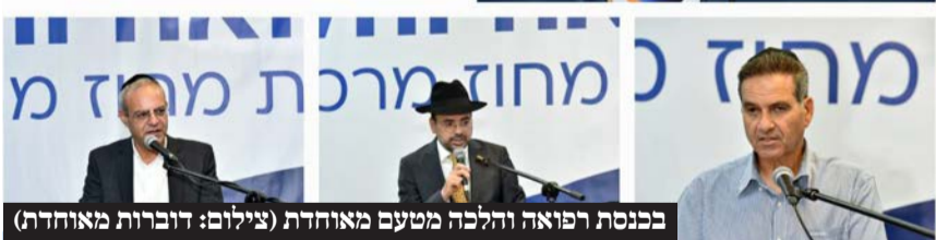
בכנסת רפואה והלכה מטעם מאוחדת