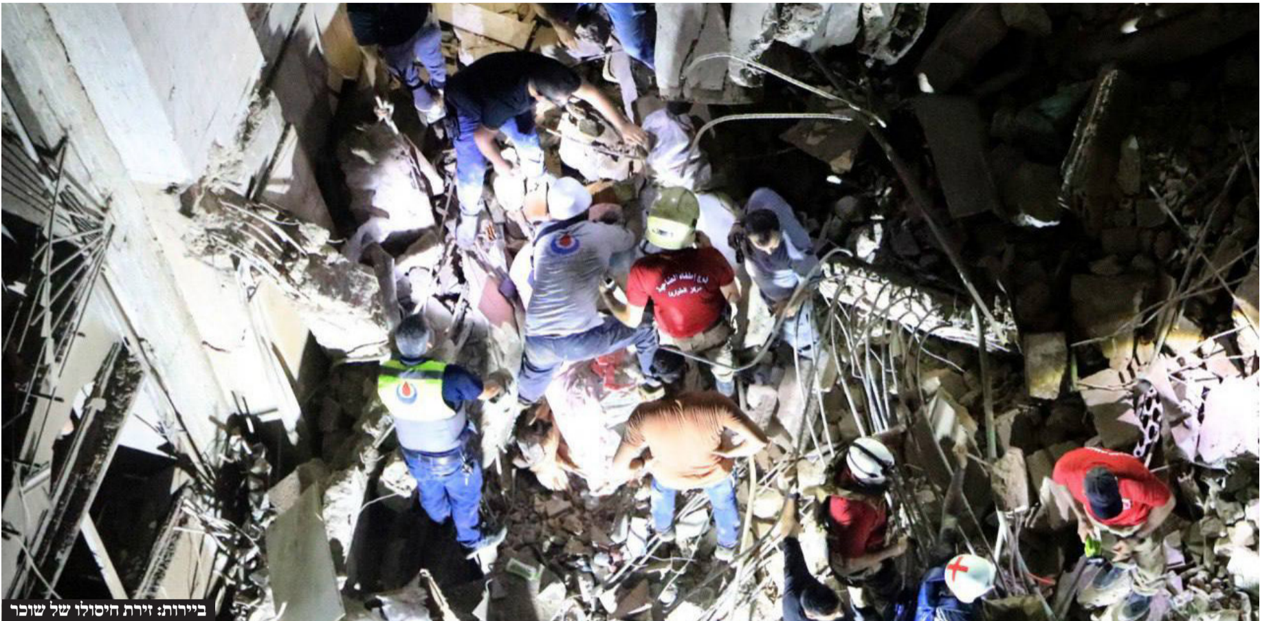
ביירות: זירת היסולו של שוכר

למנהל האדמיניסטרטיבי של האוניברסיטה האיסלאמית. אחרי שחרור מנהיג חמאס אחמד יאסין מהכלא הישראלי ב-1997, הנייה מונה לראש לשכתו. ב-2003 הוא נפצע קל בניסיון ישראלי לחסל את צמרת חמאס בעזה. במהלך האינתיפאדה השנייה התחזק מעמדו של הנייה, וב-2005 נבחר לעמוד בראש רשימת חמאס. שנה לאחר מכן הוא הוביל את ארגון הטרור לניצחון על פתח, ואז הוא נבחר לראש ממשלת הרשות הפלסטינית. באותה השנה הוא שרד ניסיון התנקשות מצד כמה פעילי פתח. ב-2007 החליט נשיא הרשות הפלסטינית אבו מאזן לפטר את הנייה מתפקיד ראש הממשלה בעקבות עימותים בעזה. בחמאס סירבו לקבל את ההחלטה והנייה המשיך לשלוט ברצועה. הנייה הוביל את חמאס במבצע עופרת יצוקה ב-2008, ולא נראה בציבור מחשש לחייו. הוא היה חלק ממובילי עסקת שליט ב-2011. שלוש שנים לאחר מכן, הפציץ חיל האוויר את ביתו של הנייה במהלך מבצע צוק איתן, אולם הוא לא שהה בו באותה העת. ב-2017 נבחר יחיא סינוואר למנהיג חמאס ברצועה והחליף את הנייה שעבר להתגורר בדוחא בירת קטאר. חודש לאחר טבח 7 באוקטובר נהרגו בתקיפה ישראלית ברצועה נכדו הגדול ואחת מנכדותיו. באפריל השנה נהרגו שלושה מילדיו ושלושה מנכדיו בתקיפה ישראלית במחנה הפליטים שאטי. ביוני נהרגה אחותו בתקיפה בשאטי.