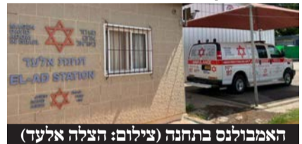
האמבולנס בתחנה

האמבולנס הקהילתי מצטרף לצי רכבי החירום של מד"א בעיר, ויופעל על ידי כוננים מתנדבים במד"א, תושבי המקום. הפעלת האמבולנס הקהילתי באה לאחר פגישת עבודה מיוחדת של הנהלת מד"א - הצלה אלעד עם מנהל אגף מבצעים במד"א גיל מושקביץ במהלכה נדונו הצרכים בעיר, והוחלט לשדרג עוד את מערך הכוננות בעיר.