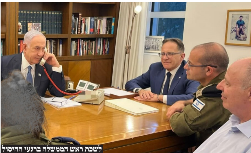
לשכת ראש הממשלה ברגעי היסול

זיאר נח'אלה, ששהה בקומה אחרת, לא היה יעד לתקיפה. על היסול הבכיר בחיזבאללה בצה"ל לקחו אחריות באופן רשמי, בעוד על ההתנקשות בהנייה, נכון לשעת כתיבת השורות, ישראל שותקת, אך בדובר צה"ל עדכנו כי מתקיימת הערכת מצב ביטחונית. "אין שינויים במדיניות ההתגוננות בעורף. אם יוחלט על שינוי כלשהו, נעדכן את הציבור באופן מיידי", נמסר. בחמאס הודיעו כי הנייה חוסל בתקיפה אווירית, וברשת אל-מיאדין הלבנונית, שמזוהה עם חיזבאללה, דווח כי "חוסל באמצעות טיל שסוגר לאיראן ממדינה אחרת". באיראן דיווחו כי הנייה חוסל ב"מעון מיוחד ל'גיבורי מלחמה'". ב"אל-ערבי אל-ג'דיד" הקטארי דווח מפי גורמים יודעי דבר בחמאס כי בבניין שבו חוסל ראש הלשכה המדינית של הארגון שהה גם מנהיג הג'יהאד האיסלאמי זיאד נחאלה. מעט אחרי הדיווח בטלוויזיה האיראנית על היסול, חמאס פרסם הודעה ולפיה "תנועת חמאס מבכה את בני העם הפלסטיני הגדול שלנו, האומה הערבית והאיסלאמית, וכל האנשים החופשיים בעולם. המנהיג האחד, השהיד, הלוחם איסמעיל הנייה. מנהיג התנועה מת כתוצאה מתקיפה ציונית בוגדנית על מקום מגוריו בטהרן, לאחר שהשתתף בטקס השבעתו של הנשיא האיראני החדש". מהבית הלבן נמסר כי ארה"ב מודעת לחיסולו