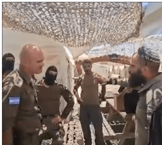
« אנרכיה גם מהצד הימני. הפגנה בשדה תימן

הנקודה האחרונה, וזו שכנראה לא תצא לפועל לפני הבחירות בארה"ב, אבל היא עשויה להיות מורשתו המרכזית של נתניהו, אם וכאשר - ברית אברהם. לפי חזונו של ראש הממשלה, יקימו מדינות הסכמי אברהם, יחד עם מדינות נוספות שתצטרפנה אליהן (סעודיה, למשל) ברית הגנה מקבילה לברית נאט"ו האירופית, בהובלתה ובהשתתפותה של ארה"ב. במקרה כזה, יהפוך המאבק בציר הרשע האיראני, ואולי גם במגלומן הטורקי, לעניין כלל מזרח תיכוני, תוך גיבושם של כל בעלי האינטרס לבלום את עלייתו של האסלאם השיעי הקיצוני