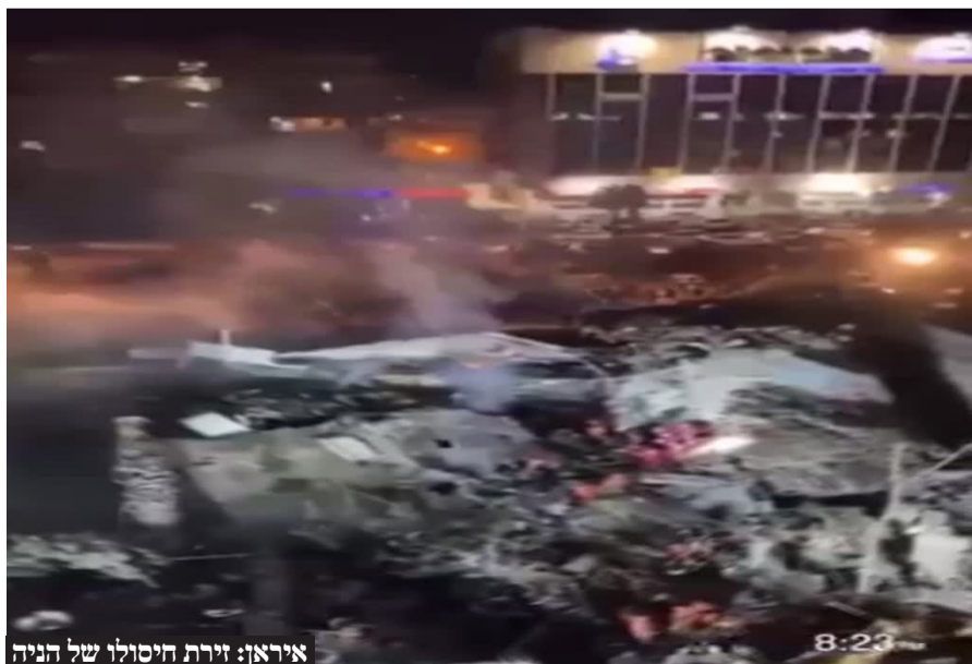
איראן: זירת חיסולו של הנייה

הוא הוסיף: "פנינו אינן למלחמה אך אנו ערוכים אליה היטב. ב-8 באוקטובר חיזבאללה פתח במלחמה. אנו נלחמים בנחישות, פוגעים בתשתיות של חיזבאללה. הוא ארגון טרור שלא בוחל ברצח אזרחים באשר הם. חיזבאללה גורר את לבנון וכל המזרח התיכון להסלמה".