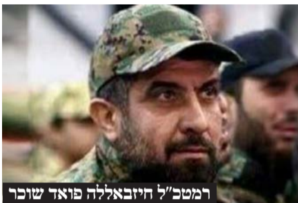
רמטכ"ל חיזבאללה פואד שוכר

באבוד רשעים רינה: בלילה אחד ובהפרש של שעות בודדות, חוסלו בזה אחר זה בהפתעה שני בכירים בולטים בארגוני הטרור חיזבאללה וחמאס • רמטכ"ל חיזבאללה פואד שוכר, חוסל בתקיפה של מטוסי F-35 בדאחיייה בניירות • ראש הלשכה המדינית של חמאס, איסמעיל הנייה, שחגג את הטבח ב-7 באוקטובר, חוסל בבית הארחה בבירת איראן