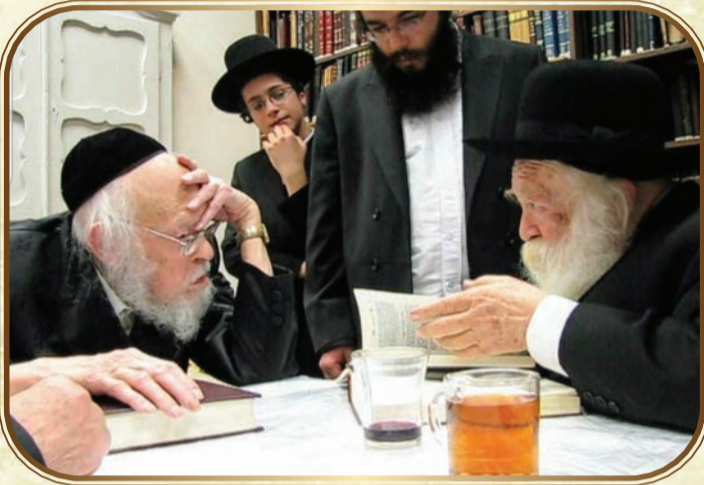
מרן זצוק"ל בביקור אצל חמוי רשנבה"ג מרן הגריש אלישיב זצוק"ל