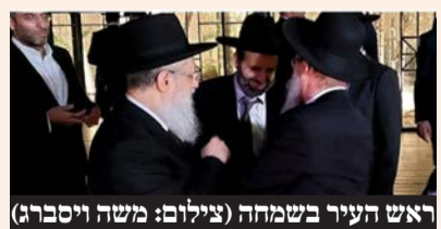
ראש העיר בשמחה