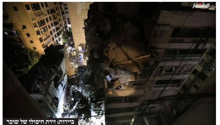
ביירות: זירת היסולו של שוכר