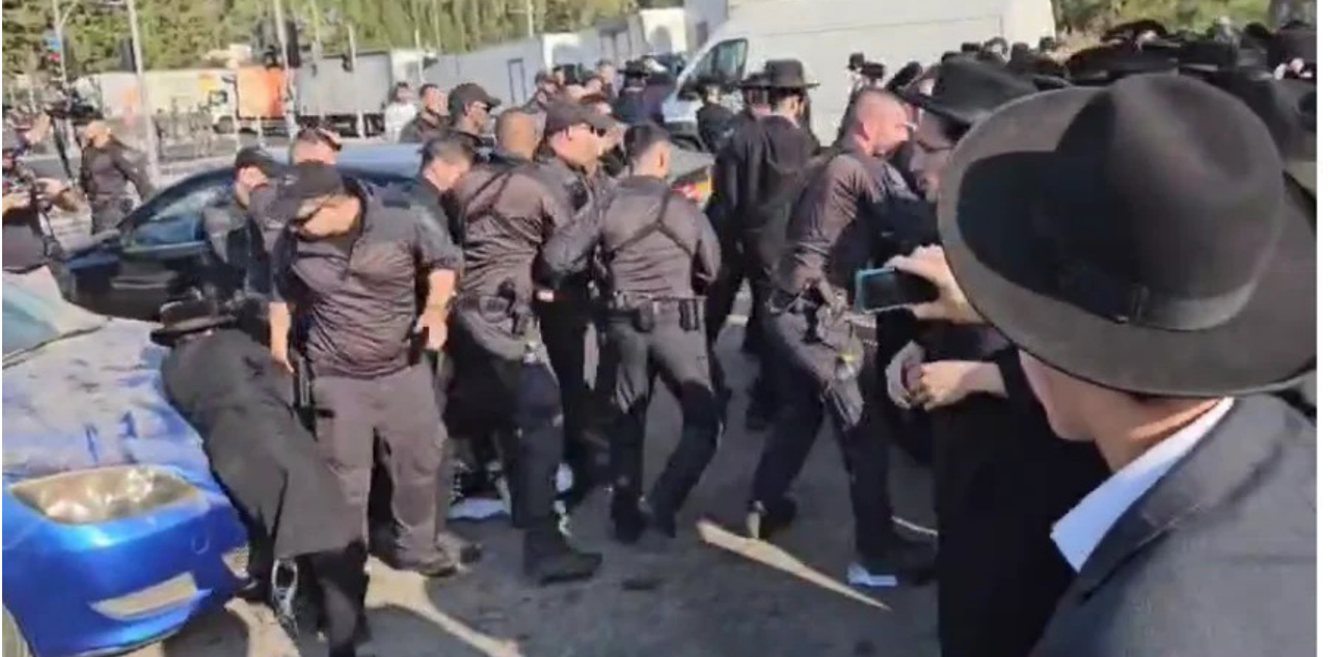
כישלון קולוסאלי והתנגשות עם מפגיני הפלג. ניסיון הגיוס השבוע

ישראל, ומ"מ ולו משום חילול השם, יש בנותן טעם להשתדל להימנע מעודף נוכחות פומבית של נציגות תורנית באתרי הנופש וכדומה.