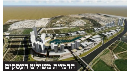
הדמיית משולש העסקים

קבוצת שבירו זכתה בשני מתחמים סמוכים תמורת כ-28.5 מיליון שקלים, עליהם תקים שני מגדלים עם יותר מ-60 אלף מ"ר למסחר ותעסוקה בסמוך למחלף נחשונים. רייסדור זכתה במכרז נוסף תמורת 15 מלש"ח לבניית מגדל בן 20 קומות ו-44 אלף מ"ר