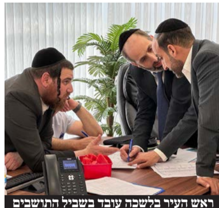
ראש העיר בלשכה עובד בשביל התושבים