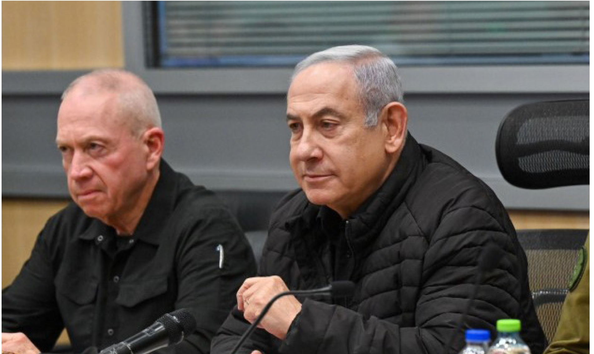
מאבק אישי בלתי פוסק. ראש הממשלה ושר הביטחון

ו-2020, ולפיהם - חרף הפריצה של האריס - היא טרם הגיעה לעמדה שמאפשרת לה לנצח.