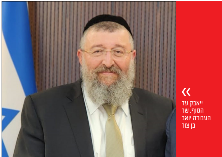
« ייאבק עד הסוף. שר העבודה יואב בן צור