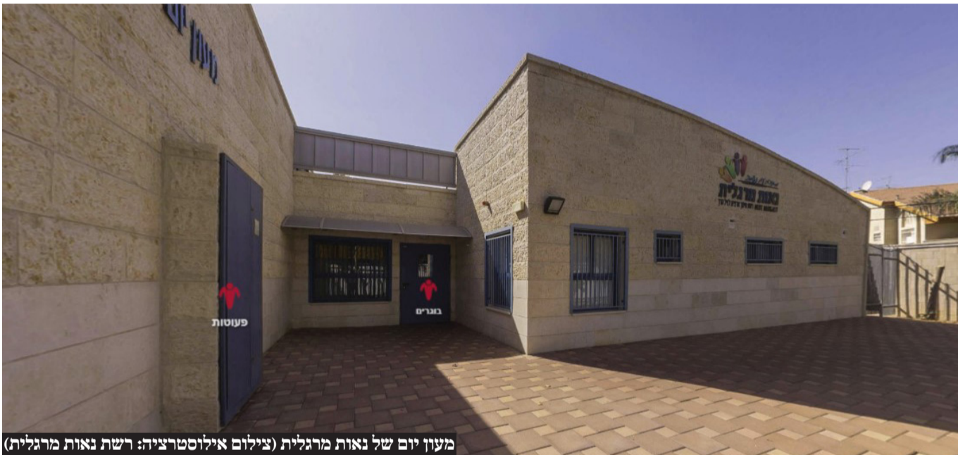
מעון יום של נאות מרגלית

בהחלטה שערורייתית ומקוממת, היועצת המשפטית לממשלה, גלי בהרב מיארה, הודיעה במכתב ששלחה לשר העבודה כי על הממשלה להפסיק לממן מעונות יום למשפחות חרדיות שאב המשפחה מועמד לגיוס לצבא. מדובר באברכים צעירים מגיל 18 ועד גיל 26 שמעתה לא יהיו זכאים לסבסוד במעונות, כך שמדובר במכה הכואבת ביותר שהונחתה עד כה על המגזר החרדי והאברכים הצעירים.