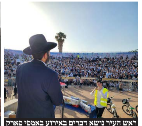
ראש העיר נושא דברים באירוע באמפי פארק

מה דעתך על מה שהתרחש בישיבת המועצה האחרונה?