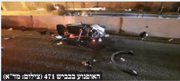
האופנוע בכביש 471