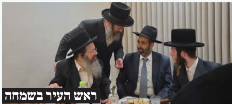
ראש העיר בשמחה