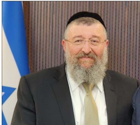
« ייאבק עד הסוף. שר העבודה יואב בן צור