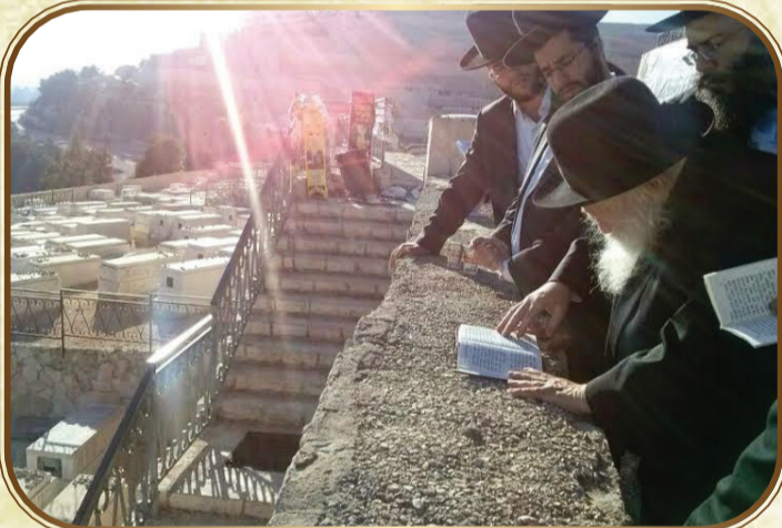
מרן זצוק"ל בציון חמוי רשנבה"ג מרן הגריש אלישיב זצוק"ל ביום היארצייט