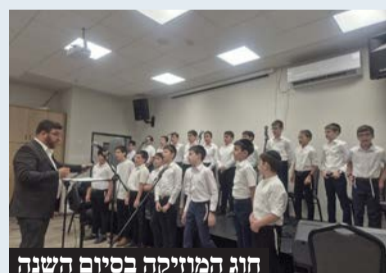
חוג המוזיקה בסיום השנה

החל מהשבוע נערכים שורה ארוכה של מופעי מחול, מופעי דרמה, מופעי התעמלות קרקע, מוזיקה ועוד