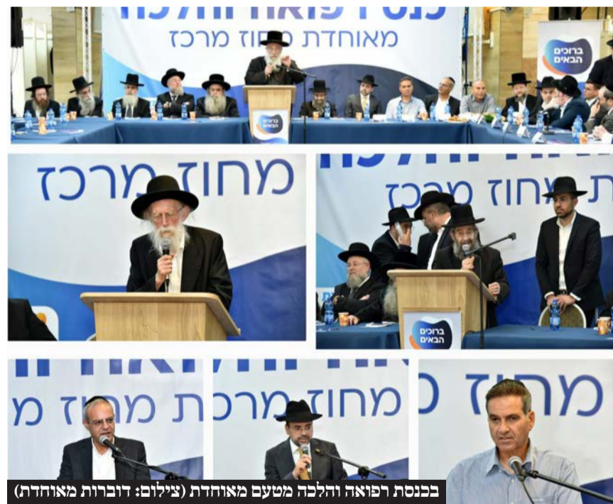
בכנסת רפואה והלכה מטעם מאוחדת

בכינוס התקיימו מושבים בנושא רפואה דחופה בשבת ובנושא צומות רפואה בהשתתפות גדולי המומחים של מאוחדת יחד עם גדולי הפוסקים והמוצי"צים