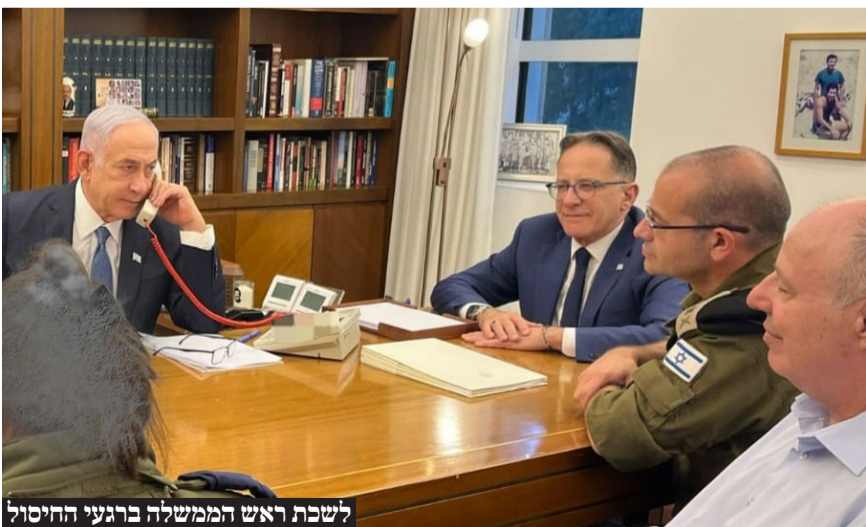
לשכת ראש הממשלה ברגעי החיסול

מעט אחרי הדיווח בטלוויזיה האיראנית על החיסול, חמאס פרסם הודעה ולפיה "תנועת חמאס מבכה את בני העם הפלסטיני הגדול שלנו, האומה הערבית והאיסלאמית, וכל האנשים החופשיים בעולם. המנהיג האחד, השהיד, הלוחם איסמעיל הנייה. מנהיג התנועה מת כתוצאה מתקיפה ציונית בוגדנית על מקום מגוריו בטהרן, לאחר שהשתתף בטקס השבעתו של הנשיא האיראני החדש". מהבית הלבן נמסר כי ארה"ב מודעת לחיסולו