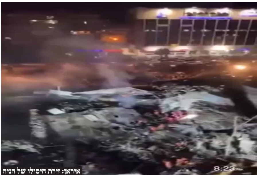
איראן: זירת חיסולו של הנייה

הוא הוסיף: "פנינו אינן למלחמה אך אנו ערוכים אליה היטב. ב-8 באוקטובר חיזבאללה פתח במלחמה. אנו נלחמים בנחישות, פוגעים בתשתיות של חיזבאללה. הוא ארגון טרור שלא בוחל ברצח אזרחים באשר הם. חיזבאללה גורר את לבנון וכל המזרח התיכון להסלמה".