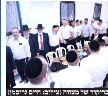
בריקוד של מצווה