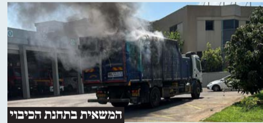
המשאית בתחנת הכיבוי

נהג משאית בוערת הגיע בנסיעה לתחנת פתח תקווה, לוחמי האש השתלטו על האש ובנס לא היו נפגעים