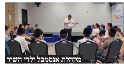
מקהלת אנסמבל ילדי השיר

בטקס חולקו תעודות הצטיינות נערכה הגרלה על ערכת די ג'י ביתית