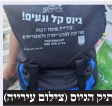
תיק הגיוס