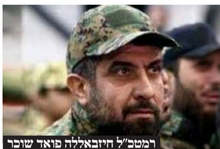
רמטכ"ל חיזבאללה פואד שוכר

באבוד רשעים רינה: בלילה אחד ובהפרש של שעות בודדות, חוסלו בזה אחר זה בהפתעה שני בכירים בולטים בארגוני הטרור חיזבאללה וחמאס • רמטכ"ל חיזבאללה פואד שוכר, חוסל בתקיפה של מטוסי F-35 בדאחיייה בניירות • ראש הלשכה המדינית של חמאס, איסמעיל הנייה, שחגג את הטבח ב-7 באוקטובר, חוסל בבית הארחה בבירת איראן