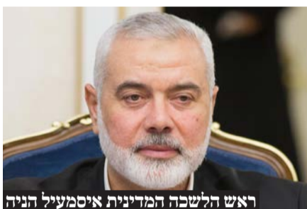
ראש הלשכה המדינית איסמעיל הנייה