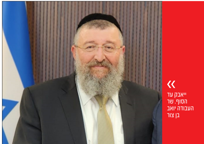
« ייאבק עד הסוף. שר העבודה יואב בן צור