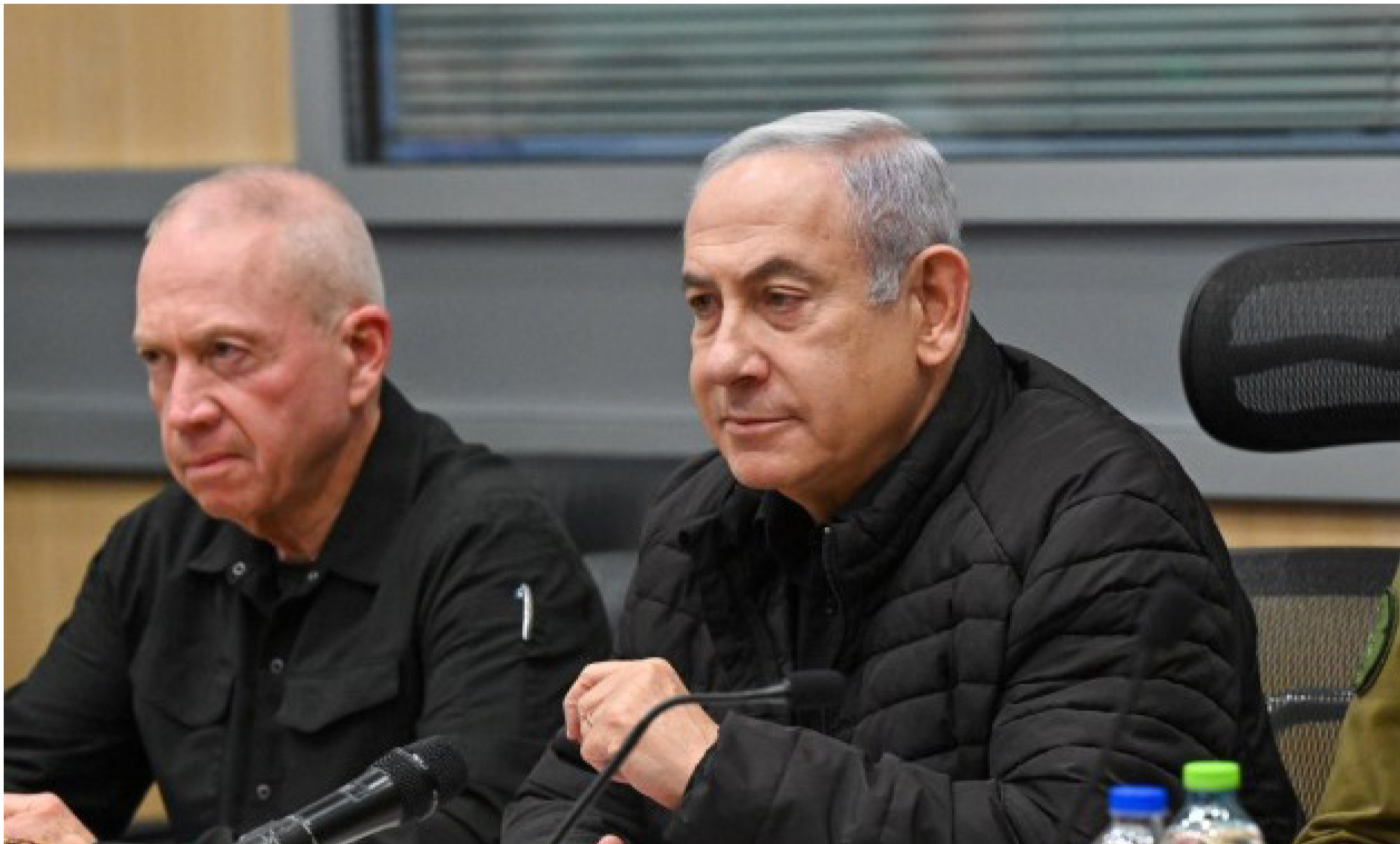
מאבק אישי בלתי פוסק. ראש הממשלה ושר הביטחון

ו-2020, ולפיהם - חרף הפריצה של האריס - היא טרם הגיעה לעמדה שמאפשרת לה לנצח.