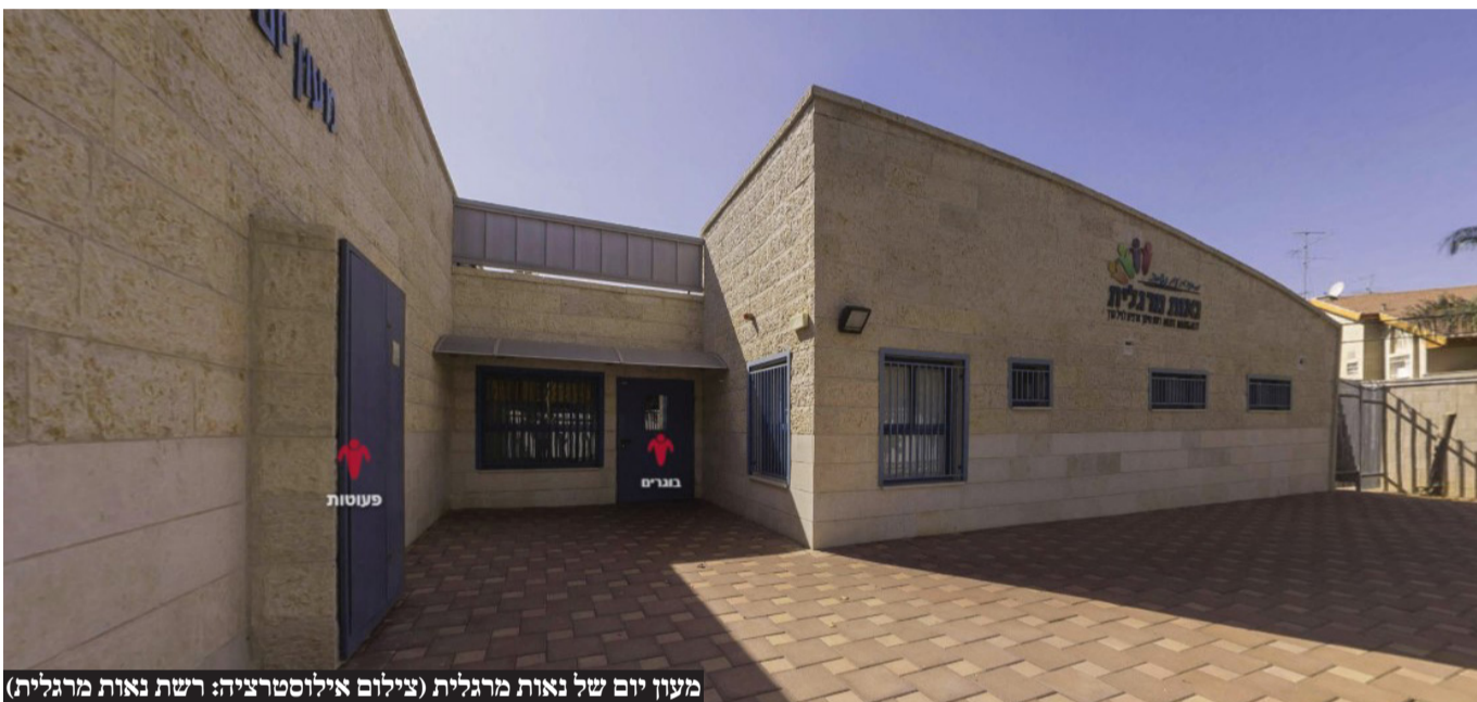
מעון יום של נאות מרגלית

בהחלטה שערורייתית ומקוממת, היועצת המשפטית לממשלה, גלי בהרב מיארה, הודיעה במכתב ששלחה לשר העבודה כי על הממשלה להפסיק לממן מעונות יום למשפחות חרדיות שאב המשפחה מועמד לגיוס לצבא. מדובר באברכים צעירים מגיל 18 ועד גיל 26 שמעתה לא יהיו זכאים לסבסוד במעונות, כך שמדובר במכה הכואבת ביותר שהונחתה עד כה על המגזר החרדי והאברכים הצעירים.