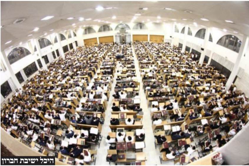
היכל ישיבת חברון

סוגיית גיוס בני הישיבות מסעירה את המדינה בימים אלו, וזה הזמן לצלול לאינטרסים הסמויים של מי שמלבים את האש ועומדים מאחורי הקמפיילים סביב הנושא שקורע את הציבור בישראל. ספוילר: אף אחד מהם לא באמת מעוניין בגיוס חרדים באמת. למעשה, חלקם הגדול חושש מהשתלטות חרדית על הצבא ומשתמש בסוגיה הרגישה בכדי לפרוץ את הברית שבין הציבור החרדי לציבור הימני והמסורתי בישראל. הא ותו לא.