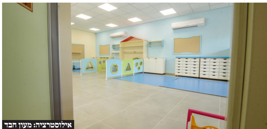
אילוסטרציה: מעון חבד

במהלך ישיבת הממשלה שנערכה השבוע התפתח דיון על סבסוד המעונות