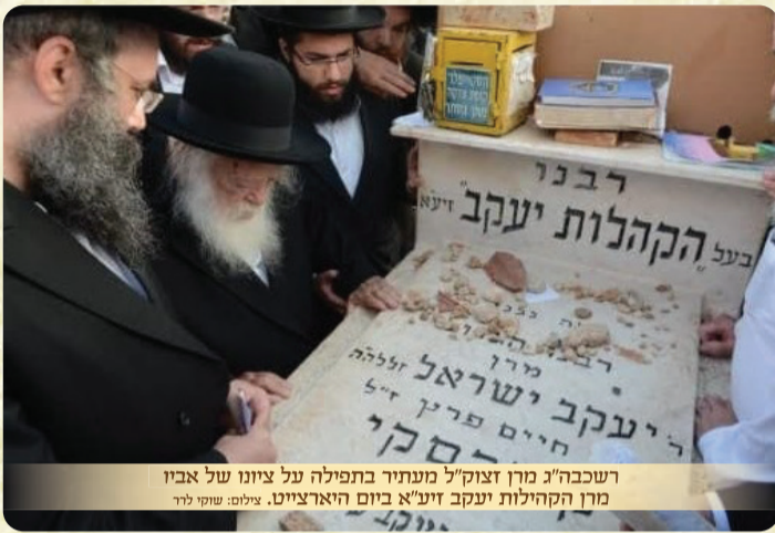
רשכבה"ג מרן זצוק"ל מעתיק בתפילה על ציונו של אביו מרן הקהילות יעקב זיע"א ביום היארצייטו.