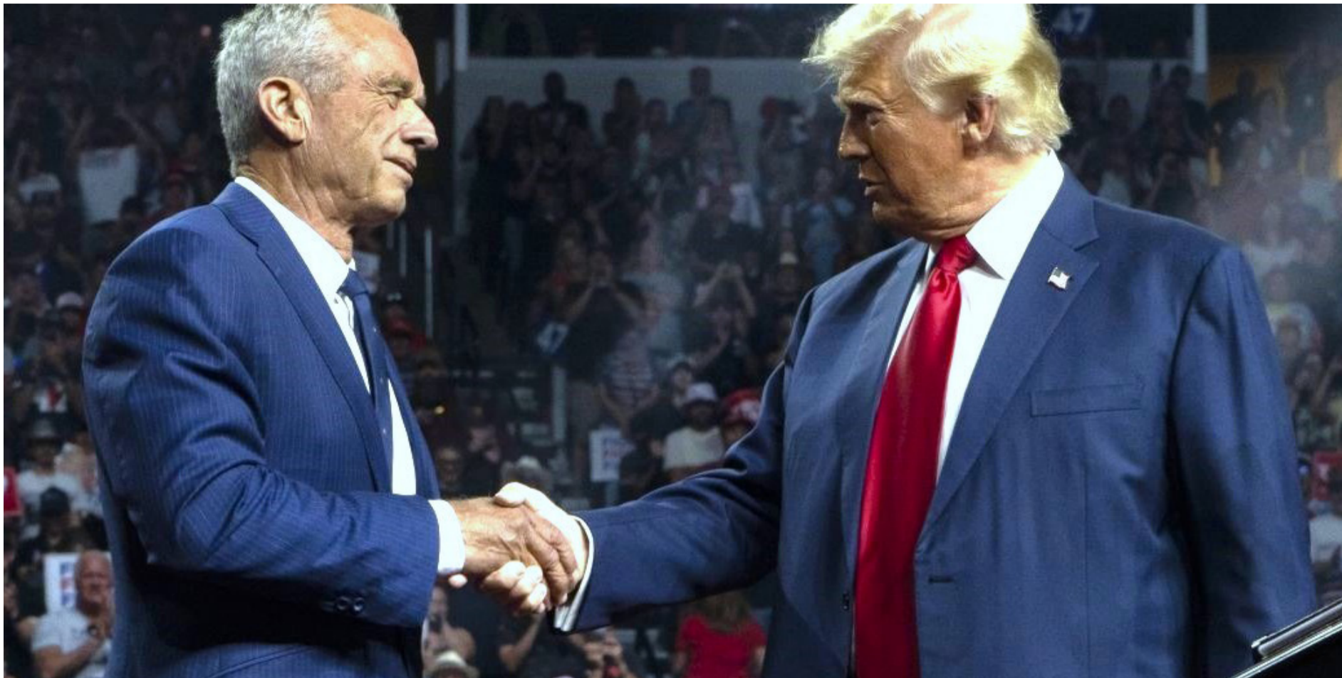
דומה אמריקאית. קנדי מודיע על תמיכתו בטרומפ