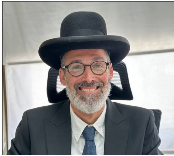
« יקבל את תמיכת סמוטריץ' ודרעי? הרב מאיר כהנא

מבחינת קמלה האריס, חזית ישראלית בלבנון תהיה הרסנית לאלקטורט הדמוקרטי, היא תחדד את המלכוד שהיא נמצאת בו בין הקול היהודי ומצביעי המרכז הפרו ישראלים ובין הקול המוסלמי ומצביעי השמאל הקיצוני הפרו פלסטיני. גם בשלב הנוכחי של מערכת הבחירות האריס עשויה להפסיד במדינות מפתח כמו מישגן ופנסילבניה בגלל חוסר היכולת לתמרן בין הקצוות, להחזיק את החבל בשני צדדיו. מצב של החמרה משמעותית וחזרתה של ישראל לכותרות הראשיות בתקשורת האמריקנית, והאריס תוכל כנראה להיפרד סופית מחלום הנשיאות