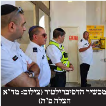
מכשיר הדפיברילטור