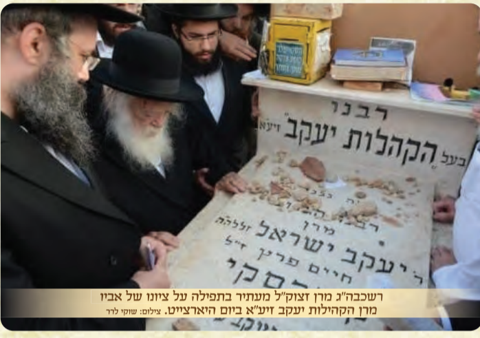
רשכבה"ג מרן זצוק"ל מעתיק בתפילה על ציונו של אביו מרן הקהילות יעקב זיע"א ביום היארצייטו.