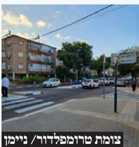
צומת טרומפלדור/ ניימן

לאחר שנים שבצומת התרחשו תאונות רבות, ובעקבות תלונות התושבים, העירייה צמצמה את היציאה מרחוב ניימן לנתיב אחד מה שימנע תאונות בצומת הבעייתית. אחד התושבים ברחוב ניימן ל'השבוע בפתח תקווה': אני שמח שסוף סוף סידרו את הצומת, אך נראה שעשו את זה חובבני מידי כי כעת תנועה מניימן תיעצר ויווצרו פקקים נוראיים".