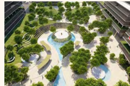
הדמיה להמחשה: לאה שניאור אדריכלים ר"מידות ומעשי נוף"

העירייה מקדמת את אישור ההסכם העקרוני להקמת פקולטה לרפואה מטעם אוניברסיטת ת"א, במתחם הקריה האקדמית פ"ת