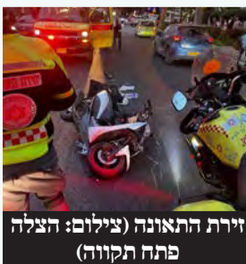
זירת התאונה