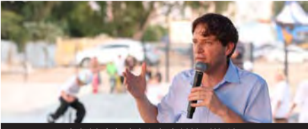
ראש העיר במסגרת הפתיחה

הסקייטפארק החדש של פתח תקווה נבנה בסגנון פלזה ויש בו שלושה מתחמים שונים, אחד מהם מדמה רחוב, מתחם נוסף מזכיר מקום אהוב על סקייטרים בעולם