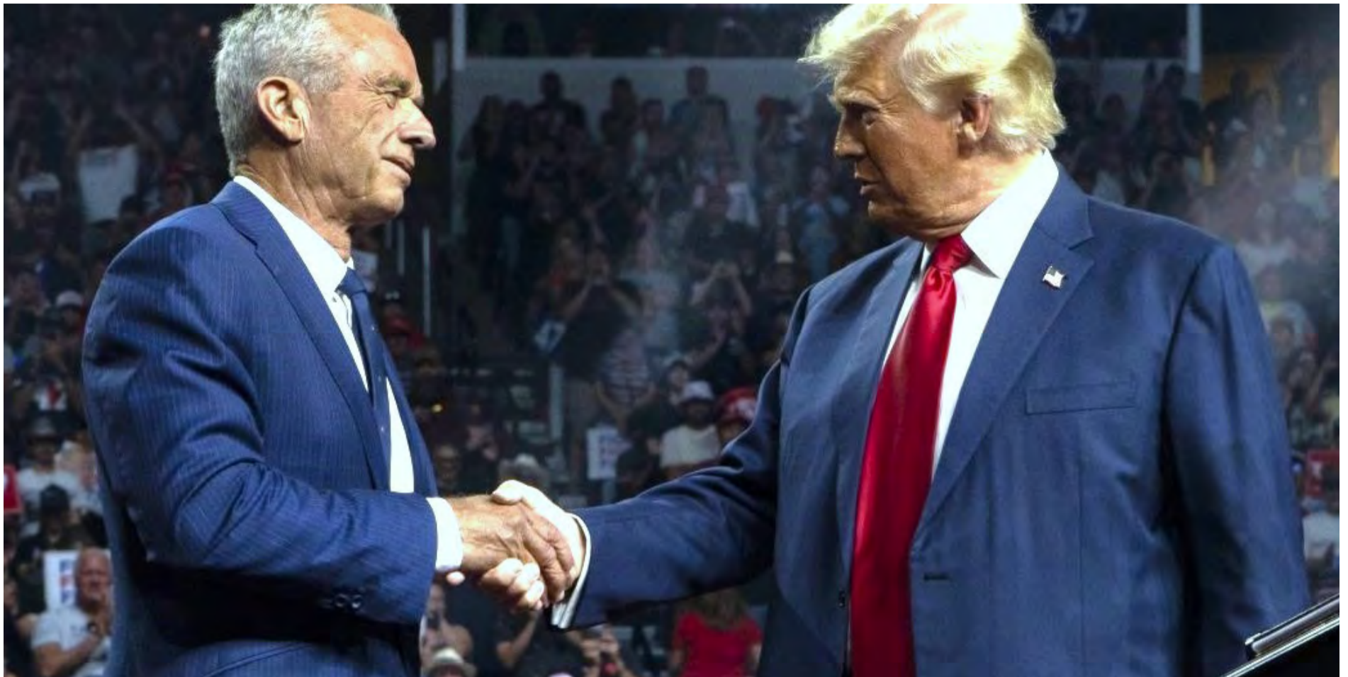
דומה אמריקאית. קנדי מודיע על תמיכתו בטרומפ

השופטים החסרים למבוי סתום, לפחות עד להשגת פשרה ראויה.