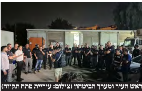
ראש העיר ומערך הביטחון

וסטים קרמיים וקסדות טקטיות חולקו לאנשי אגף הביטחון