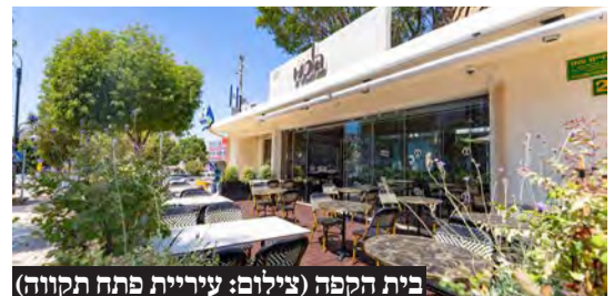
בית הקפה

בית הקפה נבנה ברחוב חיים עזר במבנה עתיק שסמוך לעיריית פתח תקווה