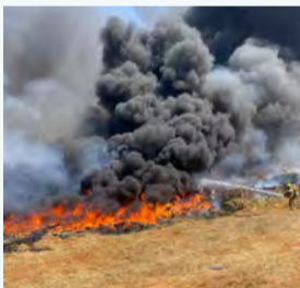
השריפה בכפר גנים

לוחמי האש של תחנת פ"ת בסיוע של 5 צוותי כיבוי פעלו בשבוע שעבר בשריפת מחסן סמוך לכפר גנים ג' ברח' דרך יצחק רבין בפ"ת. במקום פעלו כ-6 צוותי כיבוי. מפקד תחנה אזורית פ"ת טפסר משנה אלון שבתאי שהיה אף הוא במקום: "מדובר בשריפה של מבנה אשר סביבו ישנם כלים חקלאיים וצינורות פלסטיק שבוערים ובשל כך עשן כבד נראה באזור, בשלב זה השריפה מתוחמת, במקביל נבצע פעולות ניטור האוויר עקב העשן באזור".