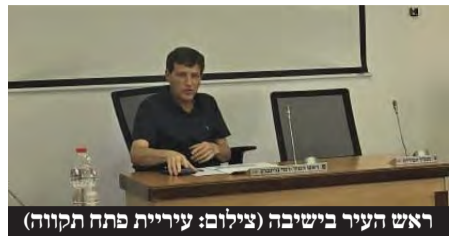
ראש העיר רמי גרינברג יושב בראש שולחן בישיבת פתח תקווה

81,700 תלמידים יחלו את הלימודים בשבוע הבא בפתח תקווה • תתגבר האבטחה סביב מוסדות החינוך