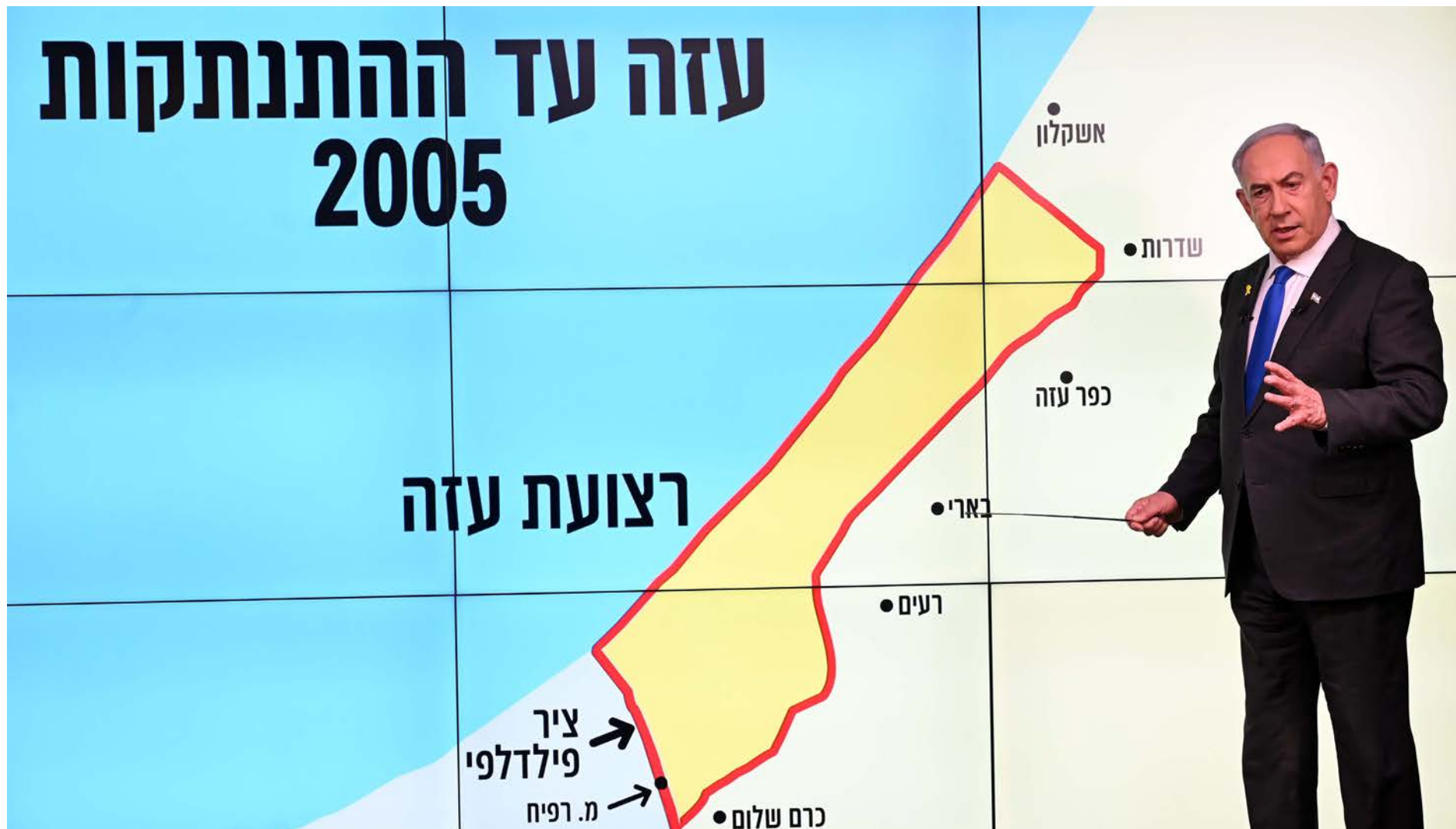
ההופעה הטובה ביותר. נתניהו במסיבת העיתונאים

נתניהו, כך נדמה, רק חיכה למי שירים לו להנחתה. בתשובה ערוכה וכמעט בוודאות מוכנה מראש, הוא הבהיר כי מבחינתו הוא יכול לעבוד עם שר הביטחון "כל עוד קיימים בינינו יחסי אמון", אבל מיהר להוסיף באותה נשימה שאותם יחסי אמון מדוברים, דורשים מכל חבר בקבינט לקבל את החלטות הקבינט ולא לפעול נגדן, וכי "כעת הדבר נבחן". במילים אחרות, גלנט הוזהר שלא לשחק באש ולבחוש שוב בקלחת העסקה, ולא לנסות להפעיל לחץ תקשורתי על ראש הממשלה, אם איננו חפץ לחתום אבטלה.