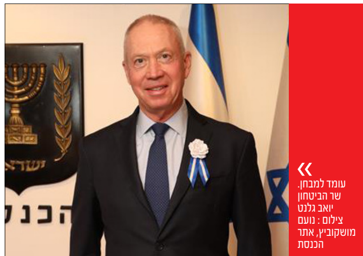
« עומד למבחן. שר הביטחון יואב גלנט

« הופעתו של נתניהו חוללה פלאים. ראש הממשלה הרס תחילה את התזה לפיה הוצע על ידי חמאס בשלב כלשהו לשחרר את כל החטופים, וחשף כי גם בשלב הנוכחי ואחרי הרבה מאוד מיקוח, מדובר על החזרתם של פחות מרבע (!) מהחטופים שנותרו. ממילא, מובנת גם התעקשותה של ישראל לאפשר לה לחזור מיידית בתום הפוגה לחימה, ולא להזניח את שאר עשרות החטופים שלא ישוחררו ולהשאיר אותם במצבו של רון ארד