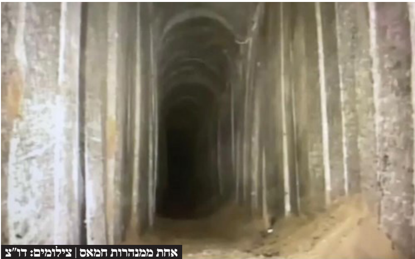
אחת ממנהרות חמאס

כוחות צה"ל איתרו את גופות ששת החטופים שנרצחו באכזריות איומה במנהרה ברפיח שנמצאת במרחק של קילומטר מזו שבה נמצא החטוף פרחאן קאדי שחולץ. נתניהו דרש בקבינט ממערכת הביטחון להביא המלצות לגביית מחיר כבד מחמאס בתוך 24-48 שעות