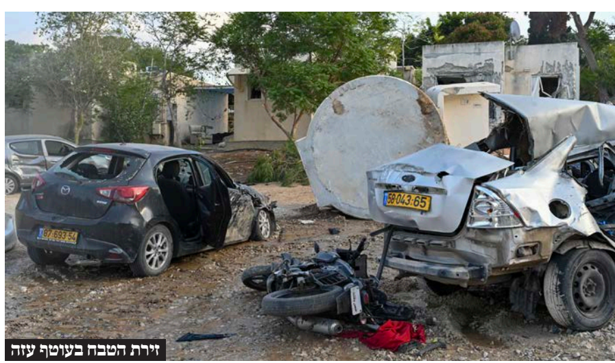
זירת הטבח בעוטף עזה

הוא מוסיף כי "אנחנו מדברים על לחץ צבאי כוללני שאמור להיות מופעל על חמאס. אני בכלל לא מדבר רק על רצועת עזה, אני מדבר על כך שאם מרכז הארץ מאוים - אם תל אביב מאוימת - אז לא רק נהרוס את המשגרים, אלא אנחנו נפגע בבירות. אם יוצא מחבל ורוצח מישוהו ברחבי הארץ, אז לא רק נהרוס לו את הבית, אלא נגרש את כל משפחתו. כשהם יראו ששינינו כיוון אז גם הם יבינו שאנחנו לא נוותר."