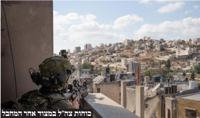
כוחות צה"ל במצוד אחר המחבל

מנחם הירשמן | צילומים: דו"צ ודוברות המשטרה