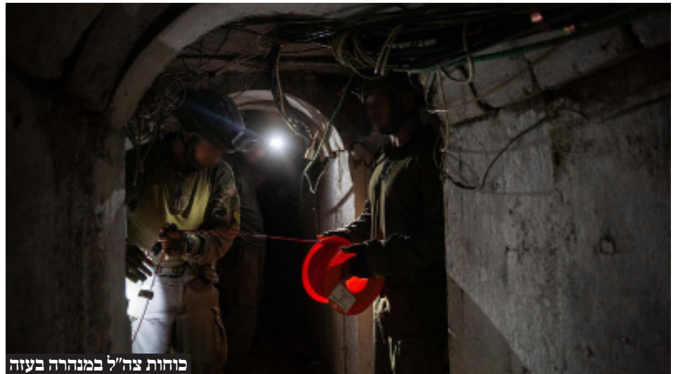
כוחות צה"ל במנהרה בעזה

הברית העליונה בין המדינה לאזרחיה היא לשמור על ביטחונם. עלינו מוטלת המשימה הקדושה, האמיצה והדחופה, להחזיר אותם הביתה".