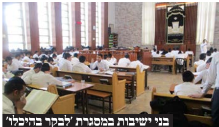
בני ישיבות במסגרת 'לבקר בהיכלו'

ה'יוץ בין הזמנים' הענק, שהתקיים במרכז הקונגרסים בבנייני האומה בהשתתפות גדולי הזמר נפתלי קמפה ובנצי שטיין. אלפי בני ישיבות גדשו את האולם, כאשר גדולי התורה כיבדו את האירוע בנוכחותם. במשך שעות ארוכות נשמעו דברי תורה מפי רבנים חשובים, לצד שירה וזמרה שהרקיעו שחקים. במהלך האירוע שולבו קטעי זיכרון מותאמים לבני התורה בזיכרון הקהילות היהודיות שאבדו בשואה.