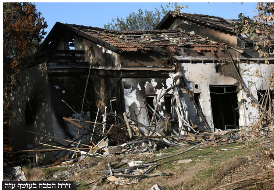
זירת הטבח בעוטף עזה