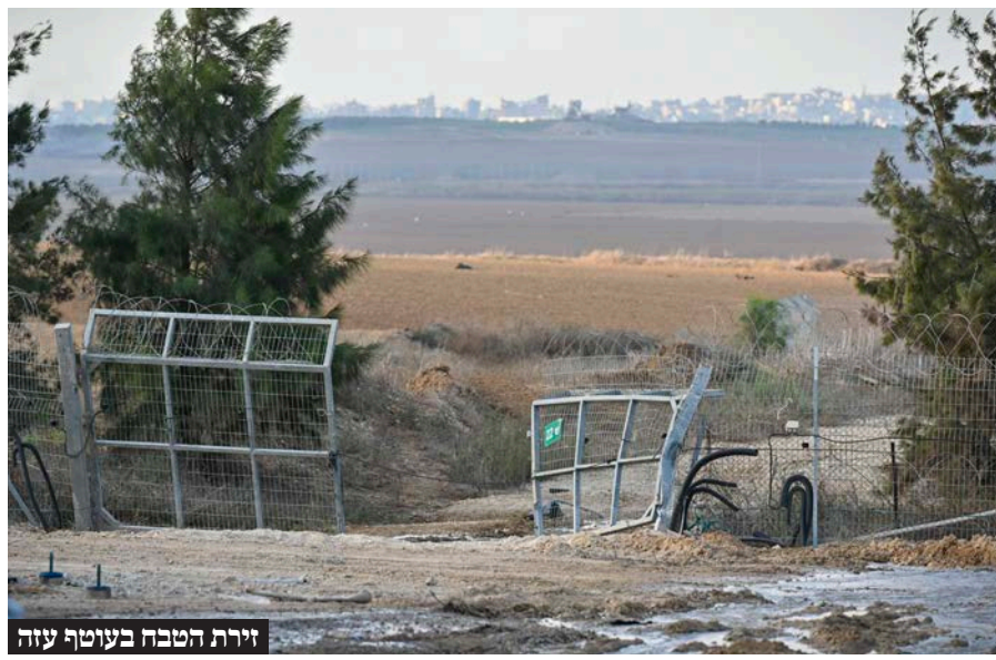
זירת הטבח בעוטף עזה

על מחיר הכניעה בעזה בהקשר לזירות האחרות. אני רוצה את הבן שלי בבית עם כל החטופים, אך העסקה היחידה שתתחשב בדור שלנו ובדורות הבאים צריכה לעסוק אך ורק במחיר שחמאס ישלם, ולא במה אנחנו ניתן, כי אנחנו שילמנו מספיק.