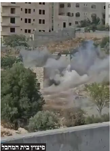
פיצוץ בית המחבל