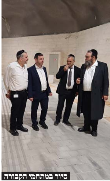
סיור במתחמי הקבורה