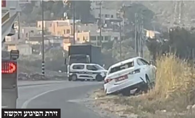
זירת הפיגוע הקשה

הטרור ביהודה ושומרון הולך ומתגבר: שלושה שוטרים - אישה ושני גברים - נרצחו בפיגוע ירי לעבר רכב שבו נסעו בכביש 35, סמוך למחסום תרקומיא שמצפון לחברון. האש ככל הנראה נפתחה מרכב חולף, ולאחר מכן המחבלים נטשו אותו ונמלטו. הפיגוע הקשה התרחש אחרי שורת ניסיונות לבצע פיגועים קשים באמצעות מכוניות תופת, שנמנעו ברגע האחרון בניסים גדולים ובחסדי שמים.