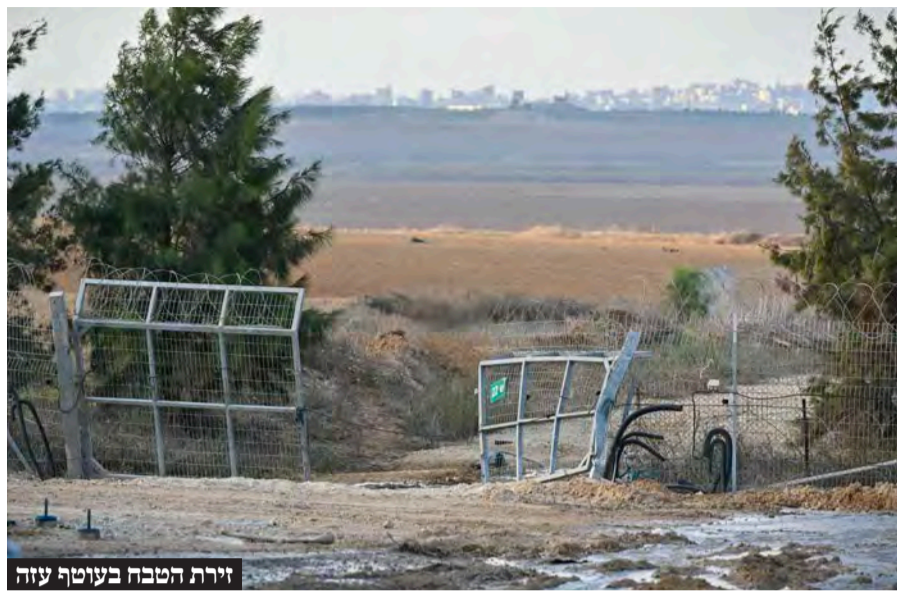
זירת הטבח בעוטף עזה

על מחיר הכניעה בעזה בהקשר לזירות האחרות. אני רוצה את הבן שלי בבית עם כל החטופים, אך העסקה היחידה שתתחשב בדור שלנו ובדורות הבאים צריכה לעסוק אך ורק במחיר שחמאס ישלם, ולא במה אנחנו ניתן, כי אנחנו שילמנו מספיק.