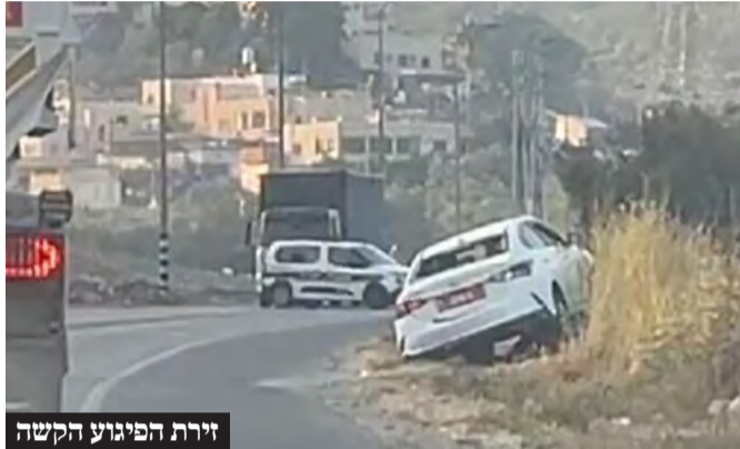
זירת הפיגוע הקשה

הטרור ביהודה ושומרון הולך ומתגבר: שלושה שוטרים - אישה ושני גברים - נרצחו בפיגוע ירי לעבר רכב שבו נסעו בכביש 35, סמוך למחסום תרקומיא שמצפון לחברון. האש ככל הנראה נפתחה מרכב חולף, ולאחר מכן המחבלים נטשו אותו ונמלטו. הפיגוע הקשה התרחש אחרי שורת ניסיונות לבצע פיגועים קשים באמצעות מכוניות תופת, שנמנעו ברגע האחרון בניסים גדולים ובחסדי שמים.