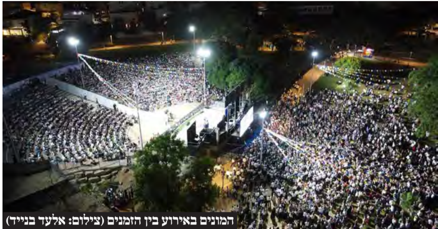
המונים באירוע בין הזמנים

ראש העיר יהודה בוטבול: "בעזרת ה', מעתה כל המופעים וההצגות יגיעו עד אליכם, ולא תצטרכו לצאת מחוץ לעיר"