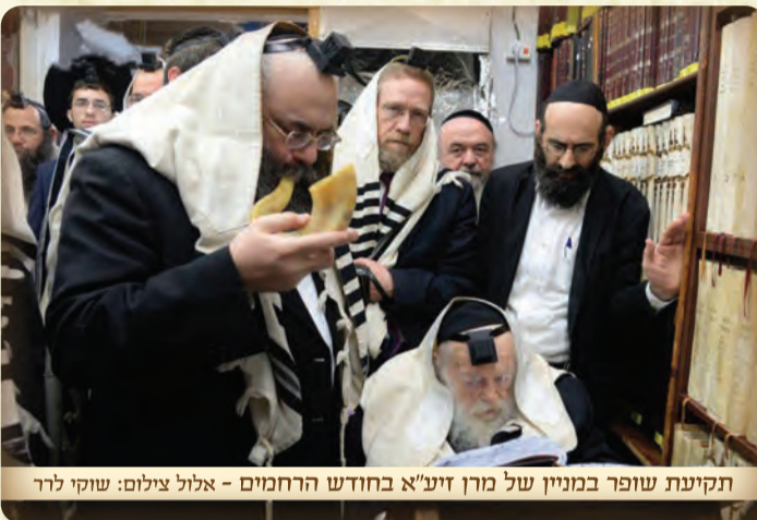
תקיעת שופר במניין של מרן זיע"א בחודש הרחמים - אלול