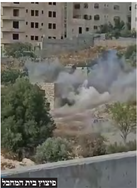
פיצוץ בית המחבל