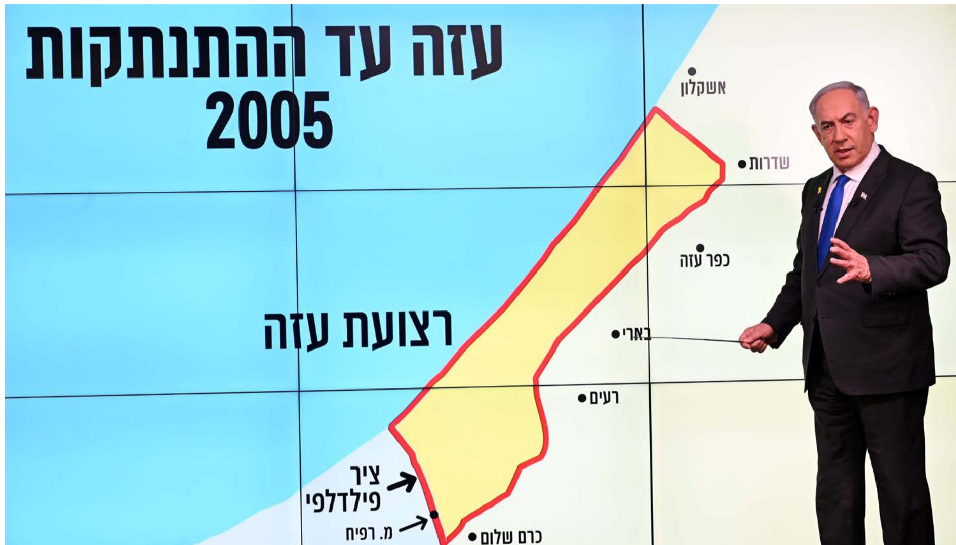
ההופעה הטובה ביותר. נתניהו במסיבת העיתונאים

נתניהו, כך נדמה, רק חיכה למי שירים לו להנחתה. בתשובה ערוכה וכמעט בוודאות מוכנה מראש, הוא הבהיר כי מבחינתו הוא יכול לעבוד עם שר הביטחון "כל עוד קיימים בינינו יחסי אמון", אבל מיהר להוסיף באותה נשימה שאותם יחסי אמון מדוברים, דורשים מכל חבר בקבינט לקבל את החלטות הקבינט ולא לפעול נגדן, וכי "כעת הדבר נבחן". במילים אחרות, גלנט הוזהר שלא לשחק באש ולבחוש שוב בקלחת העסקה, ולא לנסות להפעיל לחץ תקשורתי על ראש הממשלה, אם איננו חפץ לחתום אבטלה.