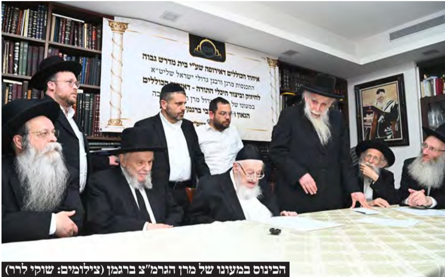
הכינוס במעונו של מרן הגרמ"צ ברגמן

מעמד מיוחד התקיים במעונו של רבינו מרן ראש הישיבה הגרמ"צ ברגמן בהשתתפות מרנן ורבנן גדולי ישראל וראשי הישיבות לחיזוק וביצור "איגוד הכוללים דאירופה" שע"י ישיבת בית מדרש גבוה - לייקווד