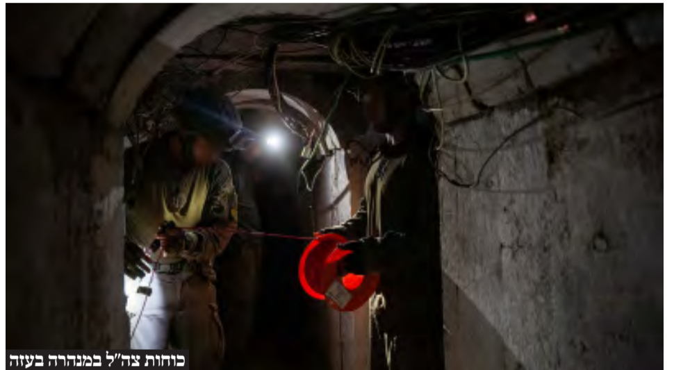
כוחות צה"ל במנהרה בעזה