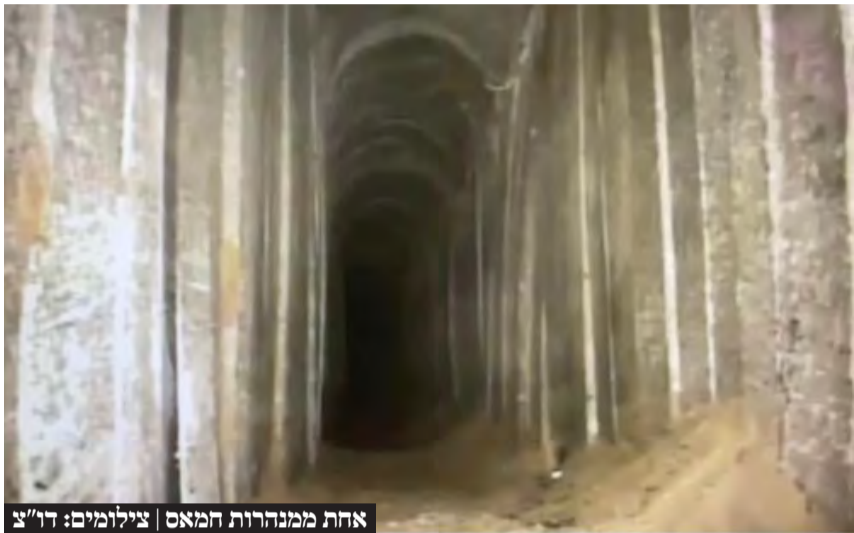
אחת ממנהרות חמאס

כוחות צה"ל איתרו את גופות ששת החטופים שנרצחו באכזריות איומה במנהרה ברפיח שנמצאת במרחק של קילומטר מזו שבה נמצא החטוף פרחאן קאדי שחולץ. נתניהו דרש בקבינט ממערכת הביטחון להביא המלצות לגביית מחיר כבד מחמאס בתוך 24-48 שעות