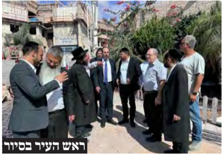
ראש העיר בסיור ואנחנו מאחלים לכל התלמידים והתלמידות בעיר ולצוותי המוסדות - שנת לימודים פוריה מראשיתה ועד סופה."