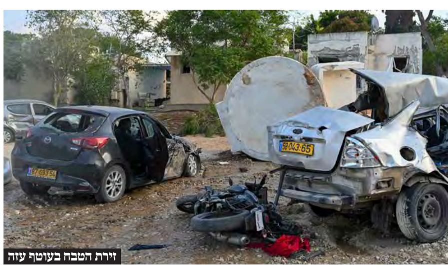
זירת הטבח בעוטף עזה

הוא מוסיף כי "אנחנו מדברים על לחץ צבאי כוללני שאמור להיות מופעל על חמאס. אני בכלל לא מדבר רק על רצועת עזה, אני מדבר על כך שאם מרכז הארץ מאוים - אם תל אביב מאוימת - אז לא רק נהרוס את המשגרים, אלא אנחנו נפגע בבירות. אם יוצא מחבל ורוצח מישוהו ברחבי הארץ, אז לא רק נהרוס לו את הבית, אלא נגרש את כל משפחתו. כשהם יראו ששינינו כיוון אז גם הם יבינו שאנחנו לא נוותר."