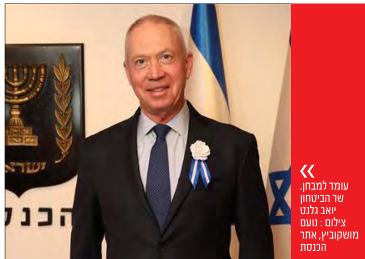
« עומד למבחן. שר הביטחון יואב גלנט

« הופעתו של נתניהו חוללה פלאים. ראש הממשלה הרס תחילה את התזה לפיה הוצע על ידי חמאס בשלב כלשהו לשחרר את כל החטופים, וחשף כי גם בשלב הנוכחי ואחרי הרבה מאוד מיקוח, מדובר על החזרתם של פחות מרבע (!) מהחטופים שנותרו. ממילא, מובנת גם התעקשותה של ישראל לאפשר לה לחזור מיידית בתום ההפוגה לחימה, ולא להזניח את שאר עשרות החטופים שלא ישוחררו ולהשאיר אותם במצבו של רון ארד