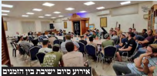
אירוע סיום ישיבת בין הזמנים

ישיבות בין הזמנים, רחצה בבריכות, מופעי סטנדאפ, לימוד ליל שישי הפנינג קיץ ועוד