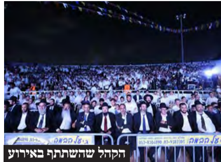
הקהל שהשתתף באירוע

הגר"ד יוסף: "לימוד התורה הוא הנשק החזק ביותר שלנו, והוא יביא לישועת ישראל"