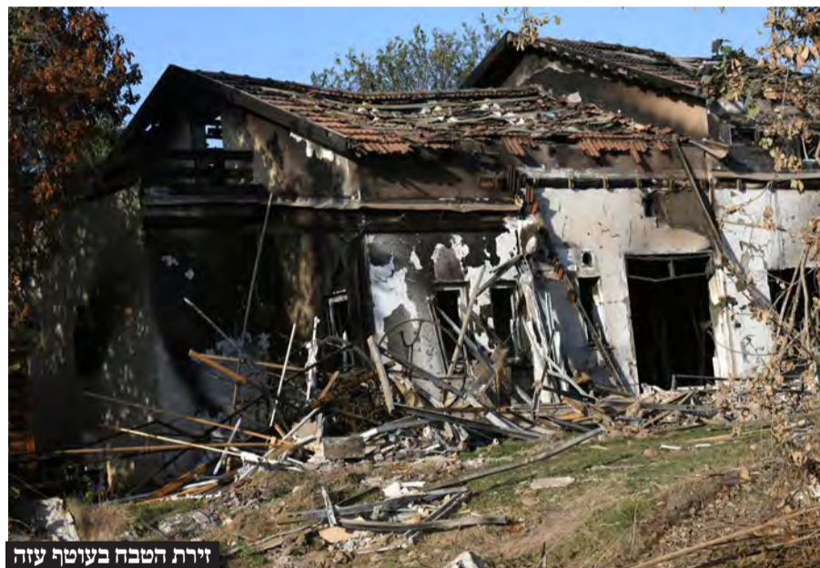
זירת הטבח בעוטף עזה