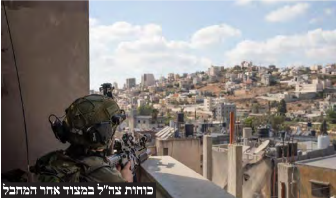
כוחות צה"ל במצוד אחר המחבל

מנחם הירשמן