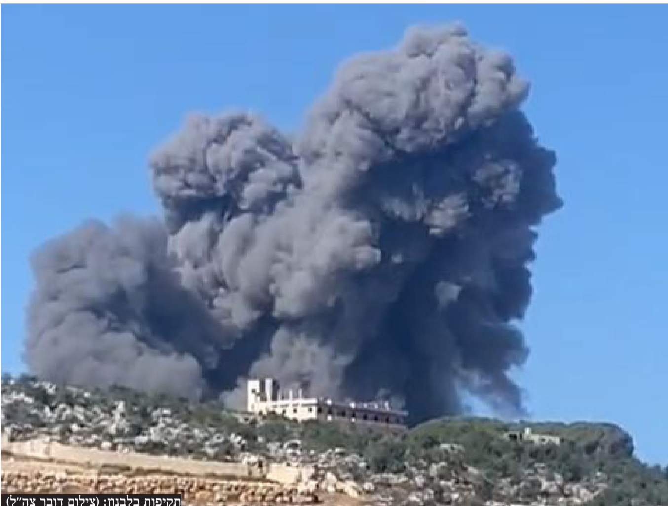
תקיפות בלבנון