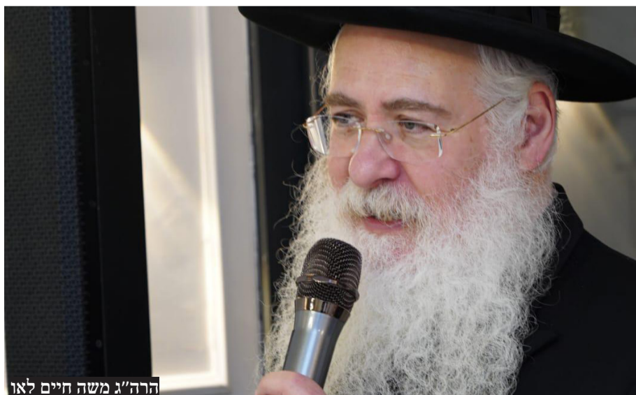
הרה"ג משה חיים לאו