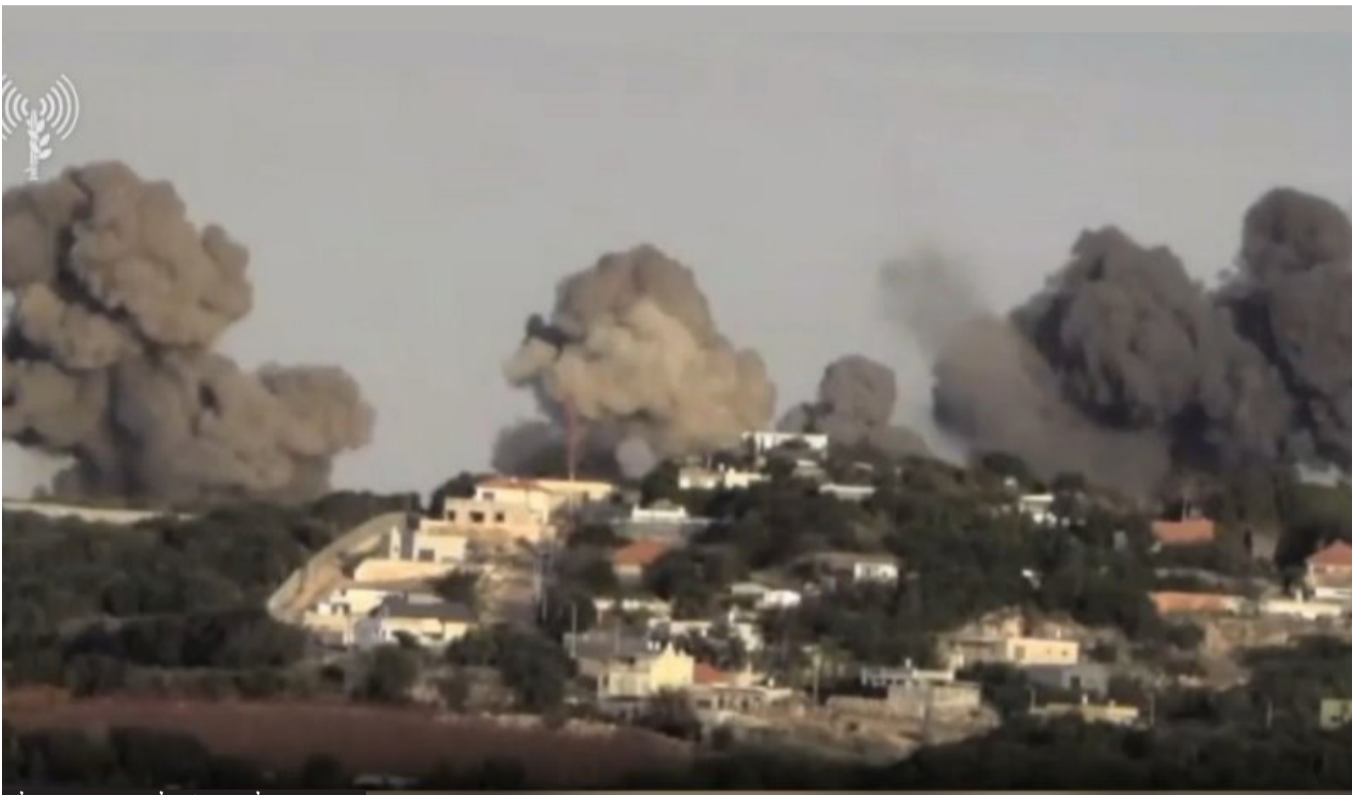
תקיפות בלבנון

בישראל נערכים לימי מלחמה קשים אחרי חיסול צמרת ארגון הטרור חיזבאללה והפגיעה המשמעותית במצבור הטילים של ארגון הטרור בלבנון • הממשלה אישרה: מצב מיוחד בעורף בכל ישראל למשך שבוע • ראש הממשלה בנימין נתניהו: "אנחנו עומדים בפני ימים מורכבים"