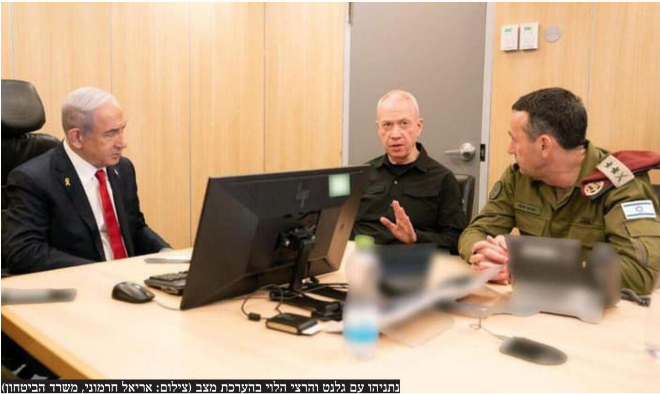
נתניהו עם גלנט והרצי הלוי בהערכת מצב