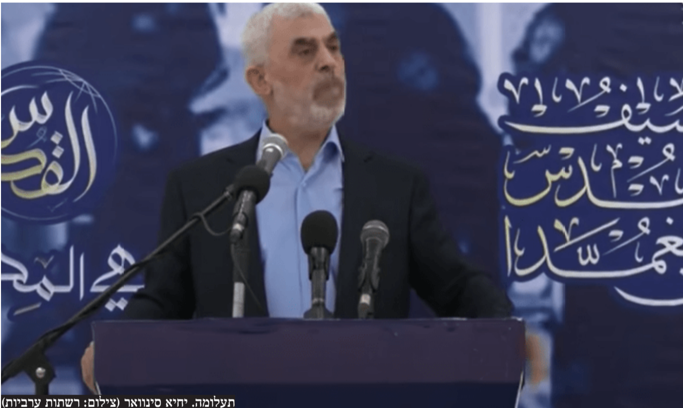
תעלומה. יחיא סינוואר

בישראל בודקים אם מנהיג חמאס נהרג באחת מהתקפות חיל האוויר ברצועה • מחלוקת בין אמ"ן לשב"כ סביב מצבו • בצל חילוקי הדעות באשר לגורלו של מנהיג חמאס, כוחות צה"ל הביאו לישראל גופות מהרצועה כדי לבדוק אם מדובר בסינוואר • לאחר בדיקה שללו בצה"ל כי מדובר בגופתו של סינוואר אך השאלות סביב מצבו הולכות ומתגברות