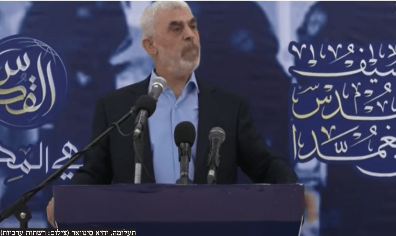
תעלומה. יחיא סינוואר

בישראל בודקים אם מנהיג חמאס נהרג באחת מהתקפות חיל האוויר ברצועה • מחלוקת בין אמ"ן לשב"כ סביב מצבו • בצל חילוקי הדעות באשר לגורלו של מנהיג חמאס, כוחות צה"ל הביאו לישראל גופות מהרצועה כדי לבדוק אם מדובר בסינוואר • לאחר בדיקה שללו בצה"ל כי מדובר בגופתו של סינוואר אך השאלות סביב מצבו הולכות ומתגברות