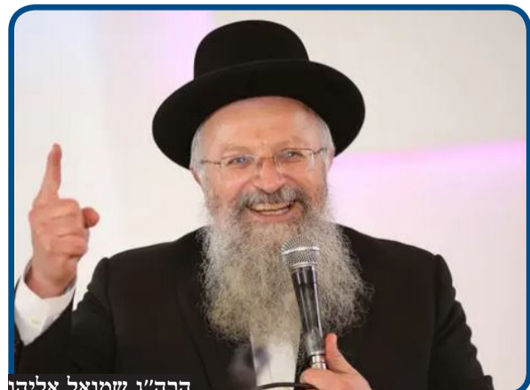
הרה"ג שמואל אליהו