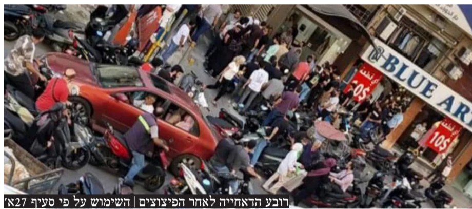
רובע הדאחייה לאחר הפיצוצים | השימוש על פי סעיף 27א'

במבצע שכמותו טרם נראה, בבת אחת התפוצצו מאות מכשירי קשר, ביפרים של קצינים בחיזבאללה ופצעו כ-3,000 פעילי חיזבאללה • בעולם הערבי מדווחים: מדובר בתקיפת סייבר ישראלית, שכוונה למכשירי הקשר החדשים של ארגון הטרור • דיווח סעודי: בין הנפגעים - מפקדים בכירים בחיזבאללה ושגריר איראן בלבנון ושומרי ראשו | עמ' 15