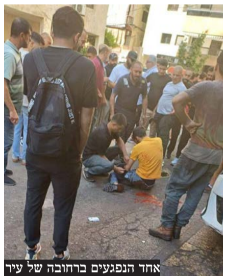
אחד הנפגעים ברחובה של עיר

ב"וול סטריט ג'ורנל" דווח מפי גורם רשמי בחיזבאללה, כי למאות מפעילי ארגון הטרור היו מכשירים כאלה, וכי הועלתה השערה ש"תוכנות זדוניות" גרמו למכשירים להתחמם ולהתפוצץ. אותו גורם בחיזבאללה אמר שכמה מאנשי הארגון "הרגישו שמכשירי הקשר התחממו", ונפטרו מהם