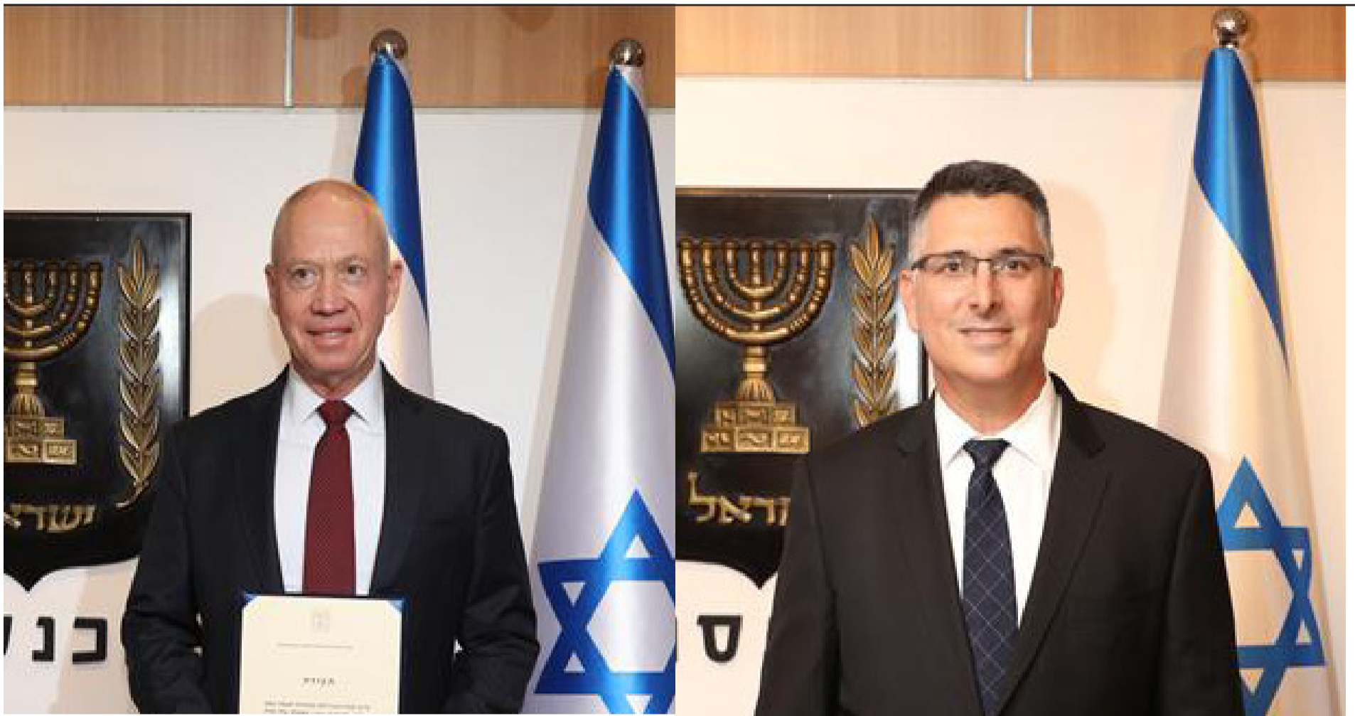
שר הביטחון הנכנס והשר היוצא? סער וגולט