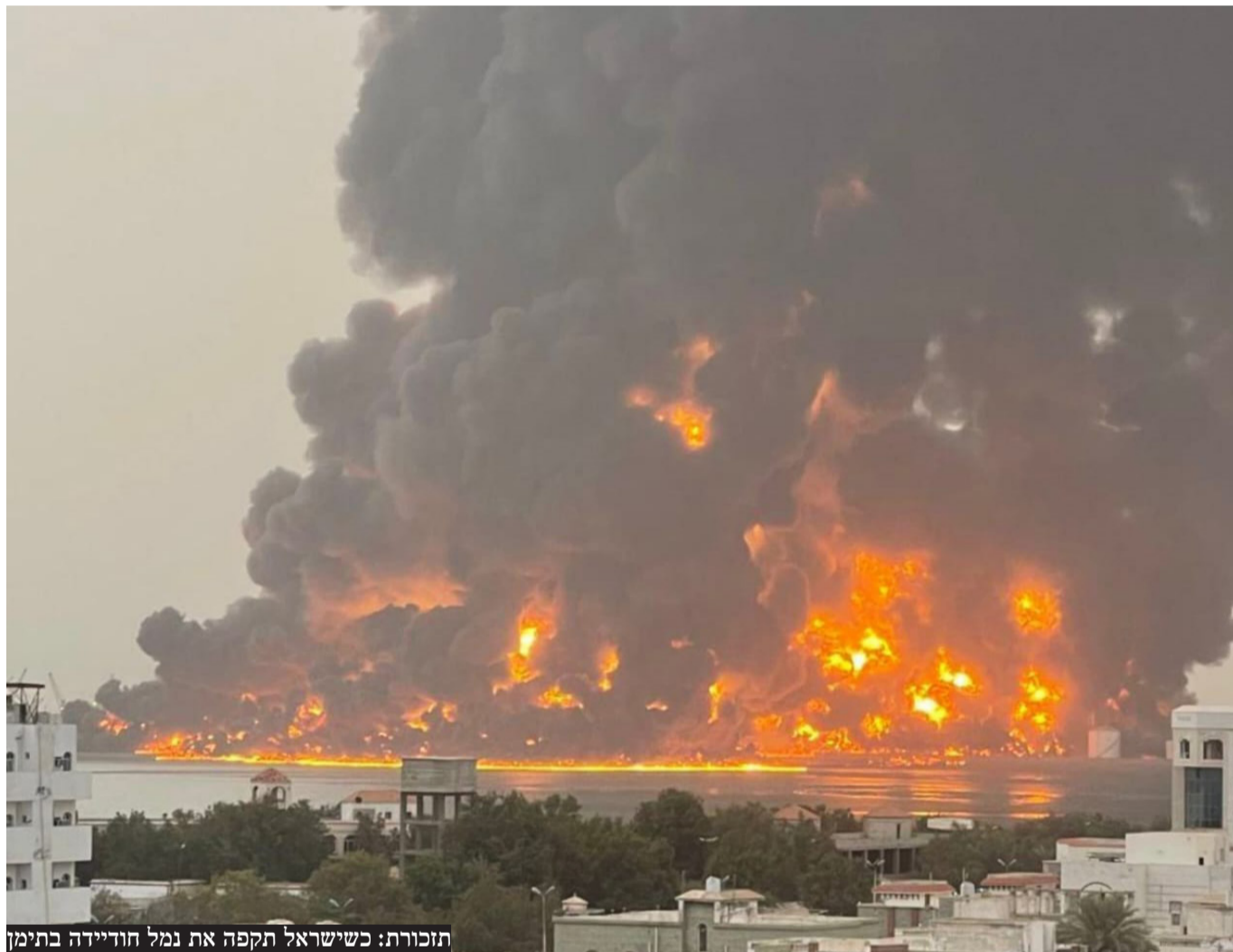
תזכורת: כשישראל תקפה את נמל חודיידה בתימן

בצה"ל מנסים לתחקר מדוע המיירט לא הצליח להשמיד את הטיל הבליסטי ששיגור החות'ים בשעת בוקר מוקדמת • נס גדול: הטיל הבליסטי אמנם לא יורט אך נפל בשטח פתוח ולא גרם לנפגעים בגוף ובנפש • ראש הממשלה בנימין נתניהו: "כל מי שתוקף אותנו לא יחמוק מנחת זרוענו"