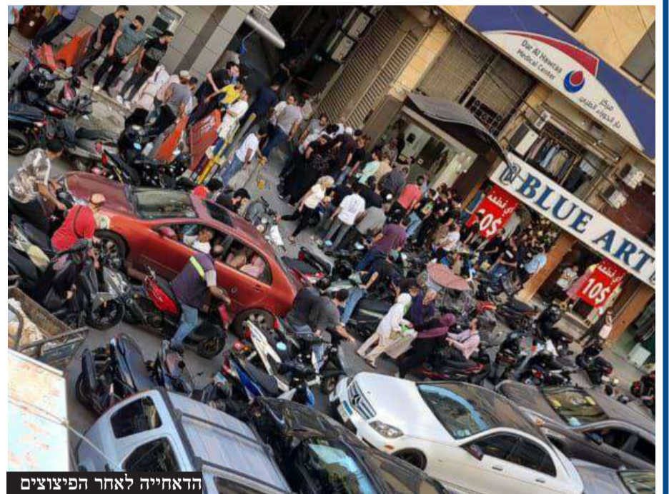
הדאחיה לאחר הפיצוצים

הרשת, כך נכתב, יכולה לכסות אזורים נרחבים, אם יש אנטנות. הוא מסר כי מדובר בטכנולוגיה ישנה משנות ה-90. מדינות שונות וארגונים משתמשים במכשיר, השונה מ"זוקי-טוקי", מאחר שהוא משמש להעברת