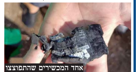
אחד המכשירים שהתפוצצו

בחיזבאללה הוסיפו: "אנו מבקשים וקוראים לאנשינו הנכבדים להיזהר מהשמועות ומהמידע השקרי והמטעה