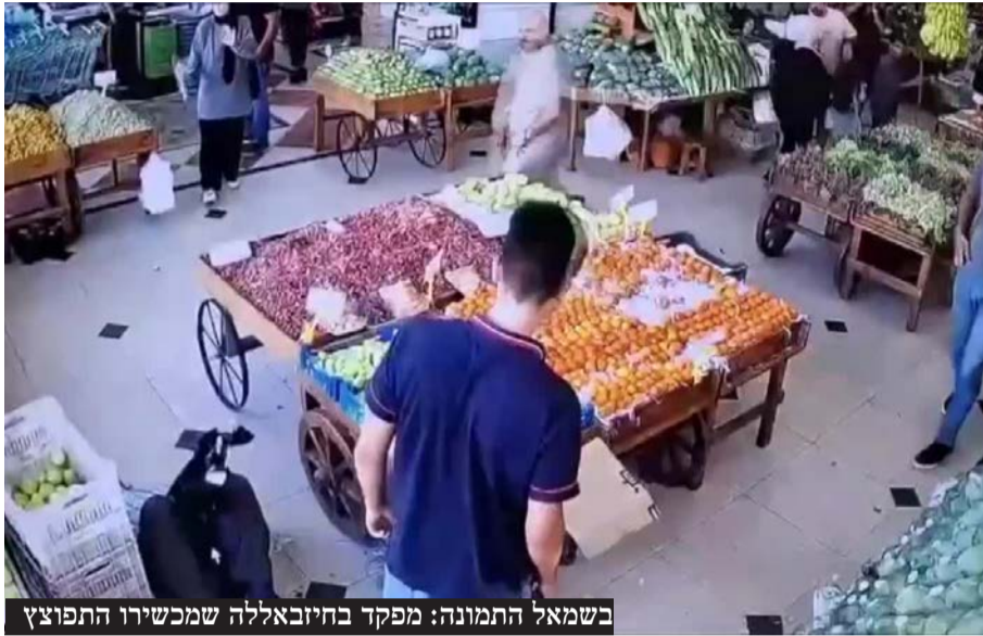
בשמאל התמונה: מפקד בחיזבאללה שמכשירו התפוצץ

מקור בארגון הטרור אמר לעיתון אל-ערבי אל-ג'דיד הקטארי: "לא ניתן לקבוע כרגע את המספר המדויק של המוקדים