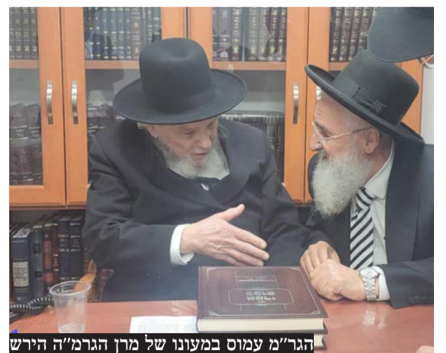
הגר"מ עמוס במעונו של מרן הגרמ"ה הירש