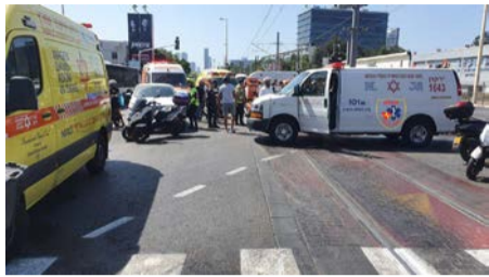
הקשות מהן סבל רוכב האופנוע שפגע בו נפצע קשה ופונה לבית חולים.

תאונה קטלנית התרחשה ברחוב אלברט איינשטיין: מותו של הולך הרגל נקבע בזירה לאחר פעולות החיאה