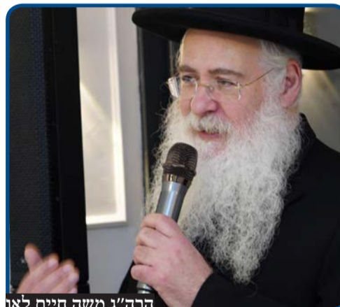
הרה"ג משה חיים לאו