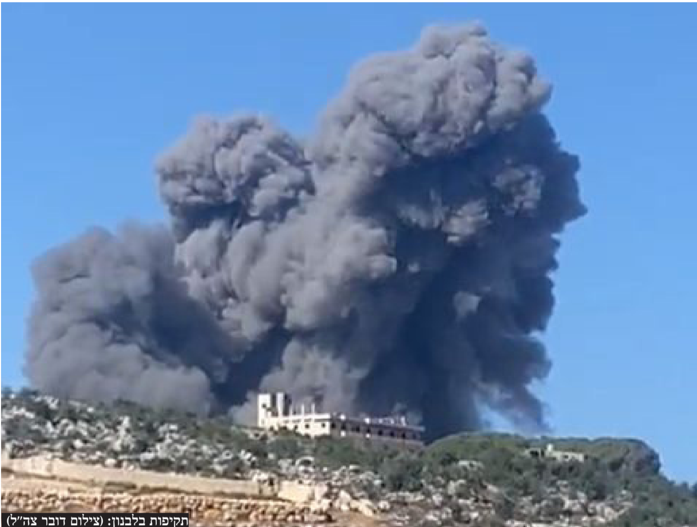
תקיפות בלבנון