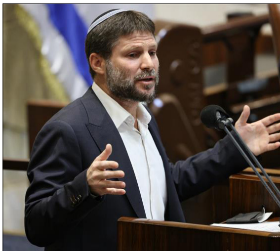
« יתיר את הרב הלוי? שר האוצר בצלאל סמוטריץ' אתר צילום: אתר הכנסת

סער גם טרח שלא להכחיש את האירוע, או במילים אחרות, הוא עשה הכל כדי לוודא שכולם יודעים ומבינים שהוא בדרך לקואליציה. תחילה היה זה באמצעות טקסט עוקצני וחד שכוון ישירות ליאיר לפיד, בתגובה לביקורת שהטיח בו יו"ר האופוזיציה ובטענות שהעלה על חוסר ניסיונו הביטחוני של יו"ר הימין הממלכתי. סער הזכיר ללפיד את הפערים ביניהם בכל הנוגע לניסיון ביטחוני וגם את העובדה שלפיד עצמו לא היסס לרגע להציע לסער את תיק הביטחון בתקופת הקמת ממשלת בנט-לפיד. בהמשך הודיע סער שהוא מוותר על תיק הביטחון מתוקף הנסיבות, ובמילים אחרות: הוא מודה בקיומו