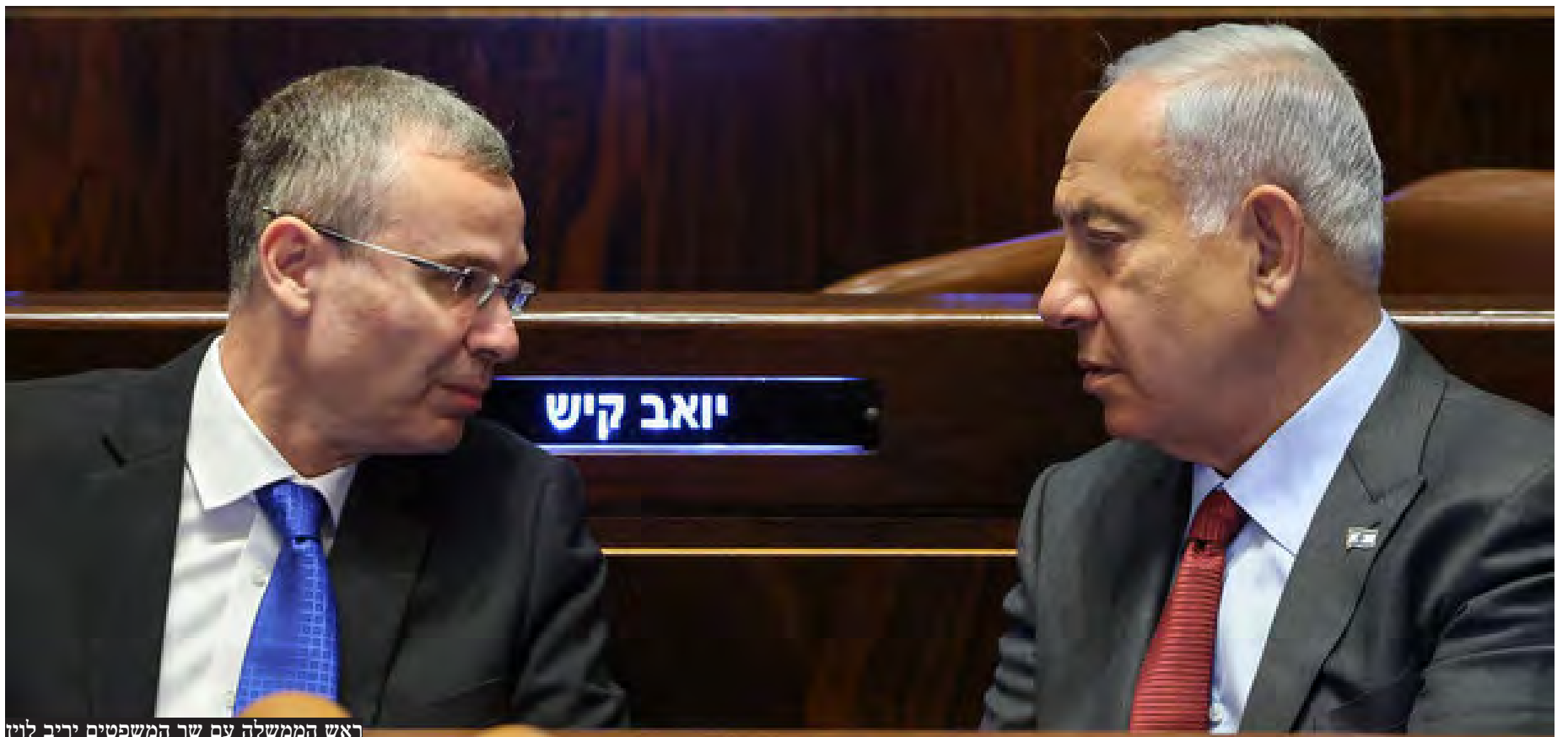
ראש הממשלה עם שר המשפטים יריב לוין

משבר חריף בין מערכת המשפט לשר המשפטים יריב לוין בעקבות החלטת בג"צ לחייב את השר להודיע בתוך 14 יום על בחירת מועד לכינוס הוועדה למינוי שופטים וקיום הצבעה על מינוי נשיא לבית המשפט העליון • סלע המחלוקת: שופטי העליון נחושים למנות את השופט יצחק עמית לתפקיד הנשיא