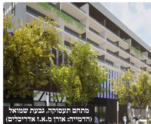
מתחם תעסוקה, גבעת שמואל