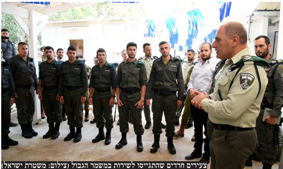
צעירים חרדים שהתגייסו לשירות במשמר הגבול

יו"ר יהדות התורה, השר יצחק גולדקנופף, הודיע לראש הממשלה בנימין נתניהו כי "בלי חוק הגיוס - לא יעבור תקציב לשנת 2025 בכנסת". במפלגות החרדיות מצפים שנתניהו יפעל מול הח"כים הסוררים בליכוד ובשאר המפלגות כדי שחוק הגיוס שנדון בימים האלה יעבור בכנסת