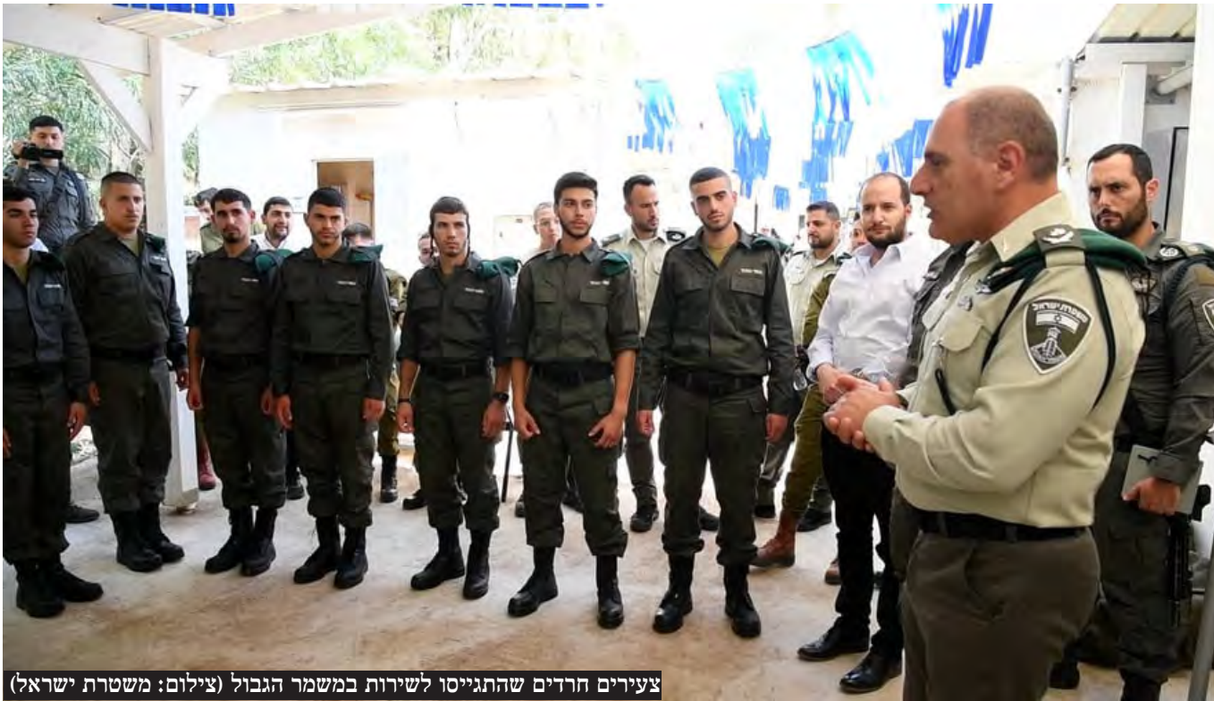
צעירים חרדים שהתגייסו לשירות במשמר הגבול

יו"ר יהדות התורה, השר יצחק גולדקנופף, הודיע לראש הממשלה בנימין נתניהו כי "בלי חוק הגיוס - לא יעבור תקציב לשנת 2025 בכנסת" • במפלגות החרדיות מצפים שנתניהו יפעל מול הח"כים הסוררים בליכוד ובשאר המפלגות כדי שחוק הגיוס שנדון בימים האלה יעבור בכנסת