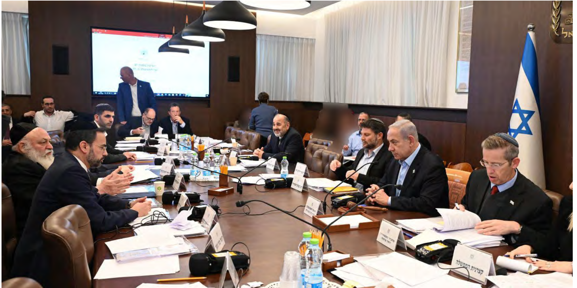
השבוע שלו. שר האוצר בצלאל סמוטריץ' בישיבת הממשלה

מתקפל ולא מתרגש מאיומים והשבתות. ארו עצמו התגלה כקמפיין הטוב ביותר של השר כשהסביר את ההתקפלות בכך שהשבתה לא הניבה תוצאה והתברר שהיא מזיקה אך ורק למורים עצמם, משום שהשר הבהיר שלא ישולמו משכורות עבור הימים בהם שבתו. אבל מעבר לשני הניצחונות הללו, זה היה השבוע הטוב ביותר של סמוטריץ' מאז הקמת הממשלה, ואולי אחד הטובים בקריירה הפוליטית שלו בכלל. בניגוד לכל נבואות הזעם על התקציב הבלתי אפשרי שיידרש לשנת 2025, הציג שר האוצר תקציב מאוזן ושמרני,