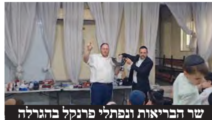
שר הבריאות ונפתלי פרנקל בהגולה

שר הבריאות אוריאל בוסו, ממתפללי בית הכנסת, כובד בהוצאת פתקי ההגולה החודשית