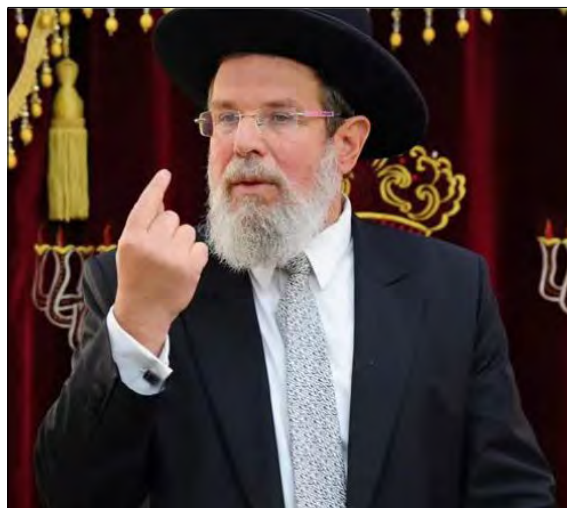
« הפתעה מתוצרת דגל הגאון רבי קלמן בר

« ההיבט השישי והחשוב ביותר, הוא עמידותה של מדינת ישראל וחוסנם הפנימי של אזרחיה. אלו שחשבו שישראל היא מדינה על סף פירוק, מדינה של קורי עכביש, נוכחו לגלות עם שידוע להתאחד ברגעים קשים, שידוע לגבור על המחלוקות הפנימיות ולהניח אותם לרגע בצד, כדי לעמוד על נפשו במלחמת הקיום שנכפתה עליו. ישראל שוב מצטיירת כמו המעצמה שהיא, ולא לחינם בעיתוני לבנון כבר תיארו השבוע את התנהלות ישראל במונחים של 'בעל הבית השתגע'. רק כך מחזירים את ההרתעה הנחוצה כל כך