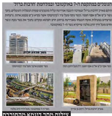
צילום מסך דוגמא מהחברת