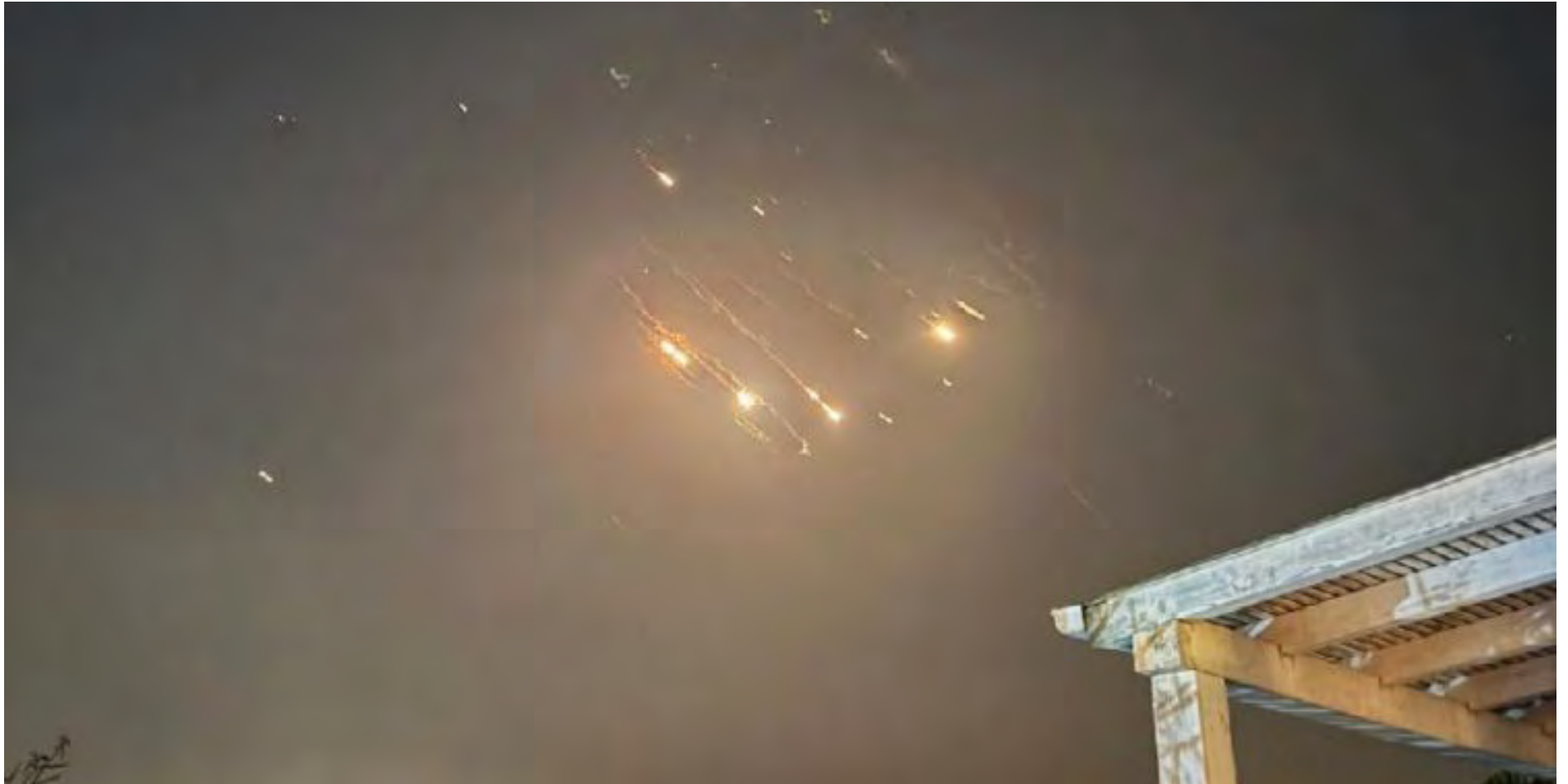
האיראנים יוצאים למלחמה ישירה. ליל היירוטים (שימוש על פי סטיף א27)

סופו של דבר, אחרי שבוע של דיונים, הנפיקה היועמ"שית את עמדתה המנומקת בשעות הערב של יום שני, בדמדומי עצרות הזיכרון של השביעי לעשירי, ובו הכריעה באופן נחרץ "לא ניתן להכשיר את הפתק של המועמד לרב ראשי אשכנזי שנמצא במעטפה של הבחירות לרב הראשי הספרדי ובקלפי של בחירות אלה, ולייחס אותו למעטפה הריקה שנמצאה בקלפי של הרב הראשי האשכנזי". וכמובן, קובעת היועמ"שית כי יש "להיערך בהקדם לסבב בחירות נוסף לרב האשכנזי".