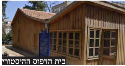
בית הדפוס ההיסטורי

הבנייה בעשרות מבנים המיועדים לשימור בפתח תקווה תוקפא. הוועדה המקומית תדון בישיבתה השבוע בפרסום הודעה לפי סעיף 78 על מבנים הנכללים ברשימת השימור, עד להפקדתה של תכנית השימור העירונית.