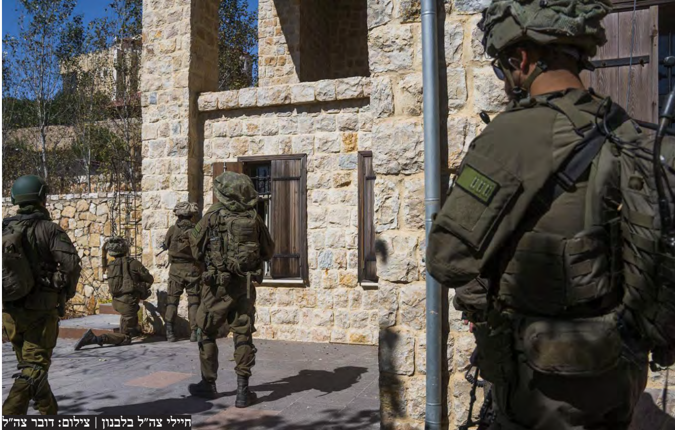
חיילי צה"ל בלבנון

בצבא מתחילים להסיק מסקנות ראשונות לגבי ההיערכות של חיזבאללה והתוכנית של ארגון הטרור לפלישה לשטח הגליל. הלוחמים נתקלו במתחמי השהייה של חיזבאללה ומצאו שם תשתיות יותר נרחבות ממה שהיה ידוע עליו בצה"ל, ואף אמצעי לחימה ותחמושת רבים יותר ממה שהעריכו לפני הכניסה. ישראל כרגע מבצעת ארבע פעולות שונות שמתרחשות במקביל כדי להחליש את חיזבאללה ולאפשר לתושבי הצפון המפונים לחזור לבתיהם. הפעולה הראשונה היא עצם התמרון הקרקעי, שכאמור התרחב גם לגזרה המערבית. הפעילות הקרקעית נועדה לפגוע בכפרים הלבנוניים במרחק של קילומטרים ספורים מהגבול ולהסיר מהם את האיום. יש לתמרון גם היבט פסיכולוגי, שכן הוא גם נועד להקנות תחושת ביטחון בקרב המפונים לקראת חזרה אפשרית שלהם הביתה. הפעולה השנייה היא גריעת יכולות מצד חיזבאללה - פגיעה במשגרים, במפעלי ייצור ולמעשה בכל תשתית של הארגון. השלישית היא רצף החיסולים, שפגע קשות ביכולות של הנהגת ארגון הטרור לפקד ולשלוט על המחבלים שבשטח. הרביעית היא עצם הטלת הסגר הצבאי על לבנון שמטרתו למנוע התחמשות מחודשת של חיזבאללה. לפי פרסומים זרים ישראל תוקפת שוב ושוב את מעבדי הגבול של לבנון עם סוריה, ופוגעת במשאיות ובכל ניסיון להעביר אמצעי לחימה. במסגרת אותו סגר, מבהירים גם למטוסים איראניים שלא להגיע ללבנון,