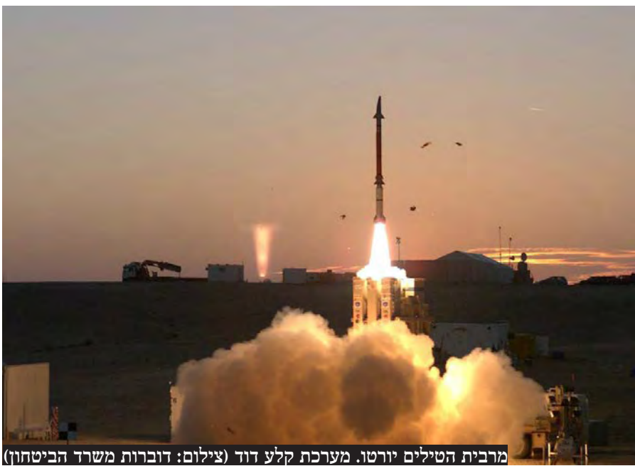
מרבית הטילים יורטו. מערכת קלע דוד

בישראל התקבלה ההחלטה לפעול נגד איראן אחרי שמשמרות המהפכה שיגרו מאות טילים בליסטיים לשטח המדינה • ניסים גדולים: ההרוג היחיד במתקפת הטילים הוא פלסטיני מעזה שברח ליריחו • אל"מ חנן שי ל'קו עיתונות': "הפיכתה של אירן לנכה כלכלית וצבאית צריכה להיות משימת צה"ל המיידית הראשית"