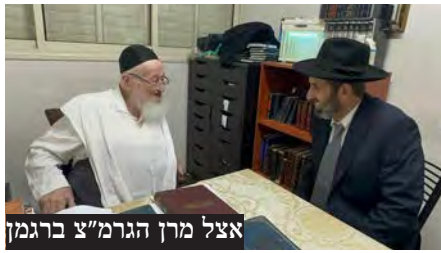
אצל מרן הגרמ"צ ברגמן