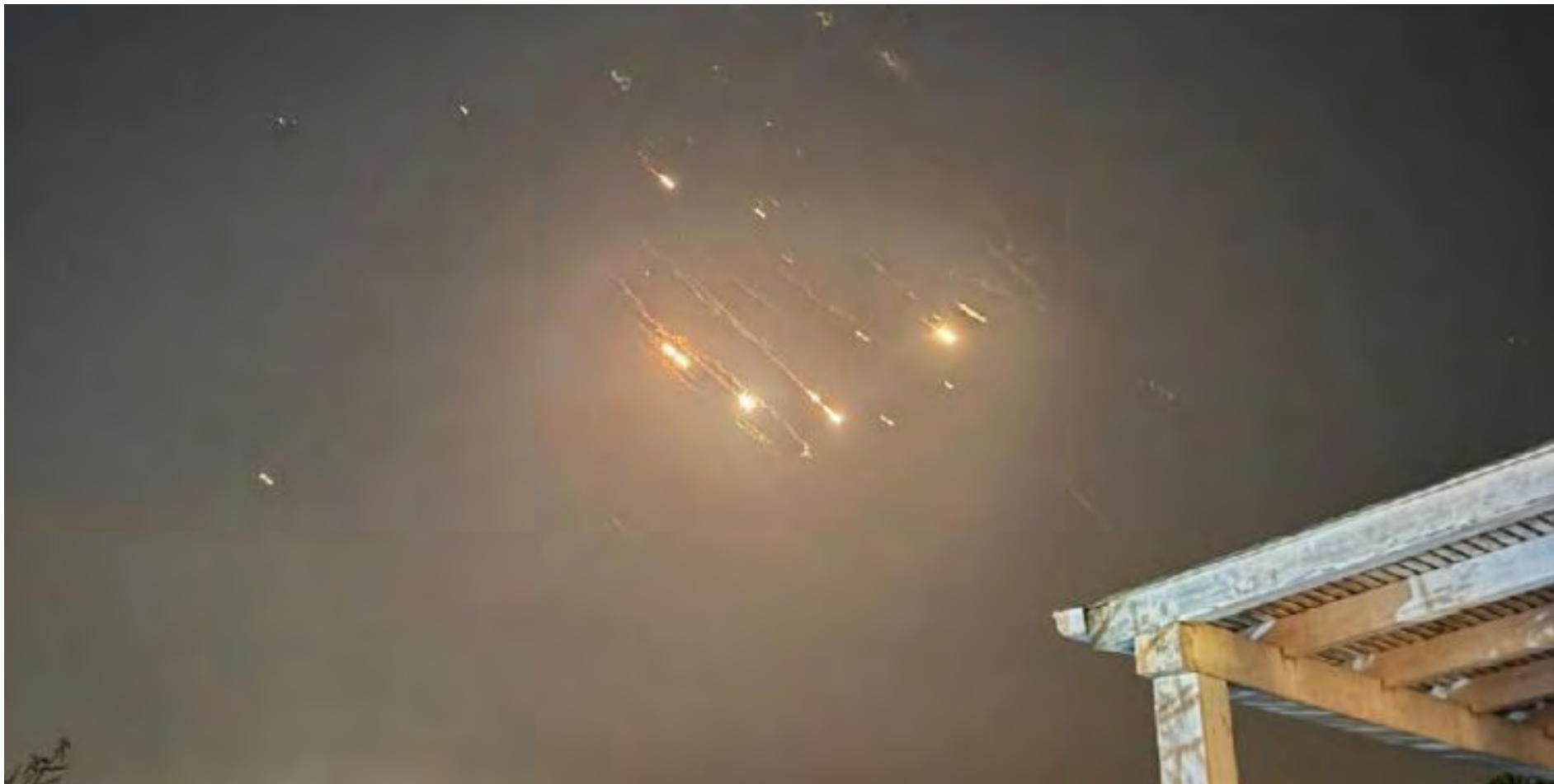
האיראנים יוצאים למלחמה ישירה. ליל היירוטים (שימוש על פי סטיף א27)

סופו של דבר, אחרי שבוע של דיונים, הנפיקה היועמ"שית את עמדתה המנומקת בשעות הערב של יום שני, בדמדומי עצרות הזיכרון של השביעי לעשירי, ובו הכריעה באופן נחרץ "לא ניתן להכשיר את הפתק של המועמד לרב ראשי אשכנזי שנמצא במעטפה של הבחירות לרב הראשי הספרדי ובקלפי של בחירות אלה, ולייחס אותו למעטפה הריקה שנמצאה בקלפי של הרב הראשי האשכנזי". וכמובן, קובעת היועמ"שית כי יש "להיערך בהקדם לסכב בחירות נוסף לרב האשכנזי".