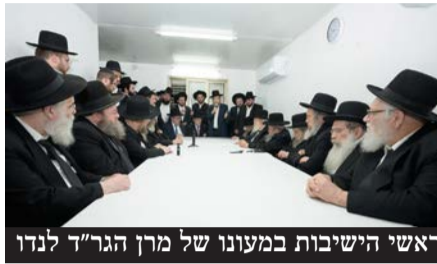
ראשי הישיבות במעונו של מין הגר"ד לנדו