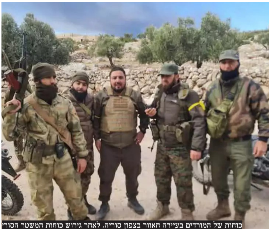
כוחות של המורדים בעיירה האזור בצפון סוריה, לאחר גירוש כוחות המשטר הסורי

"לכן, אנחנו שולחים את אותה יד של שלום לשכנינו הדרוזים. קודם כל להם, הם אחים של אחינו הדרוזים במדינת ישראל. ואנחנו שולחים גם יד של שלום לכורדים, לנוצרים ולמוסלמים, שרוצים לחיות בשלום עם ישראל. אנחנו נעקוב בשבע עיניים אחר ההתפתחויות. נעשה מה שצריך כדי להגן על גבולנו ולהגן על ביטחוננו".