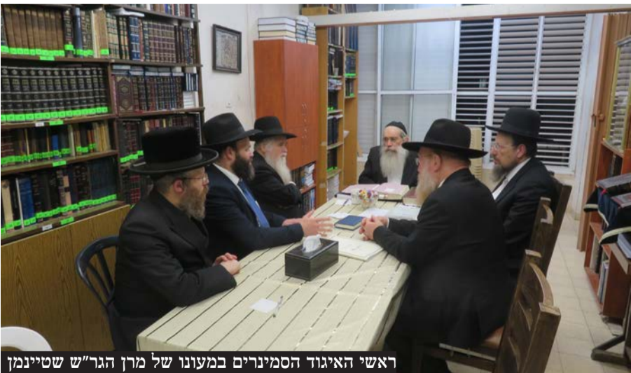
ראשי האיגוד הסמינרים במעונו של מין הגר"ש שטינמן

ראשי 'איגוד הסמינרים' בהתייעצות אצל מין ראש הישיבה הגאון הגדול רבי שרגא שטינמן שליט"א