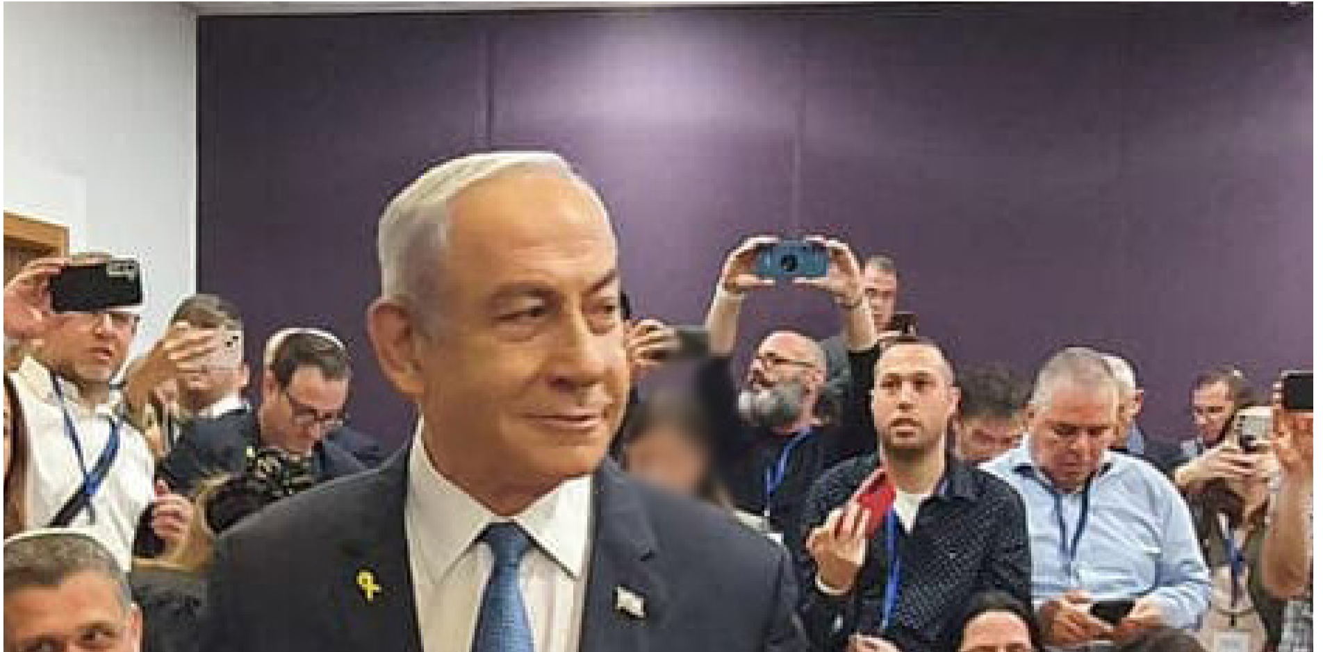
ההצגה הטובה בעיר. ראש הממשלה בפתח מסירת עדותו

תקף אותם על הפצת פייק ניוז סדרתית ולהטט כדרכו בין הנושאים.