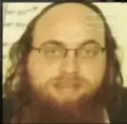
הרב נתן שפירא