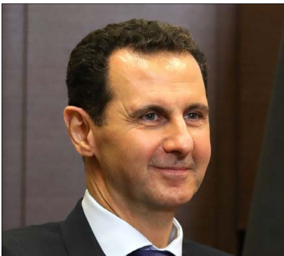
מקלט מדיני במוסקבה. הנושא הסורי המודח

מאז ומעולם היה העם הכורדי בן ברית נלהב של מדינת היהודים, כורדים עזרו להבריח יהודים מעיראק עוד בשנות החמישים והשישים של המאה הקודמת, וגם נהנו לאורך השנים - על פי השמועה - מאספקה של נשק ישראלי. אם תקום מדינה כורדית עצמאית בשטח הנשלט על ידיהם, כשליש משטחה המקורי של סוריה, היא תהיה מוצב קדמי של שיתוף פעולה עם ישראל נגד איראן. במקום להקים טבעת חנק סביב ישראל, ימצאו האיראנים את עצמם מוקפים במדינות בלתי ידידותיות בעליל