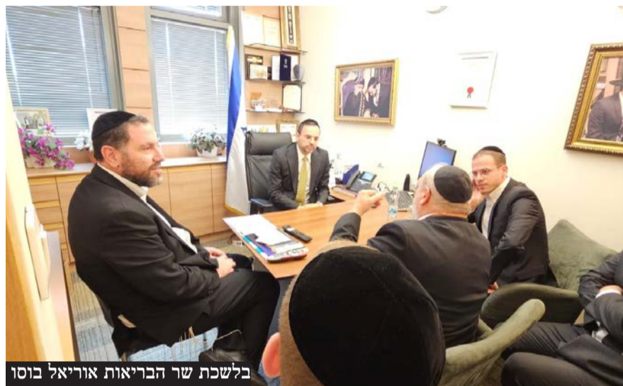
בלשכת שר הבריאות אוריאל בוסו

תכנית חדשה של מזור מציעה הכשרה ממוקדת למומחים בתחומים רפואיים ספציפיים, כדי להעניק מענה מקצועי ומדויק יותר למטופלים. הפגישה התקיימה בהשתתפות שר הבריאות אוריאל בוסו וח"כ אליהו ברוכי