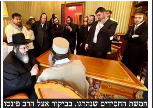
חמשת החסידים שנהרגו, בביקור אצל הרב פינטו