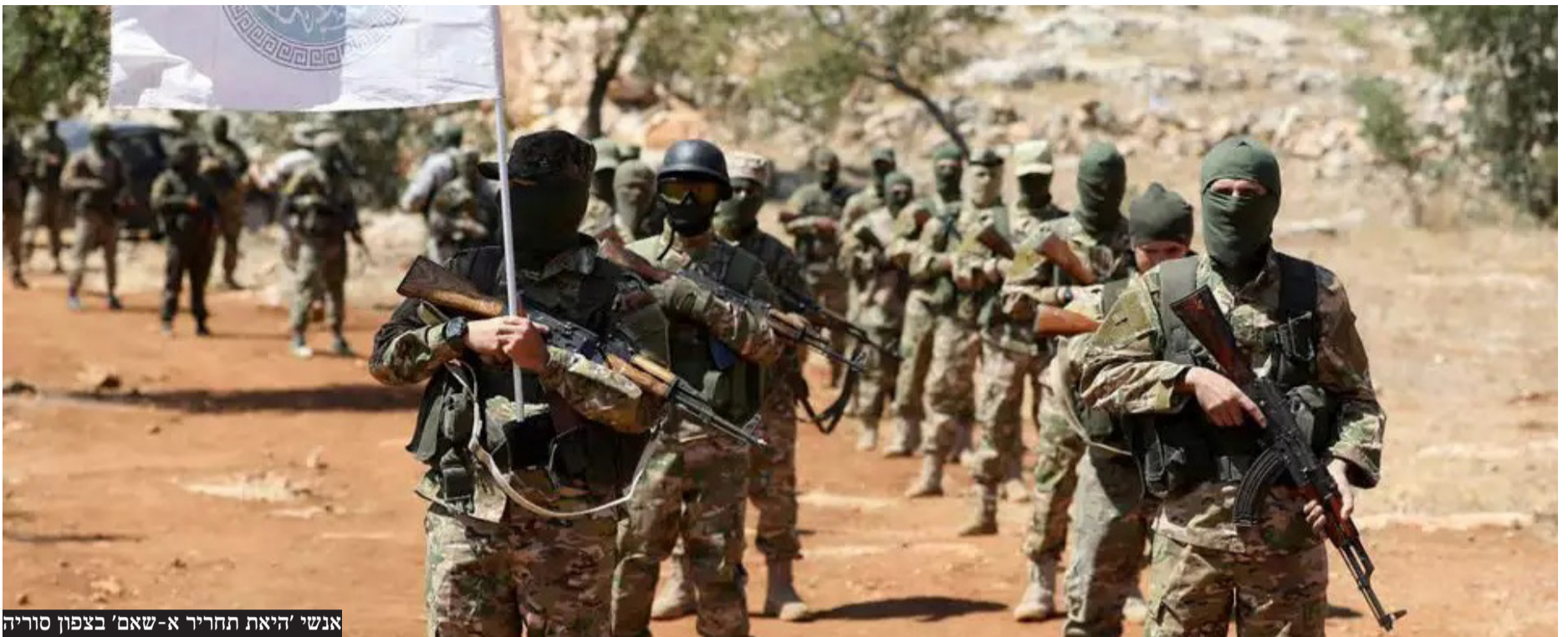
אנשי 'היאת תחריר א-שאם' בצפון סוריה