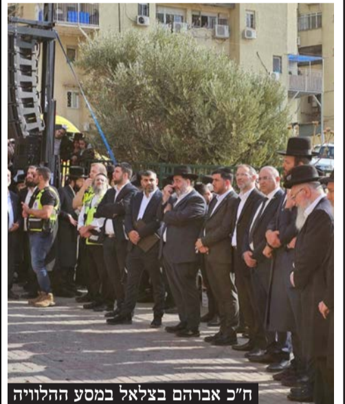
ח"כ אברהם בצלאל במסע ההלוויה