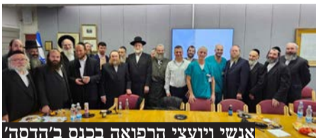
אנשי ויועצי הרפואה בכנס ב'הדסה'

על קידום החדשנות הרפואית לצד שמירה על קשר הדוק עם קהילה והאזון הקשובה והדלת הפתוחה לצרכים של כלל הקהילות בירושלים ובסביבתה.