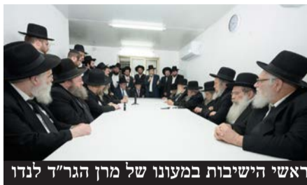
ראשי הישיבות במעונו של מין הגר"ד לנדו