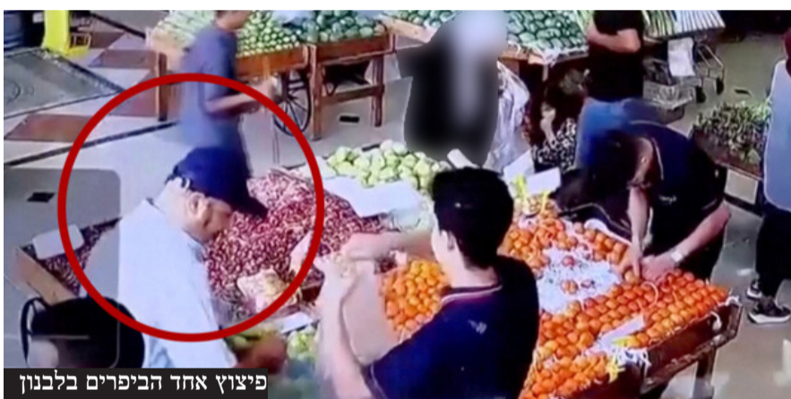
פיצוץ אחד הביפרים בלבנון

אחרי מיגור חיזבאללה שהחל ב'מבצע הביפרים', המוסד לשירותי ביון של מדינת ישראל חושף לעולם את המבצע ומסלולו - "כשהפעלנו את הביפרים, נסראללה היה בבנוקר - הוא ראה אותם מתמוטטים במו עיניו"