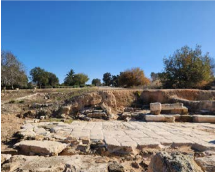
נקודת מציאת העששית