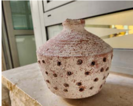
שרידים ארכיאולוגיים בולטים הגן לאומי ציפורי