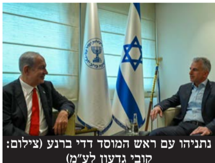
נתניהו עם ראש המוסד דדי ברנע