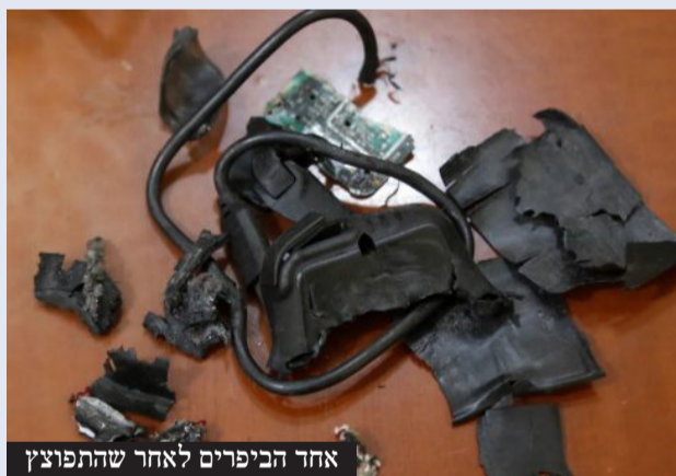
אחד הביפרים לאחר שהתפוצץ

אחרי מיגור חיזבאללה שהחל ב'מבצע הביפרים', המוסד לשירותי ביון של מדינת ישראל חושף לעולם את המבצע ומסלולו. "כשהפעלנו את הביפרים, נסראללה היה בבונקר - הוא ראה אותם מתמוטטים במו עיניו" | עמ' 12