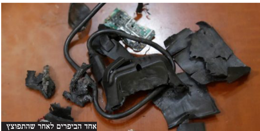
אחד הביפרים לאחר שהתפוצץ

"מי שהרגת, הרגת", הוא אמר. "אבל אלה שפצעת, ועכשיו צריך לקחת אותם לבית החולים ולטפל בהם ולהשקיע בזה כסף - אנשים בלי ידיים ועיניים הם הוכחה חיה בלבנון של 'אל תתעסקו איתנו'. זו הוכחה לעלינות שלנו בכל רחבי המזרח התיכון", אמר.