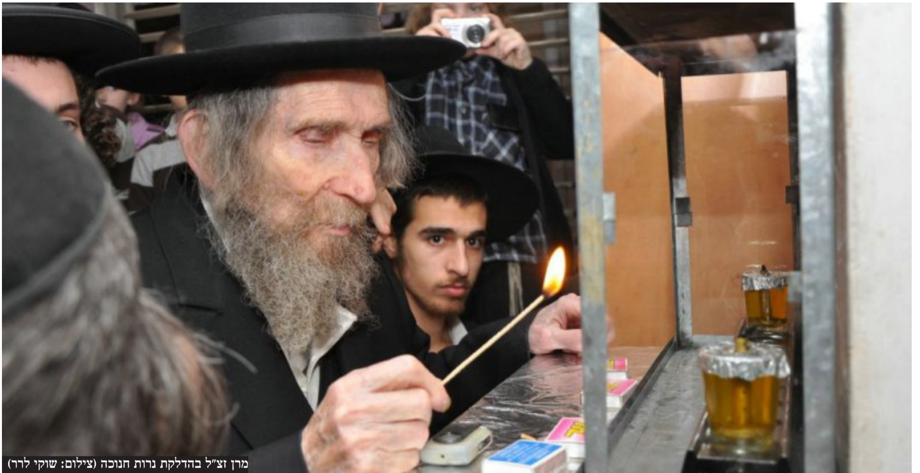
מרן זצ"ל בהדלקת נרות חנוכה

מהו "לימוד התורה" כמה הוא חשוב וכמה אור זה נותן לאדם, זה עצמו דבר גדול ביותר וזה "מתנה גדולה" שקיבל בעמלו מהקב"ה. ועוד שמגדלתו ומרוממתו כמבואר במשנה במסכת אבות. (רה"י ביאר שדעתו דלא כמו שהעולם חושב, שתלמיד ר' פרידא היה קשה הבנה, אלא מדובר שלמדו דברים עמוקים ביותר בדברי תורה, ואותם התקשה להבין).