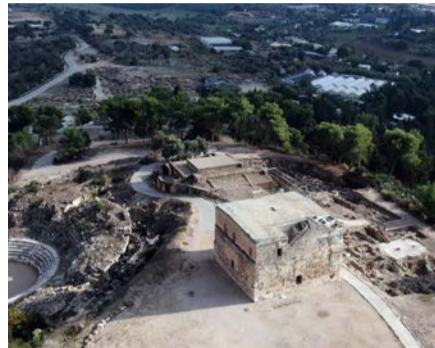
עששית עתיקה מהתקופה הביזנטית