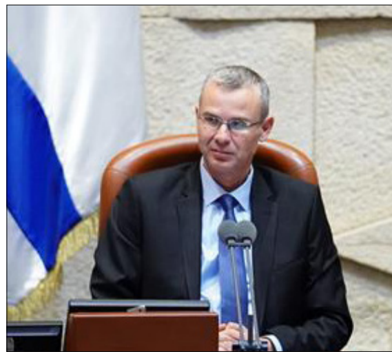
זעם מיותר? שר המשפטים יריב לוין

במפלגות החרדיות מעריכים שהדיונים על החוק יימשכו בועדת חוץ לפחות שבועיים, במקרה הטוב. "אם הוא היה מגיע לוועדה מקצועית בראשות יו"ר מנוסה, למשל ועדת הכספים של גפני, אזי אחרי פחות משבוע כבר היו מצביעים עליו במליאה", אומר לנו בכיר ביהדות התורה, "אבל אצל אדלשטיין ואם להתחשב בהתנהלות בועדה עד עכשיו, נגיד תודה אם האירוע יסתיים עד הוד-ליין שהצבנו, קרי, העברת תקציב 2025 או חודש פברואר - מועד פקיעת הארכת מימון המעונות לילדיהם של חייבי גיוס, בהתאם לפשרה שהוסכמה