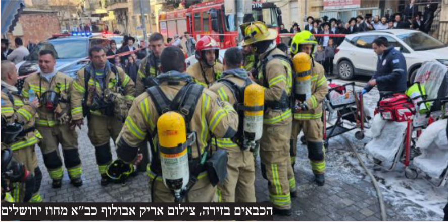
הכבאים בזירה, צילום אריק אבולוף כב"א מחוז ירושלים

בירושלים, למקום הוזעקו כוחות משטרה רבים מתחנת לב הבירה ויס"מ מחוז ירושלים. כוחות המשטרה שהגיעו לזירה, החלו בפעולות חילוץ דרי המקום ולכודים מהבניין הבווער תוך סיכונם ובמטרה להציל חיים. במהלך החילוץ מתנדב משטרה המתגורר בסמוך, פעל בתושייה רבה תוך שפעל במהירות רבה ותוך שימוש בכלי עבודה שברשותו ביניהם- מסור דיסק. המתנדב יחד עם השוטרים פעלו לניסור סורגים ופתיחת דרכי מילוט ללכודים. "בנוסף, נעצרו השוטרים והמתנדב בסולם עמו החלו להוציא את אותם הלכודים שבמקום דרך החלון, ובכך הרחיקו אותם מאזור הסכנה ומנעו את הפגיעה בהם. בהמשך לכך, פעלו וסייעו השוטרים לגורמי ההצלה השונים בהם כב"ה וגורמי רפואה, אשר הוזעקו למקום האירוע."