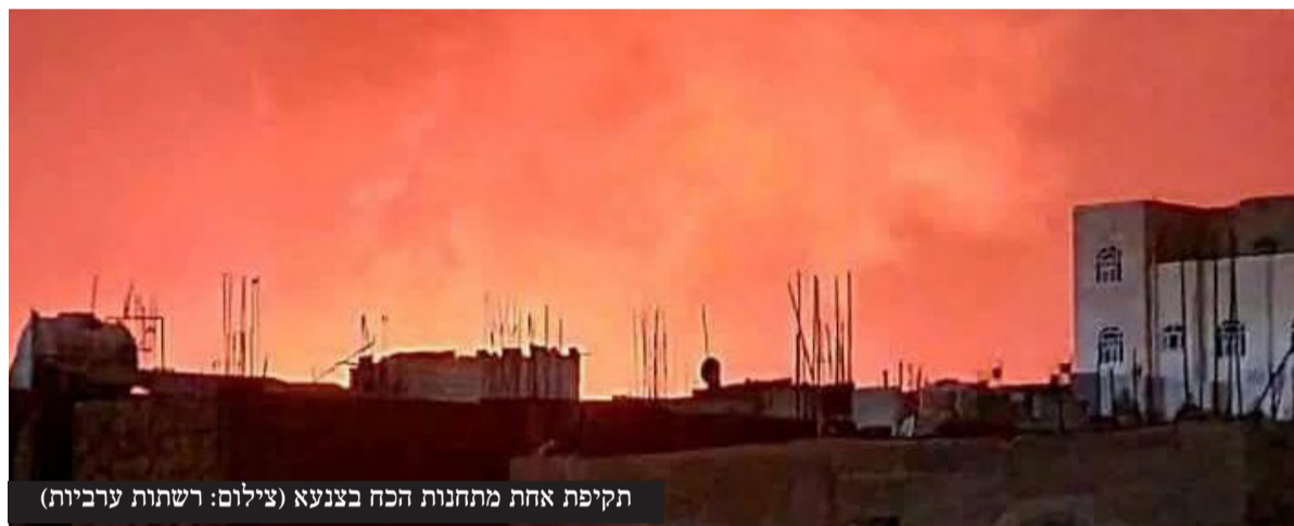
תקיפת אחת מתחנות הכח בצנעא

אחרי שהמליציות של החות'ים הגבירו את התקיפות לעבר ישראל, בצמרת הביטחונית והמדינית של ישראל התקבלה החלטה לצאת למערכה נגד האיום מתימן. ראש המוסד דדי ברנע המליץ לראה"מ לפעול באופן ישיר נגד איראן שמפעילה את החות'ים | עמ' 10