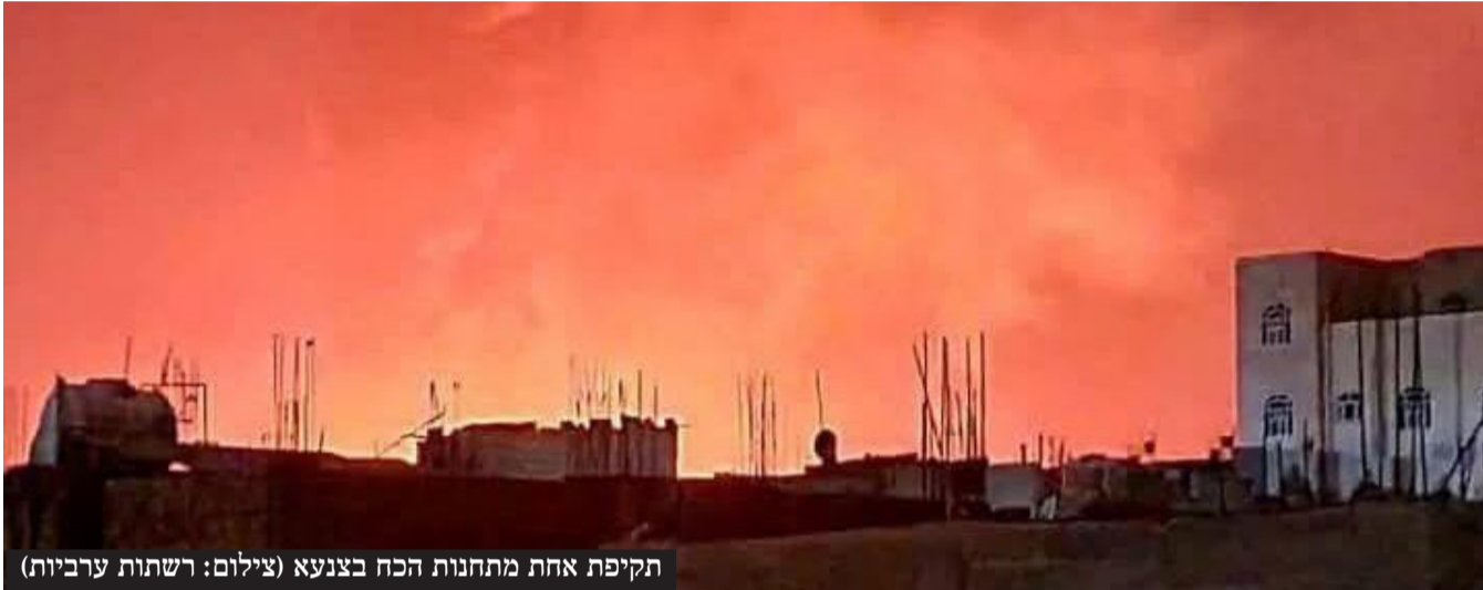
תקיפת אחת מתחנות הכח בצנעא

ההערכה של גורמי הביטחון היא שיהיו ניסיונות מצד החות'ים להמשיך בתקיפות ואף להעצים אותם. "זו הזרוע היחידה שנתרה לאיראן, שעוד מתפקדת בצורה כלשהי", אומרים בישראל. "כפי שפעלנו נגד זרועות ציר הרשע נפעל גם נגד החות'ים".