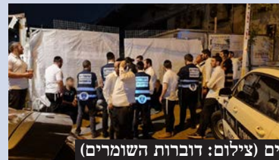
השקת הסניף ופעילות המתנדבים

לאחר תהליך ממושך שכלל בחינת הצרכים המקומיים, סיוורים מקדימים של הנהלת הארגון והתאמת תשתיות לאופי העיר, נחנך השבוע 'סניף בית שמש' של ארגון 'השומרים' המונה עם פתיחתו כ-50 מתנדבים