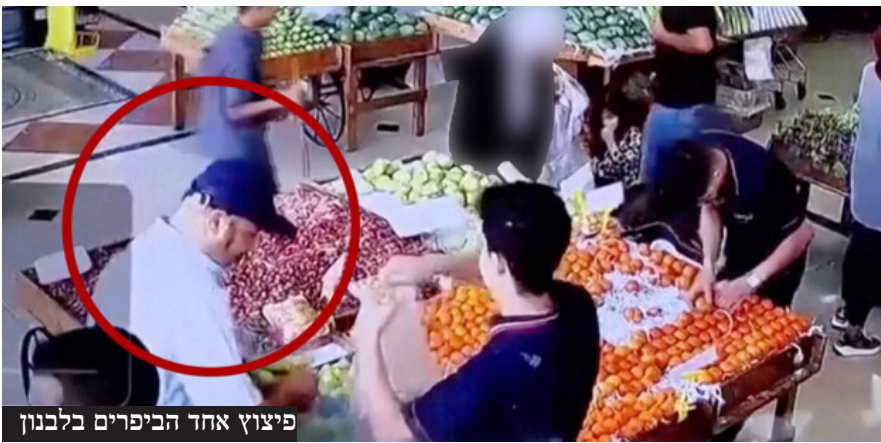
פיצוץ אחד הביפרים בלבנון

אחרי מיגור חיזבאללה שהחל ב'מבצע הביפרים', המוסד לשירותי ביון של מדינת ישראל חושף לעולם את המבצע ומסלולו - "כשהפעלנו את הביפרים, נסראללה היה בבנוקר - הוא ראה אותם מתמוטטים במו עיניו"