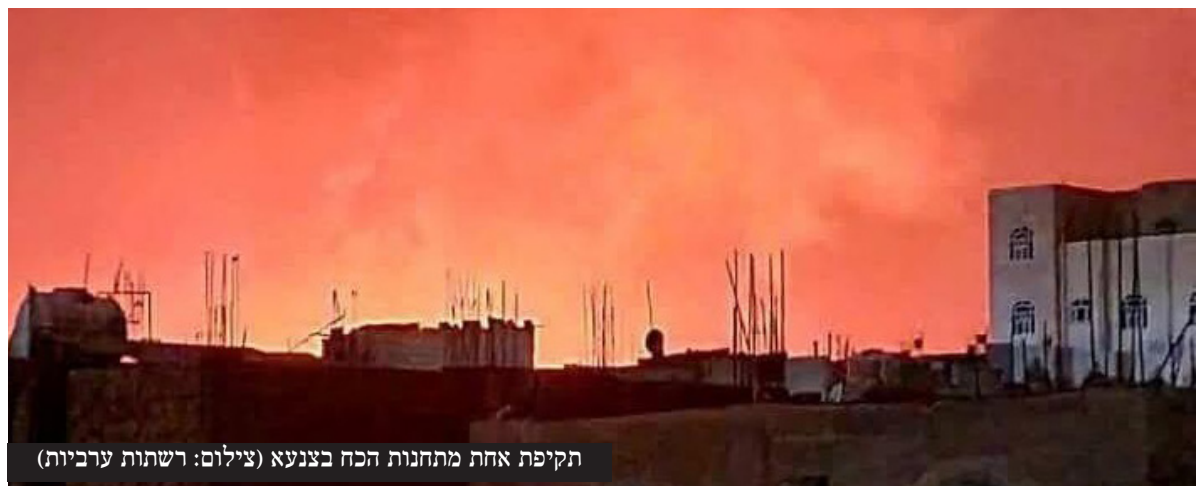
תקיפת אחת מתחנות הכח בצנעא

אחרי שהמליציות של החות'ים הגבירו את התקיפות לעבר ישראל, בצמרת הביטחונית והמדינית של ישראל התקבלה החלטה לצאת למערכה נגד האיום מתימן • ראש המוסד דדי ברנע המליץ לראה"מ לפעול באופן ישיר נגד איראן שמפעילה את החות'ים | עמ' 8