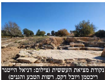
נקודת מציאת העששית