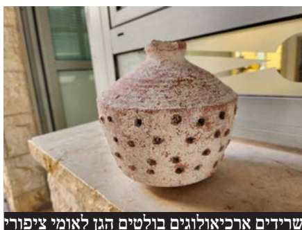
שרידים ארכיאולוגיים בולטים הגן לאומי ציפורי