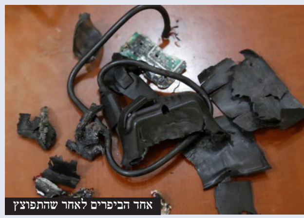
אחד הביפרים לאחר שהתפוצץ

אחרי מיגור חיזבאללה שהחל ב'מבצע הביפרים', המוסד לשירותי ביון של מדינת ישראל חושף לעולם את המבצע ומסלולו • "כשהפעלנו את הביפרים, נסראללה היה בבונקר - הוא ראה אותם מתמוטטים במו עיניו" | עמ' 10