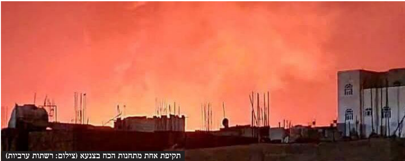
תקיפת אחת מתחנות הכח בצנעא

ההערכה של גורמי הביטחון היא שיהיו ניסיונות מצד החות'ים להמשיך בתקיפות ואף להעצים אותם. "זו הזרוע היחידה שנתרה לאיראן, שעוד מתפקדת בצורה כלשהי", אומרים בישראל. "כפי שפעלנו נגד זרועות ציר הרשע נפעל גם נגד החות'ים".