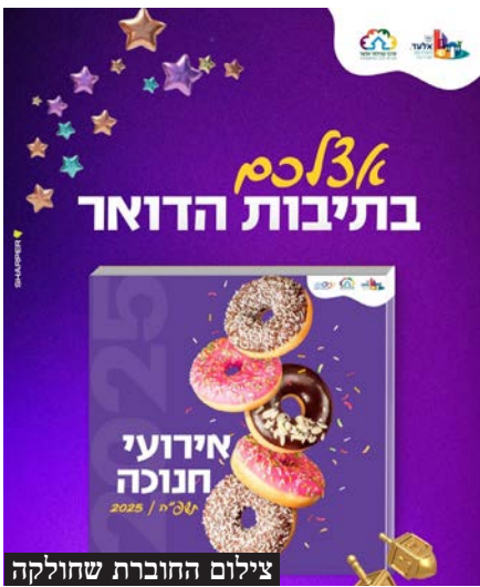
צילום החוברת שחולקה

ביוזמת ראש העיר: עשרות מופעים, סדנאות ואטרקציות לכל המשפחה | "התכנית שגיבשנו כוללת שפע של פעילויות מרתקות לכל בני המשפחה - במחירים נגישים לכל כיס", הדגיש ראש העיר