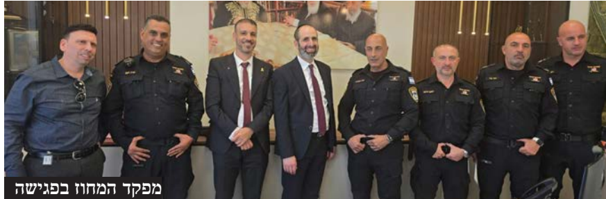
מפקד המחוז בפגישה

כחלק מהמאמצים המתמשכים לחיזוק הביטחון בעיר, ובהמשך להתחייבויות ראש העיר בתקופת הבחירות, הוצג השבוע מהלך חדש, במסגרתו שלושה שוטרים חדשים יתגברו את מערך האבטחה העירוני | "מאז הפיגוע הקשה שידענו, אנו פועלים ללא לאות למיגור תופעת השב"חים ולחיזוק תחושת הביטחון של תושבינו", אמר ראש העיר