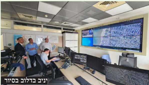
יניב בדלוב בסיור