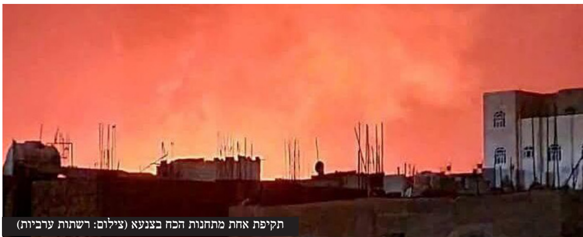
תקיפת אחת מתחנות הכח בצנעא

אחרי שהמליציות של החות'ים הגבירו את התקיפות לעבר ישראל, בצמרת הביטחונית והמדינית של ישראל התקבלה החלטה לצאת למערכה נגד האיום מתימן. ראש המוסד דדי ברנע המליץ לראה"מ לפעול באופן ישיר נגד איראן שמפעילה את החות'ים | עמ' 8