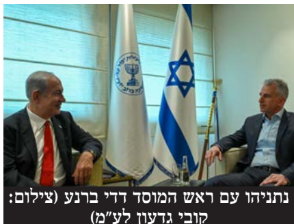
נתניהו עם ראש המוסד דדי ברנע