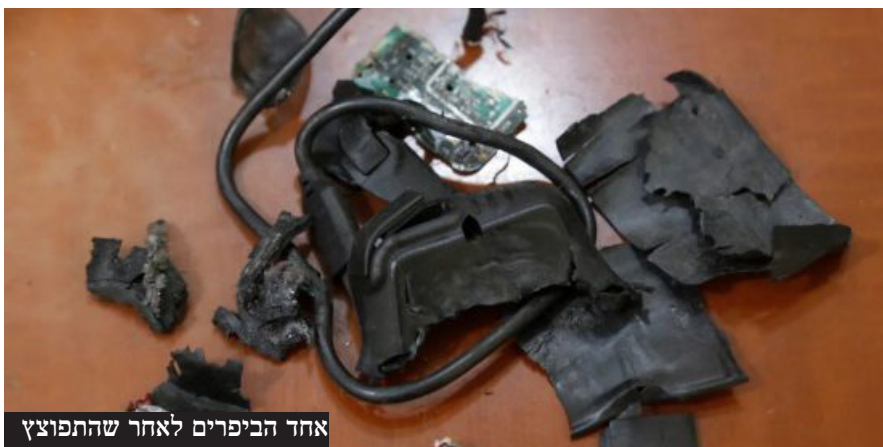
אחד הביפרים לאחר שהתפוצץ

"מי שהרגת, הרגת", הוא אמר. "אבל אלה שפצעת, ועכשיו צריך לקחת אותם לבית החולים ולטפל בהם ולהשקיע בזה כסף - אנשים בלי ידיים ועיניים הם הוכחה חיה בלבנון של 'אל תתעסקו איתנו'. זו הוכחה לעליונות שלנו בכל רחבי המזרח התיכון", אמר.