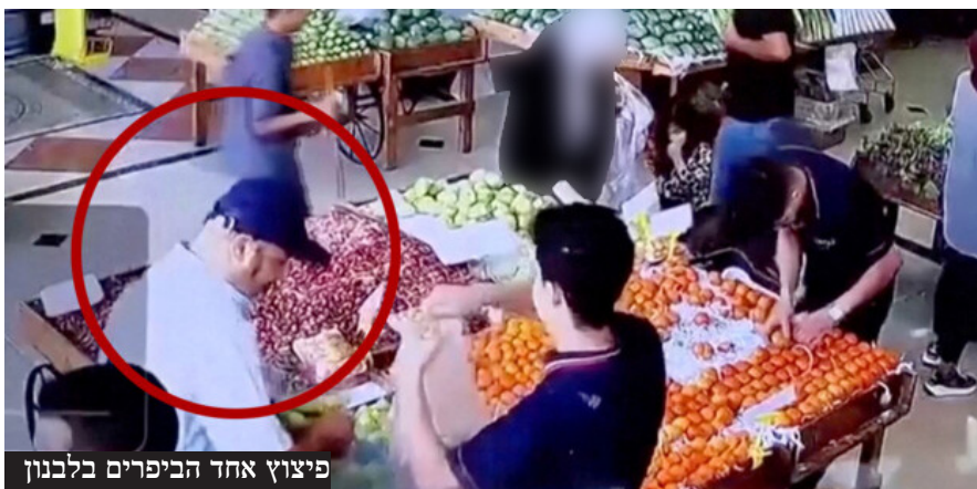
פיצוץ אחד הביפרים בלבנון

אחרי מיגור חיזבאללה שהחל ב'מבצע הביפרים', המוסד לשירותי ביון של מדינת ישראל חושף לעולם את המבצע ומסלולו - "כשהפעלנו את הביפרים, נסראללה היה בבנוקר - הוא ראה אותם מתמוטטים במו עיניו"