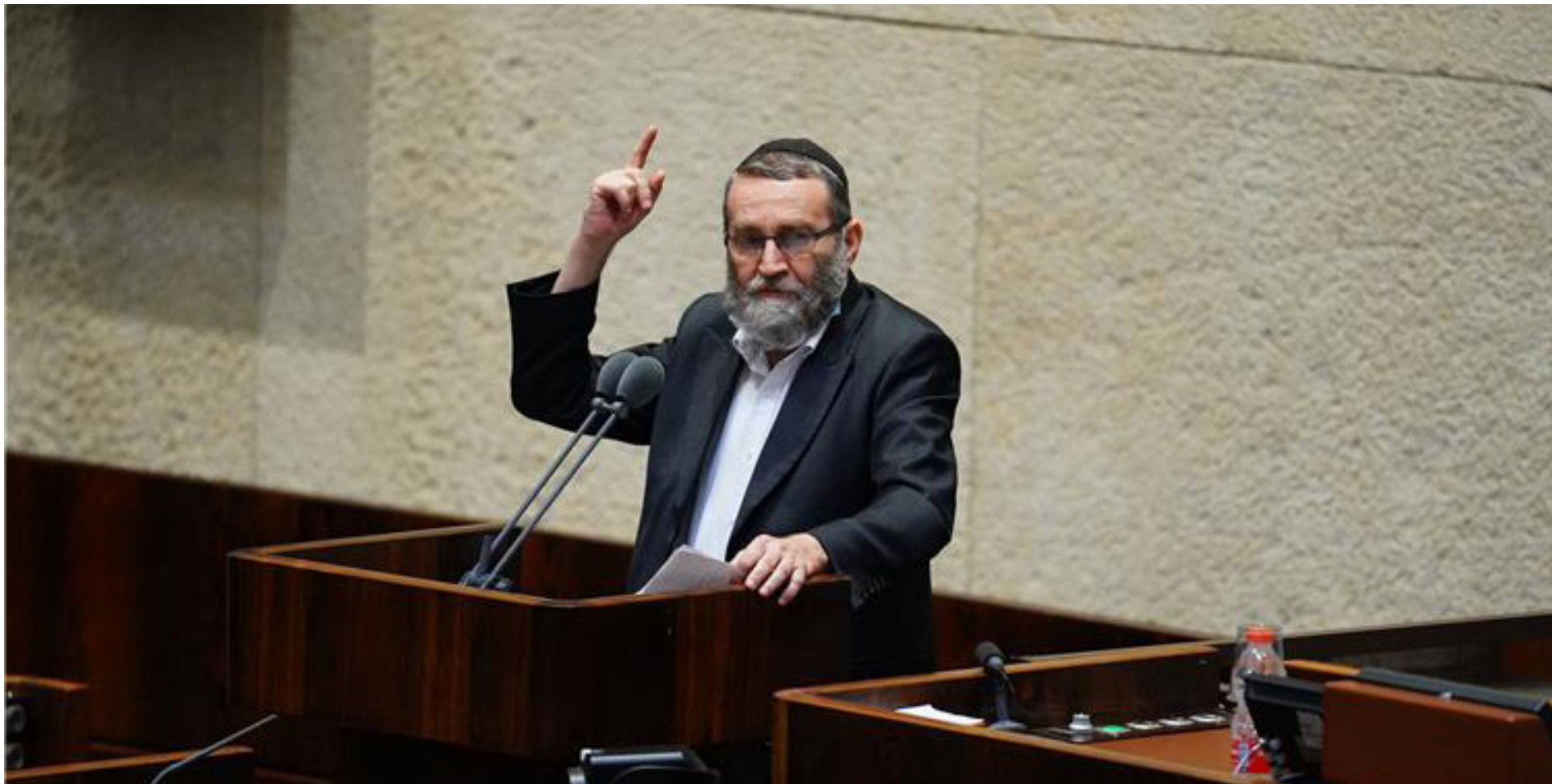
יחשוף את ההצעות של לפיד? יו"ר ועדת הכספים במליאה

המתחיות הקואליציונית שזעזעה את הממשלה בשבוע שעבר ונגרעה השבוע, ומלבד הנאום למופת שנשא במליאת הכנסת, שהצטרף לראיון שהעניק ל'ז'ורנל' - שם רמז לראשונה על אחריות ישראלית ישירה למתקפת הביפרים (בינתיים, שני סוכנים בכירים במוסד התראינו כשהם רעולי פנים לתוכנית אמריקנית פופולארית וחשפו את פרויקט הביפרים לפרטיו, במהלך תקשורתית מתוכנן של הרתעה), גם עדותו במשפט מתקדמת להפליא ומייצרת את הכותרות שהוא ציפה להן.