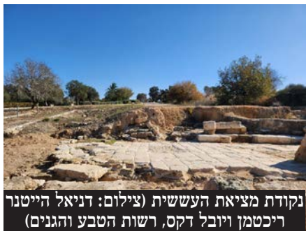
נקודת מציאת העששית