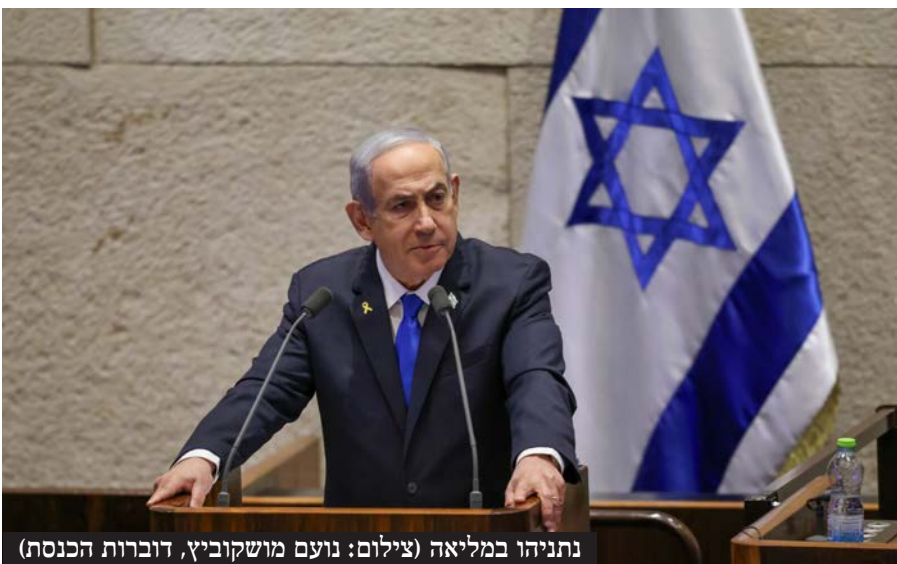
נתניהו במליאה

עוד הוסיף ראש הממשלה: "אני לא יכול לפרט את כל מה שאנחנו עושים, אך מבקש לומר בזהירות שישנה התקדמות מסוימת. להתקדמות הזו יש שלוש סיבות: ראשית, יחיא סינוואר כבר לא איתנו; שנית, חמאס קיווה לעזרת איראן וחיזבאללה, אך הם עסוקים בליקוק הפצעים מהמכות שהנחתנו עליהם; ושלישית, חמאס עצמו תחת לחץ צבאי בלתי פוסק בעזה"