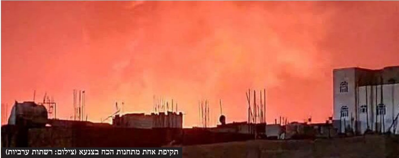
תקיפת אחת מתחנות הכח בצנעא

ההערכה של גורמי הביטחון היא שיהיו ניסיונות מצד החות'ים להמשיך בתקיפות ואף להעצים אותם. "זו הזרוע היחידה שנתרה לאיראן, שעוד מתפקדת בצורה כלשהי", אומרים בישראל. "כפי שפעלנו נגד זרועות ציר הרשע נפעל גם נגד החות'ים".