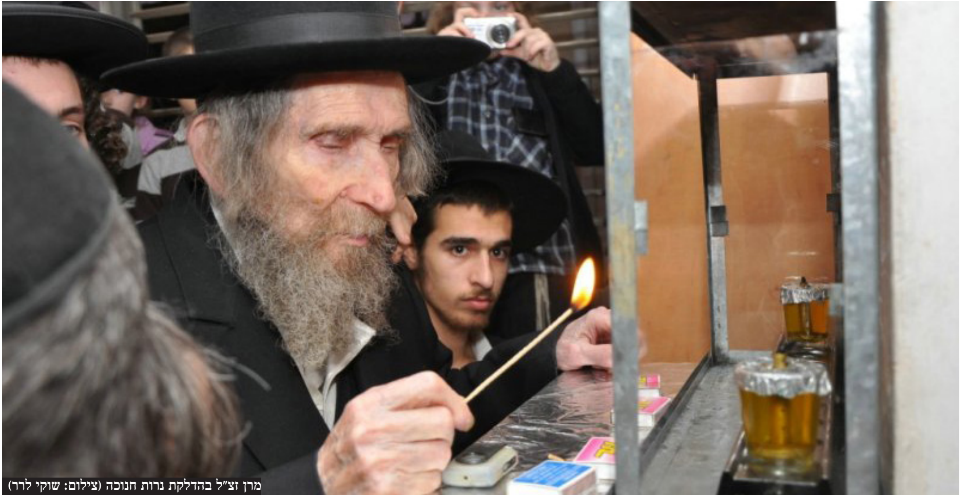
מרן זצ"ל בהדלקת נרות חנוכה

מהו "לימוד התורה" כמה הוא חשוב וכמה אור זה נותן לאדם, זה עצמו דבר גדול ביותר וזה "מתנה גדולה" שקיבל בעמלו מהקב"ה. ועוד שמגדלתו ומרוממתו כמבואר במשנה במסכת אבות. (רה"י ביאר שדעתו דלא כמו שהעולם חושב, שתלמיד ר' פרידא היה קשה הבנה, אלא מדובר שלמדו דברים עמוקים ביותר בדברי תורה, ואותם התקשה להבין).