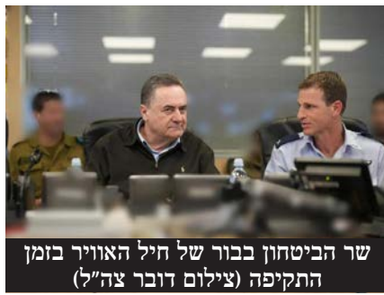
שר הביטחון בבור של חיל האוויר בזמן התקיפה

לדברי הבכירים, חמאס התפרק כמעט לגמרי, המכה האנושה שהונחתה על חיזבאללה, ואחרי שהמליציות הפרו-איראניות בעיראק קצת נסוגו מעניין התקיפות ואחרי שסוריה התפרקה, איראן נחלה שם תבוסה אסטרטגית. לטהרן נשארו רק החות'ים, ולכן היא מעדיפה שלא להתעמת באופן ישיר עם ישראל, אחרי התקיפות על אדמתה, ו"אחרי שרוקנו אותה מכל מערכות ההגנה שלה".