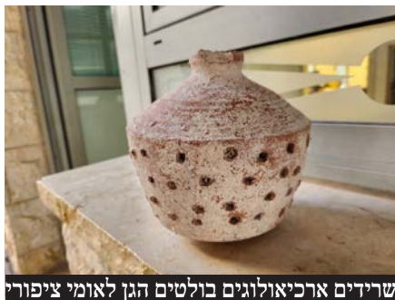
שרידים ארכיאולוגיים בולטים הגן לאומי ציפורי