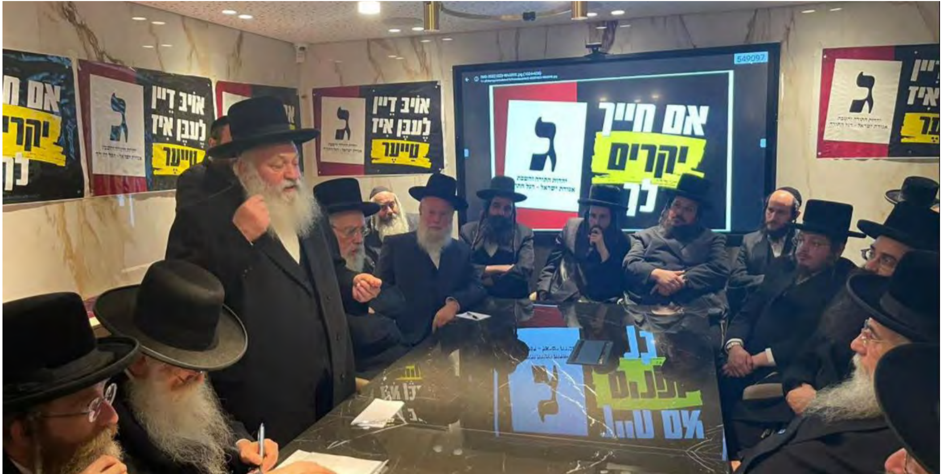
יובילו להפלת הממשלה? חברי הכנסת של 'אגודת ישראל'

רבנים 'מוסמכים'. במילים אחרות, גם אם תוגש עתירה הפעם, אין בנמצא רבניות מוסמכות, ומשכך יתמנו עשרה גברים.