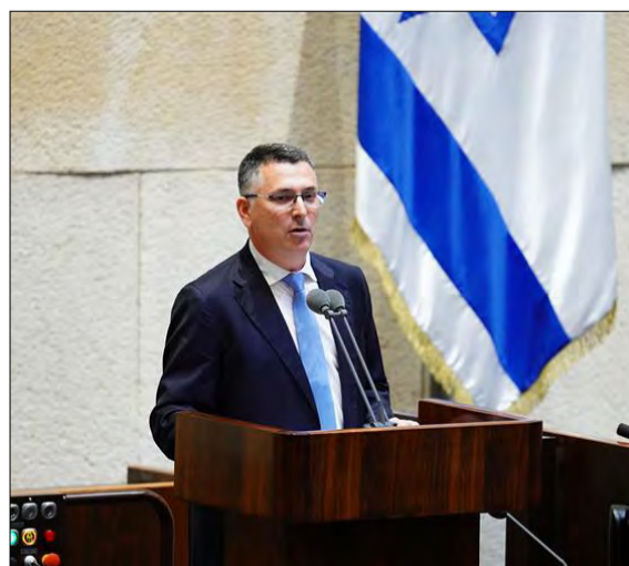
« בטוח במעמדו בימין שר החוץ גדעון סער

ההתנהלות האופוזיציונית הלא ראויה באי הסכמה לתת קיזוז לראש הממשלה, המתאושש מהניתוח ולא יכול להגיע להצבעה (אפילו ח"כ בועז ביסמוט, היושב שבעה על אימו, לא נהנה מקיזוז והוועק לכנסת לצורך ההצבעות), מתנהלים שני המשברים כשהאחד רוכב על גב השני, וכל אחד מהם חסר משמעות בפני עצמו. ששת חברי הכנסת של עוצמה יהודית לבדם לא מספיקים להפוך את תוצאת ההצבעה - גם אם יצביעו נגד החוק, שלושת חברי הכנסת של אגודת ישראל בוודאי אינם מספיקים כדי לעשות זאת. רק הצטרפות של שתי הסיעות, האחת במסגרת מאבקה למען קידום חוק הגיוס והשנייה במסגרת מאבקיו של בן גביר למען תקציב משרדו, עשויה להוביל למשבר קואליציוני חריף ולכישלון בהצבעה (במצב הדברים הנוכחי, בהיעדרות נתניהו, התנגדות של עוצמה יהודית