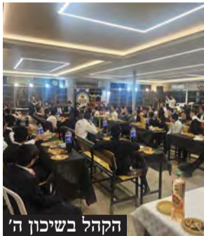
הקהל בשיכון ה'

באירוע חגיגי ומרגש שהתקיים במוצאי שבת פרשת מקץ, נר רביעי של חנוכה, התקיימו מטעם ארגון "שבתי בני ברק" סדרת מעמדי פתיחה המוניים, שהתקיימו בשמונה מוקדים מרכזיים ברחבי העיר