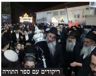
ריקודים עם ספר התורה