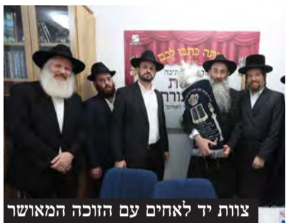
צוות יד לאחים עם הזוכה המאושר