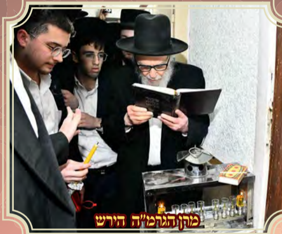
מרח הגרמ"ה הירש