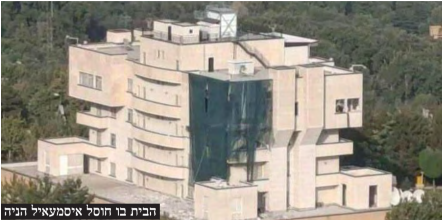
הבית בו חוסל איסמעאיל הניה

גילויים חדשים על מבצע ההאזנות, מבצע הביפרים, חיסול נסראללה בביירות, חיסול איסמעאיל הניה בטהרן ופשיטת כוח הקומנדו הישראלי על מתחם סודי בסוריה