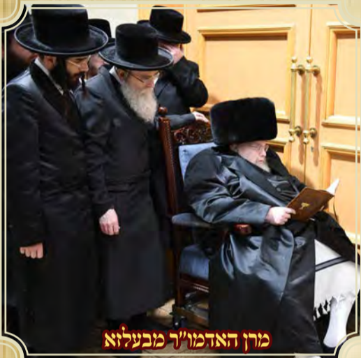
מרח האדמו"ר מבעלזא