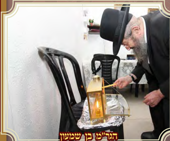
הגר"מ בן שמעון