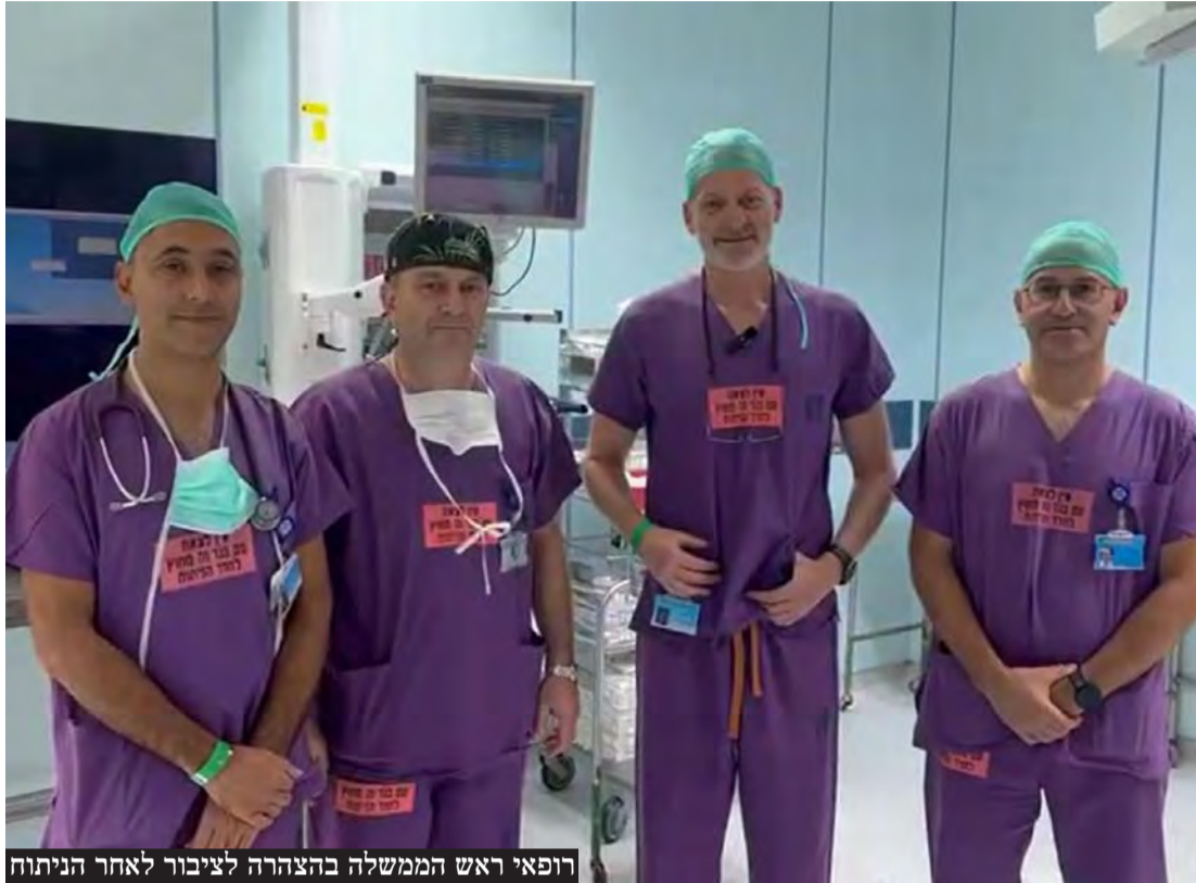
רופאי ראש הממשלה בהצגה לציבור לאחר הניתוח

לפני הניתוח מינה נתניהו את שר המשפטים יריב לוין למחליפו ואת שר הביטחון ישראל כץ כמי שאחראי על כינוס הקבינט בהעדרו של ראש הממשלה