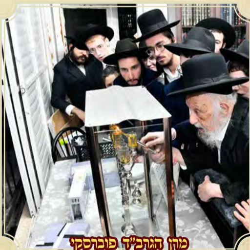
מרח הגרמ"ד פונרסקי