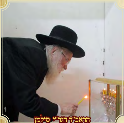
הראב"ד הגר"י סילמן