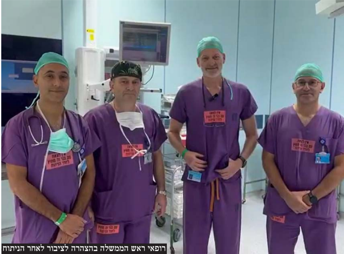
רופאי ראש הממשלה בהצהרה לציבור לאחר הניתוח

לפני הניתוח מינה נתניהו את שר המשפטים יריב לוין למחליפו ואת שר הביטחון ישראל כץ כמי שאחראי על כינוס הקבינט בהעדרו של ראש הממשלה