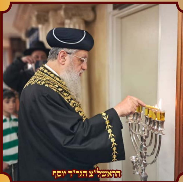
הראש"ל צ'הגר"ד יוסף