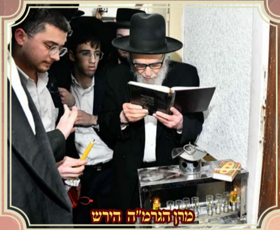
מהר"ם הגר"ה הירש