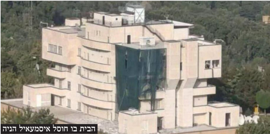
הבית בו חוסל איסמעאיל הניה

גילויים חדשים על מבצע ההאזנות, מבצע הביפרים, חיסול נסראללה בביירות, חיסול איסמעאיל הניה בטהרן ופשיטת כוח הקומנדו הישראלי על מתחם סודי בסוריה