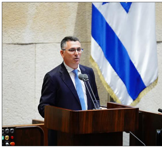
« בטוח במעמדו בימין שר החוץ גדעון סער

ההתנהלות האופוזיציונית הלא ראויה באי הסכמה לתת קיזוז לראש הממשלה, המתאושש מהניתוח ולא יכול להגיע להצבעה (אפילו ח"כ בועז ביסמוט, היושב שבעה על אימו, לא נהנה מקיזוז והוועק לכנסת לצורך ההצבעות), מתנהלים שני המשברים כשהאחד רוכב על גב השני, וכל אחד מהם חסר משמעות בפני עצמו. ששת חברי הכנסת של עוצמה יהודית לבדם לא מספיקים להפוך את תוצאת ההצבעה - גם אם יצביעו נגד החוק, שלושת חברי הכנסת של אגודת ישראל בוודאי אינם מספיקים כדי לעשות זאת. רק הצטרפות של שתי הסיעות, האחת במסגרת מאבקה למען קידום חוק הגיוס והשנייה במסגרת מאבקיו של בן גביר למען תקציב משרדו, עשויה להוביל למשבר קואליציוני חריף ולכישלון בהצבעה (במצב הדברים הנוכחי, בהיעדרות נתניהו, התנגדות של עוצמה יהודית