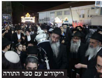
ריקודים עם ספר התורה