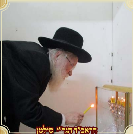
הראב"ד הגר"י סילמן