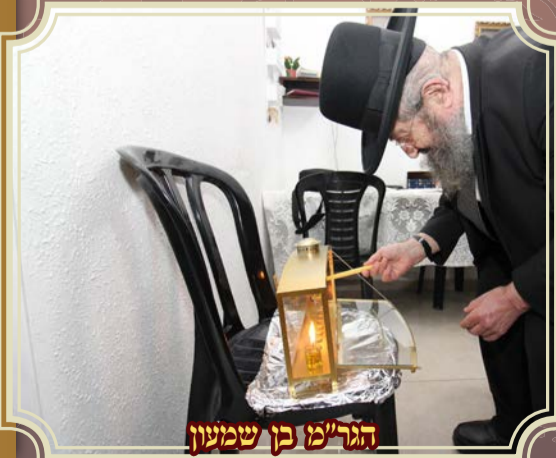
הגר"מ בן שמעון