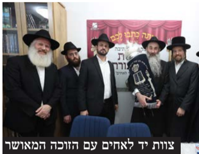
צוות יד לאחים עם הזוכה המאושר