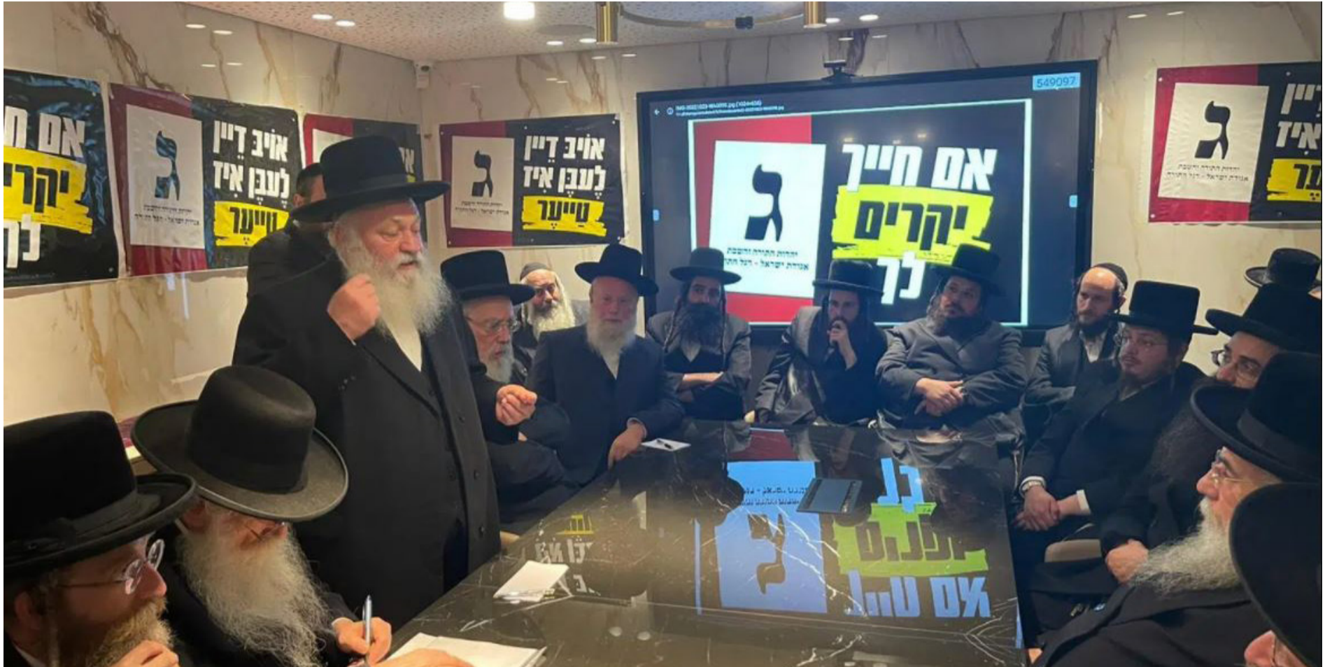
יובילו להפלת הממשלה? חברי הכנסת של 'אגודת ישראל'

רבנים 'מוסמכים'. במילים אחרות, גם אם תוגש עתירה הפעם, אין בנמצא רבניות מוסמכות, ומשכך יתמנו עשרה גברים.