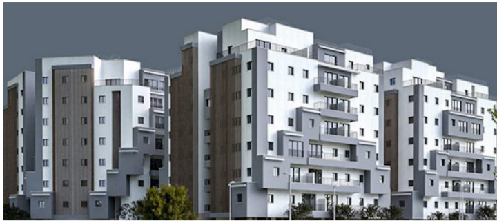
פינוי בינוי בני ברק