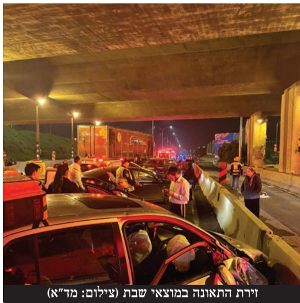
זירת התאונה במוצאי שבת