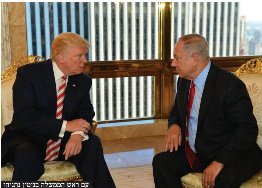
עם ראש הממשלה בנימין נתניהו

מוסרי, כפייה תרבותית והתרחקות מערכים מסורתיים.