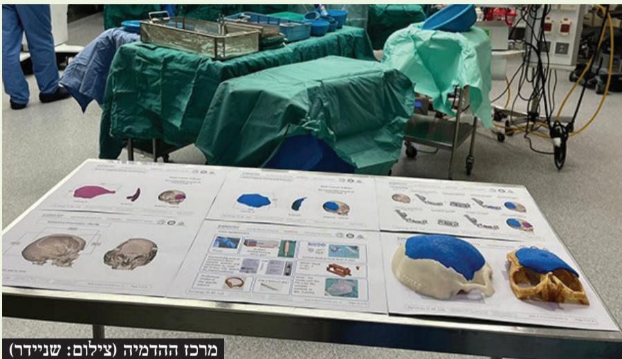
מרכז ההדמיה

בתוך בית החולים שניידר נפתח מרכז המתמחה בפיתוח וייצור אביזרים ושתלים מותאמים אישית בטכנולוגיות תלת מימד ו-AI, המיועדים לפרוצדורות רפואיות שונות, ביניהן: ניתוחים אורתופדיים ואורתואסתטיים, נירוכירורגים וניתוחי לב חזה