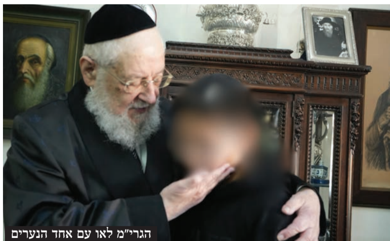
הגרי"מ לאו עם אחד הנערים

מעמד מרטיט ומרגש התקיים השבוע במעונו של הגאון הגדול רבי ישראל מאיר לאו שליט"א, כאשר שבעה נערי בר מצווה, פירות הצלה של ארגון הקודש 'יד לאחים', באו להתברך מפי הרב הראשי לשעבר. הנערים, בני אימהות שזכו לשוב לכור מחצבתן בחסדי שמים ובסיועם המסור של פעילי הארגון, התקבלו במאור פנים על ידי הרב לאו.