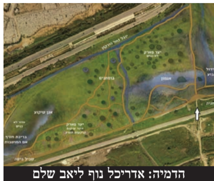
הדמיה: אדריכל גוף ליאב שלם

בעזרת מענק של הקרן לשטחים פתוחים העיריה תקים אגמון טבעי בסמוך לבריכת החורף וכחלק מהפארק המטרופוליני בירקון