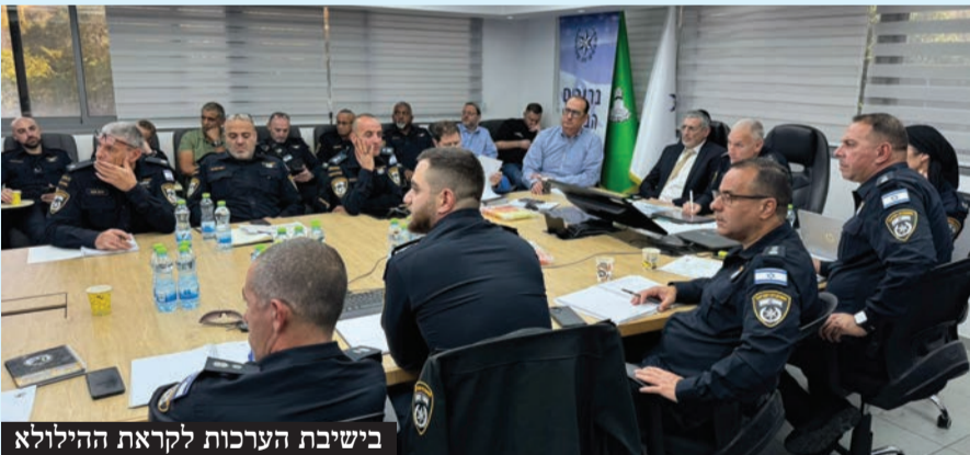
בשיבת הערכות לקראת הילולת

היערכות שיא להילולת 41 שנה לפטירת סידנא בנא סאלי זיע"א בהשתתפות בכירי המשרד לשירותי דת וקציני משטרת ישראל