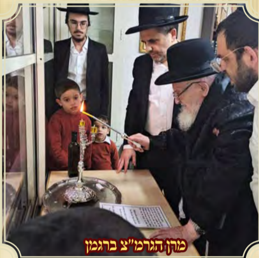
מרן הגרמ"צ ברגמן