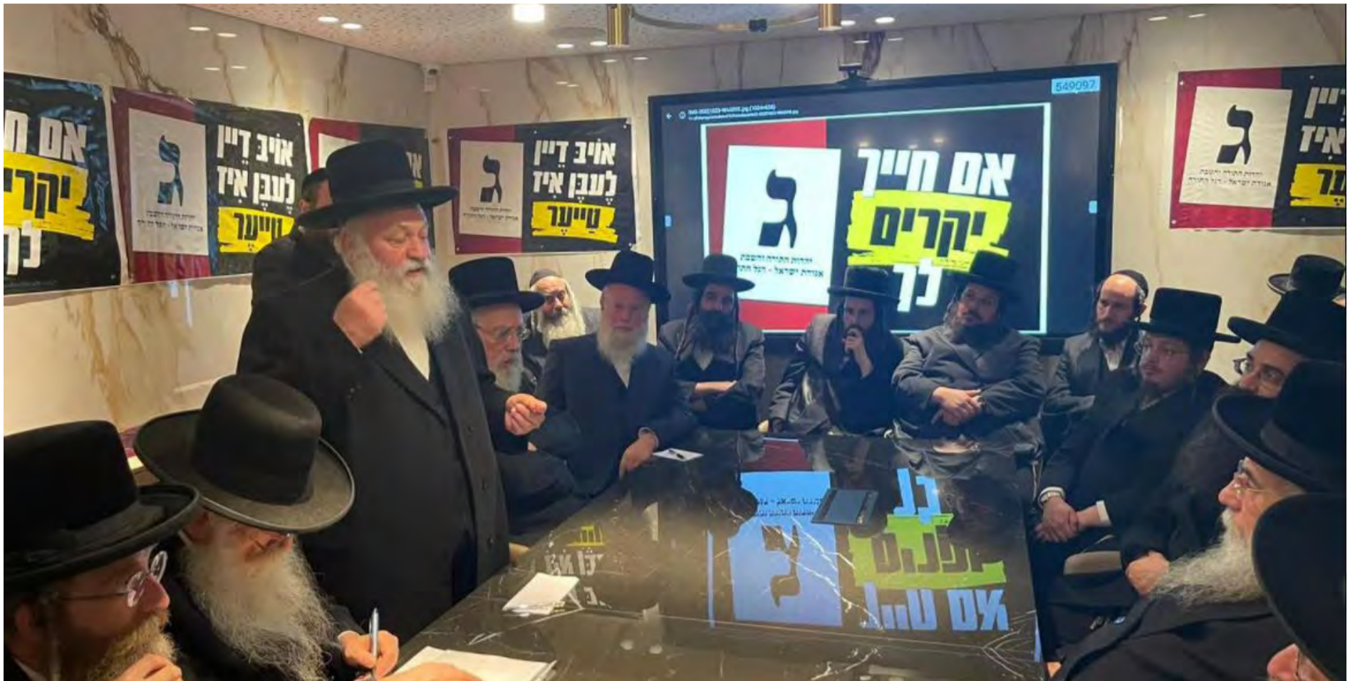
יובילו להפלת הממשלה? חברי הכנסת של 'אגודת ישראל'

רבנים 'מוסמכים'. במילים אחרות, גם אם תוגש עתירה הפעם, אין בנמצא רבניות מוסמכות, ומשכך יתמנו עשרה גברים.