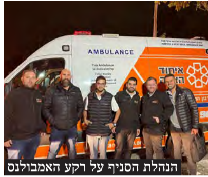
הנהלת הסניף על רקע האמבולנס

לאחרונה הצטרף אמבולנס חדש לשירות סניף איחוד הצלה פתח תקווה, המיועד לתת מענה רפואי מהיר ומקצועי לתושבי העיר והסביבה. האמבולנס מצויד בכל הציוד הנדרש לתפעול רפואי מלא, ומשמש את מתנדבי הסניף במסגרת פעולותיהם להצלת חיים.