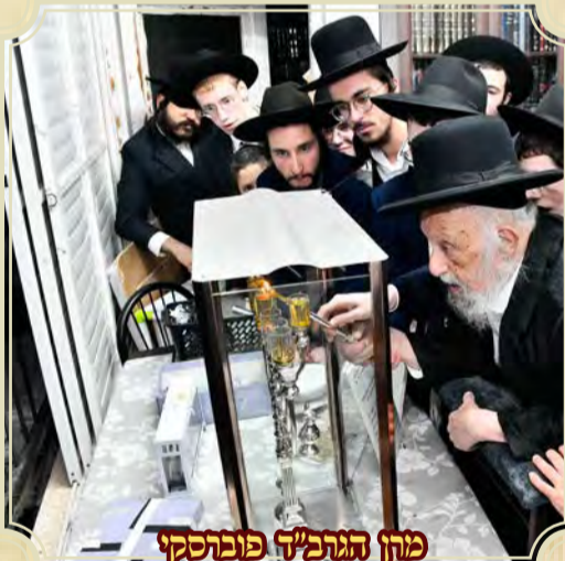
מרן הגרמ"ד פופרסקי