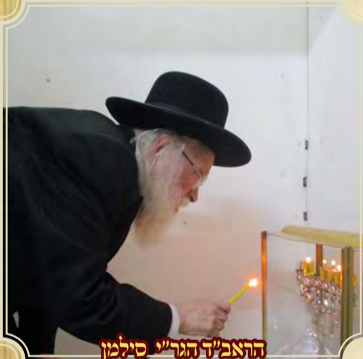
הראב"ד הגר"י סילמן