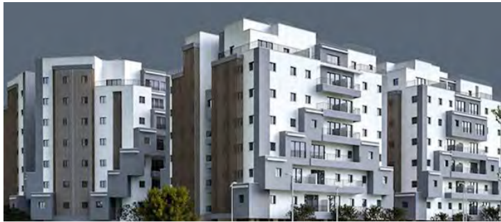
פינוי בינוי בניי בוק