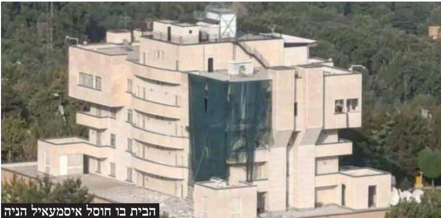
הבית בו חוסל איסמעאיל הניה

גילויים חדשים על מבצע ההאזנות, מבצע הביפרים, חיסול נסראללה בביירות, חיסול איסמעאיל הניה בטהרן ופשיטת כוח הקומנדו הישראלי על מתחם סודי בסוריה