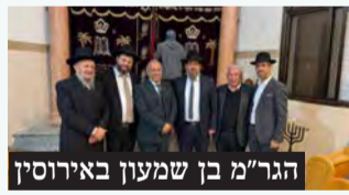
הגר"מ בן שמעון באירוסין

רבה של בני ברק הגר"מ בן שמעון שליט"א השתתף השבוע בשמחת אירוסיו בנו של שר הבריאות הרב אוריאל בוסו, באולמי קונקורד בבני ברק עם הכלה למשפחת רבין. מזל טוב.