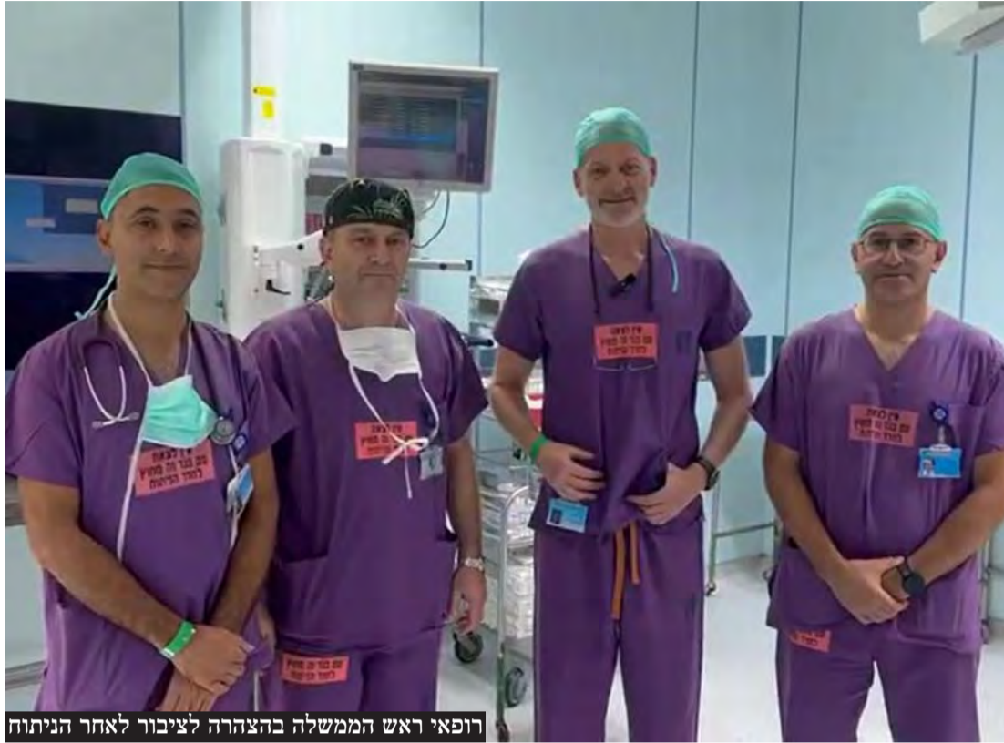
רופאי ראש הממשלה בהצגה לציבור לאחר הניתוח

לפני הניתוח מינה נתניהו את שר המשפטים יריב לוין למחליפו ואת שר הביטחון ישראל כץ כמי שאחראי על כינוס הקבינט בהעדרו של ראש הממשלה