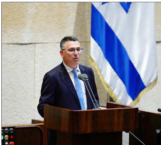
« בטוח במעמדו בימין שר החוץ גדעון סער