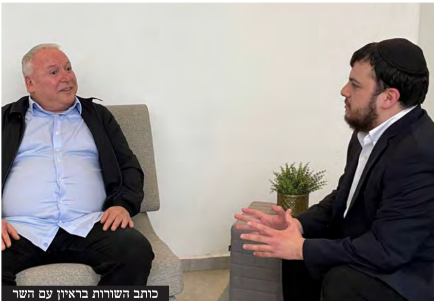
כותב השורות בריאיון עם השר

"היועמ"שית לא יכולה להישאר עוד יום אחד. היא מחבלת כל יום בעבודת הממשלה - זו המשימה שלה" • השר דוד אמסלם קורא בריאיון סוער להדחת היועמ"שית, ומתקומם על הפגיעה במשפחות החרדיות בנושא המעונות והאפליה כלפי הציבור החרדי בסוגיית הגיוס