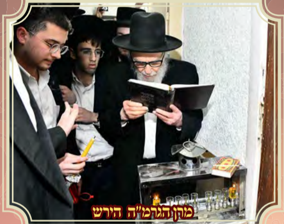
מרן הגרמ"ה הירש