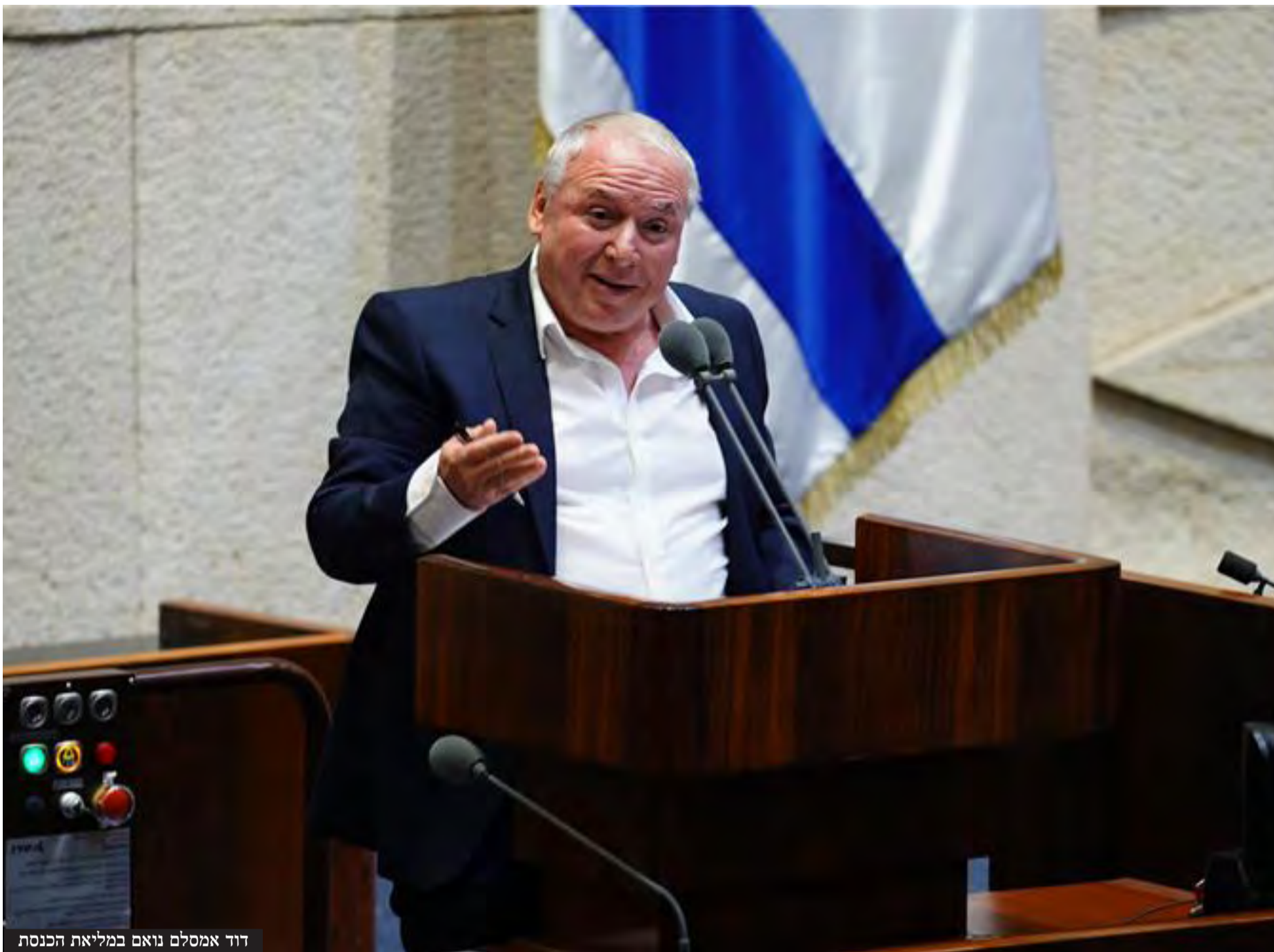
דוד אמסלם נואם במליאת הכנסת

מלגות קיום, העדפות במעונות ותעסוקה, ולאחר זמן קצר הם כבר מפגינים עם דגלי אשף נגד מדינת ישראל.