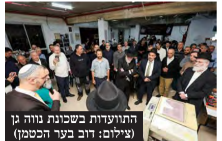
התוועדות בשכונת נווה גן