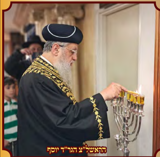
הראשל"צ הגר"ד יוסף