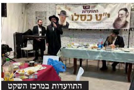
התוועדות במרכז השקט

במוצאי שבת, בבית הכנסת "אור מאיר" בפתח תקווה, התקיימה התוועדות מיוחדת. כ-100 אנשים ונשים התכנסו לחגוג את