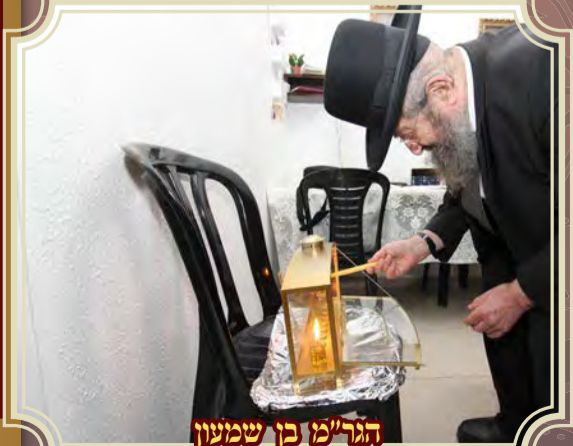
הגר"מ בן שמעון