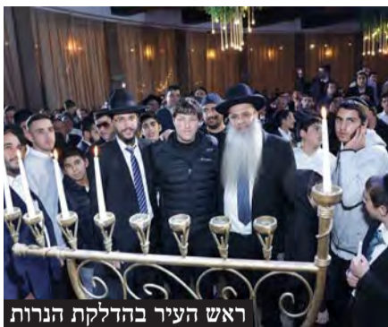
ראש העיר בהדלקת הנרות

החגיגות התקיימו בשילוב מסיבת החנוכה הגדולה בישראל בהשתתפות עיריית פתח תקווה