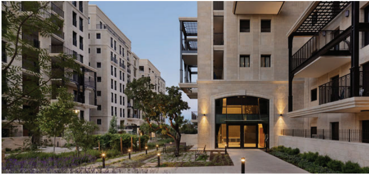
Jerusalem Estates, שונל, נרויקט