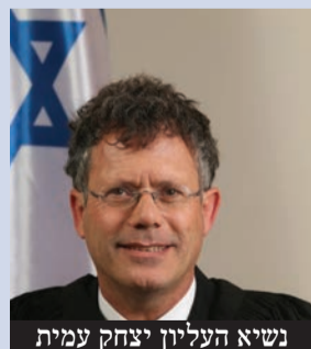
נשיא העליון יצחק עמית

השופט יצחק עמית מונה לנשיא בית המשפט העליון חרף התנגדות שר המשפטים יריב לוין ונציגי הקואליציה שהחרימו את הדיון בועדה לבחירת שופטים ולמרות הטענות הקשות כלפי עמית • השר לוין הבהיר: "איני מכיר בשופט יצחק עמית כנשיא בית המשפט העליון. הליכי 'בחירתו' פסולים מיסודם ואינם חוקיים" | עמ' 10