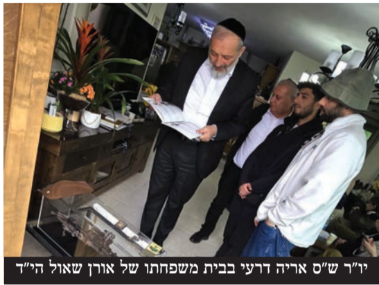
יו"ר ש"ס אריה דרעי בבית משפחתו של אורן שאול הי"ד

יו"ר ש"ס אריה דרעי: "נעשה מאמץ גדול שאחרון החטופים יחזרו, אנחנו לא פועלים בהצהרות ולא באיומים. אנחנו מצווים לזה ונעשה כל שביכולתנו שאחרון החטופים יחזרו בחזרה" • השר יואב בן צור: "אני פונה לביבי, לך עם העסקה עד הסוף. אנחנו צריכים להחזיר את כל החטופים ונתמוך בך בעניין הזה בכל הכוח"