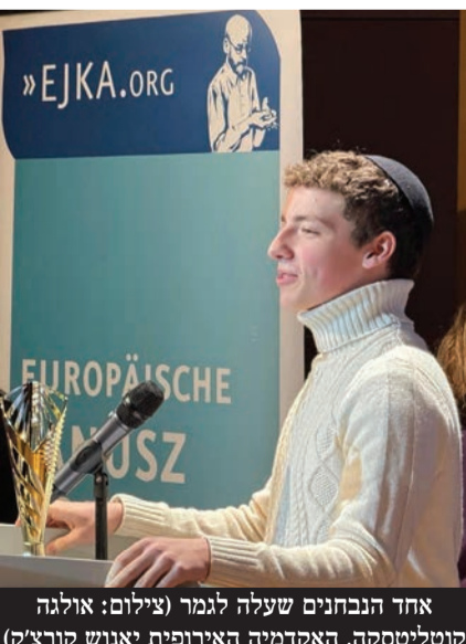
אחד הנבחנים שעלה לגמר