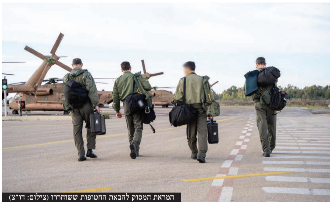
המראת המסוק להבאת החטופות ששוחררו

שלושה חטופים ישוחררו השבוע אחרי שחרורן של ארבע היילות משבי המאס בשבת האחרונה • מזעזע: חלק מהחטופות הוחזקו במנהרות המאס שמונה חודשים • קידוש השם: אם החטופה ביקשה לשמור על קדושת השבת ובתה תשוחרר ביום חול • למרות שצה"ל נשאר בלבנון: הסכם הפסקת האש בין ישראל ללבנון הוארך | עמ' 9