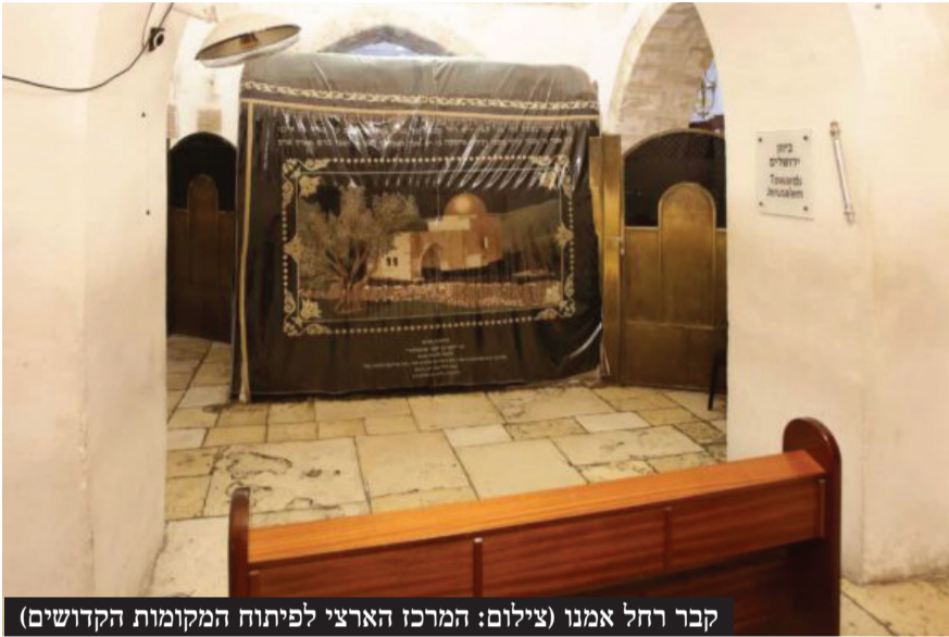
קבר רחל אמנו