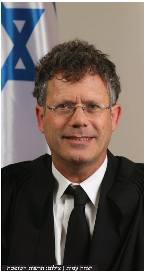
יצחק עמית