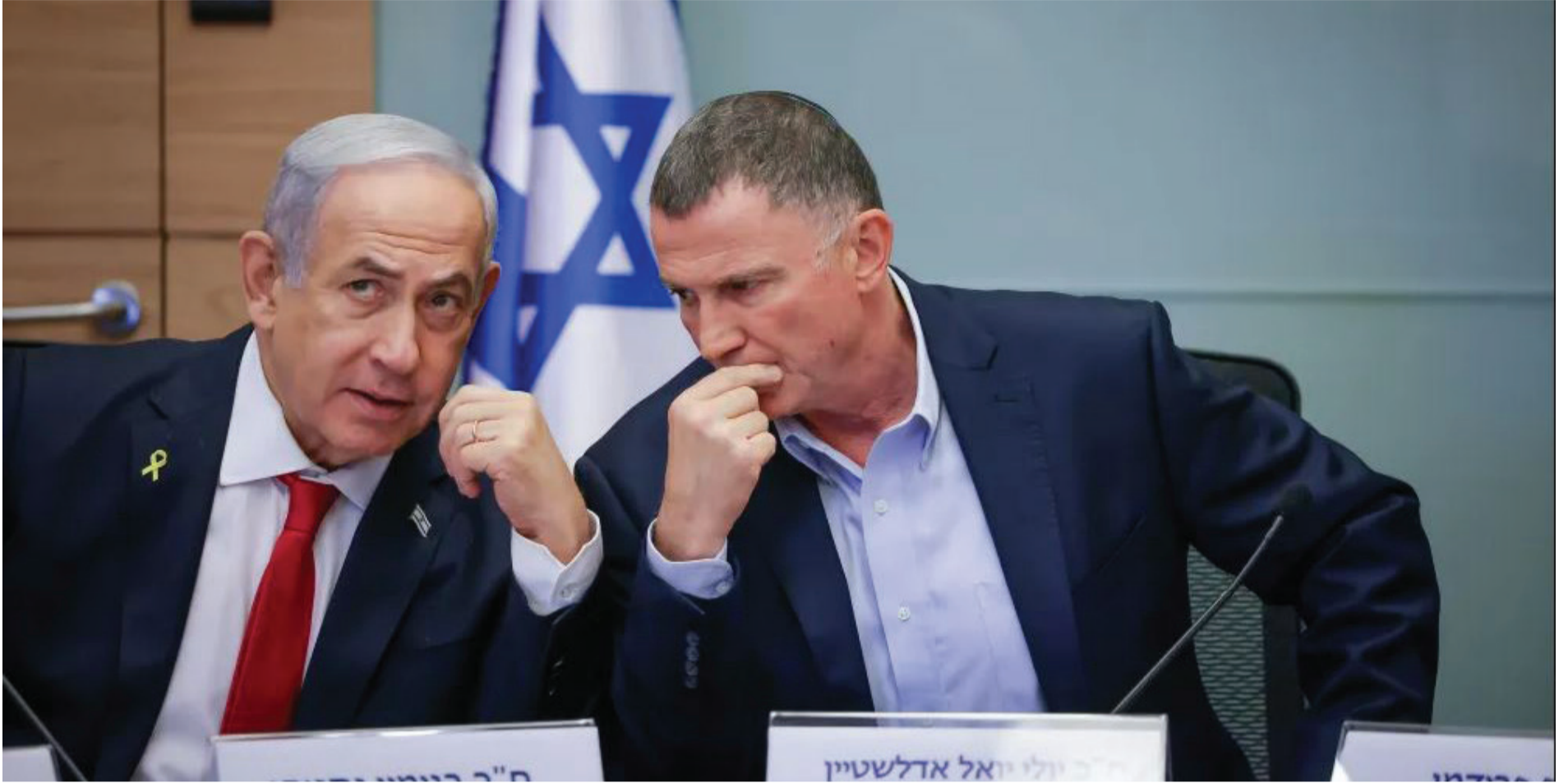
פגישה שקטה והשפעתה בצידה. ראש הממשלה וי"ר ועדת חוק וביטחון