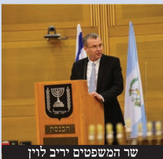
שר המשפטים יריב לוין