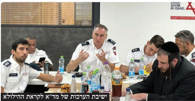
ישיבת הערכות של מד"א לקראת ההילולא

מתנדבי מד"א-הצללה דרום יאבטחו את רבבות העולים להשתטח על ציונו של הבנא סאלי בנתיבות ביומא דהילולא המ"א לפטירתו | צוותי החירום של מד"א והמתנדבים ייפרסו בכל רחבי מתחם ההילולא, בדרכי הגישה וברחבי העיר נתיבות על מנת לתת מענה רפואי בשעת הצורך