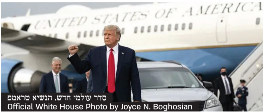
סדר עולמי חדש. הנשיא טראמפ

הבקייעים בגוש המערבי גדלים, ושובו של טראמפ לבית הלבן כמשתנה המכריע ביותר בשאלה לאן מועדות פני המערב בשנה הקרובה. כאשר מנגד רוסיה, צפון-קוריאה ואיראן קרובות מתמיד. ישראל ממוקמת היטב על מנת לשמש "גשר" בין-אזורי ולמצב עצמה כגורם מתווך במחנה המערבי