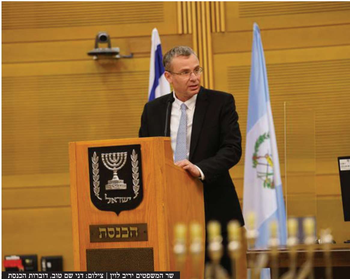
שר המשפטים יריב לוי

השופט יצחק עמית מונה לנשיא בית המשפט העליון חרף התנגדות שר המשפטים יריב לוי ונציגי הקואליציה שהחרימו את הדיון בוועדה לבחירת שופטים ולמרות הטענות הקשות כלפי עמית • השר לוי הבהיר: "איני מכיר בשופט יצחק עמית כנשיא בית המשפט העליון. הליכי 'בחירתו' פסולים מיסודם ואינם חוקיים"