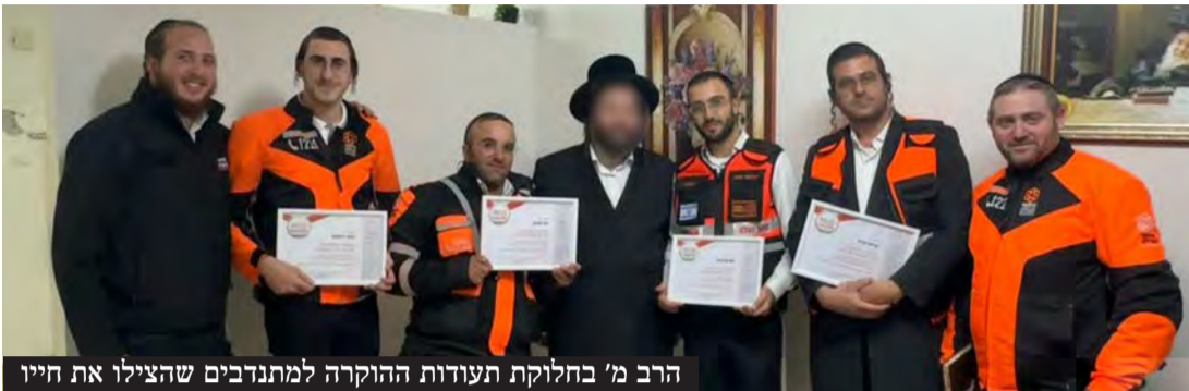
הרב מ' בחלוקת תעודות ההוקרה למתנדבים שהצילו את חייו

במלאת שנה לנס: האברך שחזר לחיים לאחר שאיבד את הכרתו בכולל בו למד, נפגש עם מתנדבי איחוד הצלה שהצילו את חייו והעניק להם ספר עם הקדשה אישית ותעודת הוקרה