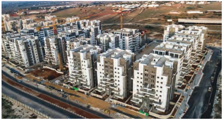
נוויקט תדהו באחיסמך