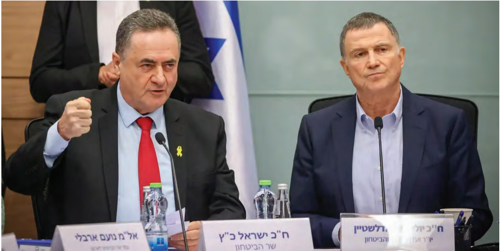
שר הביטחון מציג את עקרונות חוק הגיוס בועדת חוק וביטחון