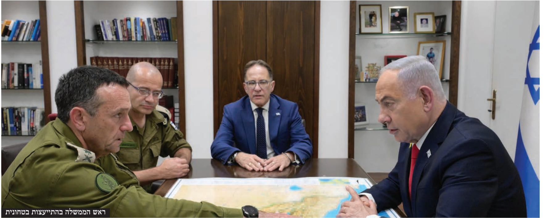
ראש הממשלה בהתייעצות בטחונית

ישראל צפויה לחתום על עסקה לשחרור 33 חטופים, תחילה נשים וילדים ואחר כך גברים מבוגרים וכמה צעירים יותר, בתמורה לשחרור כ-1,300 מחבלים, הפסקת אש ונסיגה מחלקים גדולים ברצועת עזה