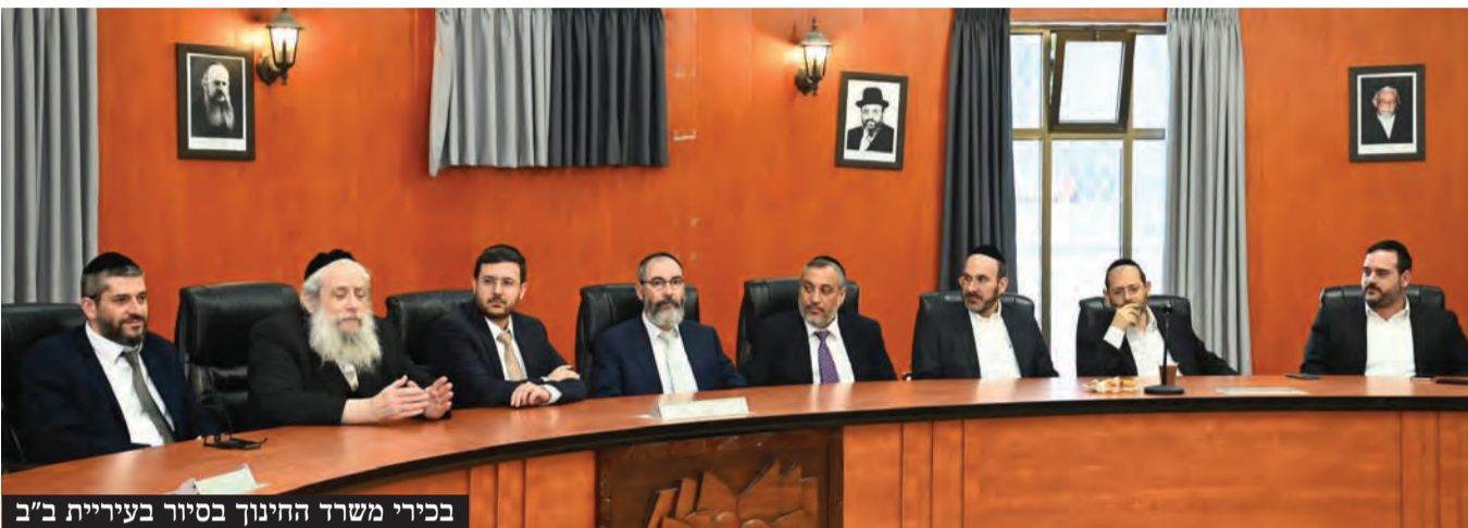
בכירי משרד החינוך בסיור בעיריית ב"ב