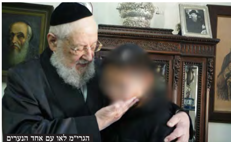
הגרי"מ לאו עם אחד הנערים

מעמד מרטיט ומרגש התקיים השבוע במעונו של הגאון הגדול רבי ישראל מאיר לאו שליט"א, כאשר שבעה נערי בר מצווה, פירות הצלה של ארגון הקודש 'יד לאחים', באו להתברך מפי הרב הראשי לשעבר. הנערים, בני אימהות שזכו לשוב לכור מחצבתן בחסדי שמים ובסיועם המסור של פעילי הארגון, התקבלו במאור פנים על ידי הרב לאו.