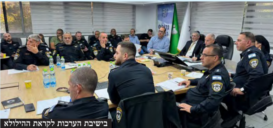
בשיבת הערכות לקראת הילולא

היערכות שיא להילולת 41 שנה לפטירת סידנא בנא סאלי זיע"א בהשתתפות בכירי המשרד לשירותי דת וקציני משטרת ישראל