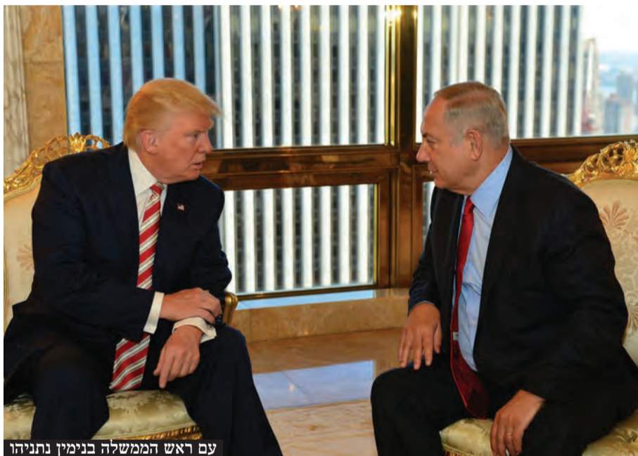
עם ראש הממשלה בנימין נתניהו

מוסרי, כפייה תרבותית והתרחקות מערכים מסורתיים.