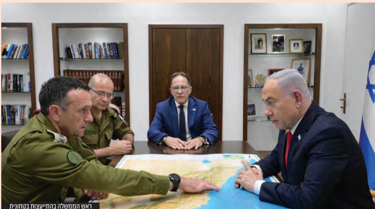
ראש הממשלה בהתייעצות בטחונית

ישראל צפויה לחתום על עסקה לשחרור 33 חטופים, תחילה נשים וילדים ואחר כך גברים מבוגרים וכמה צעירים יותר, בתמורה לשחרור כ-1,300 מחבלים, הפסקת אש ונסיגה מחלקים גדולים ברצועת עזה | עמ' 16