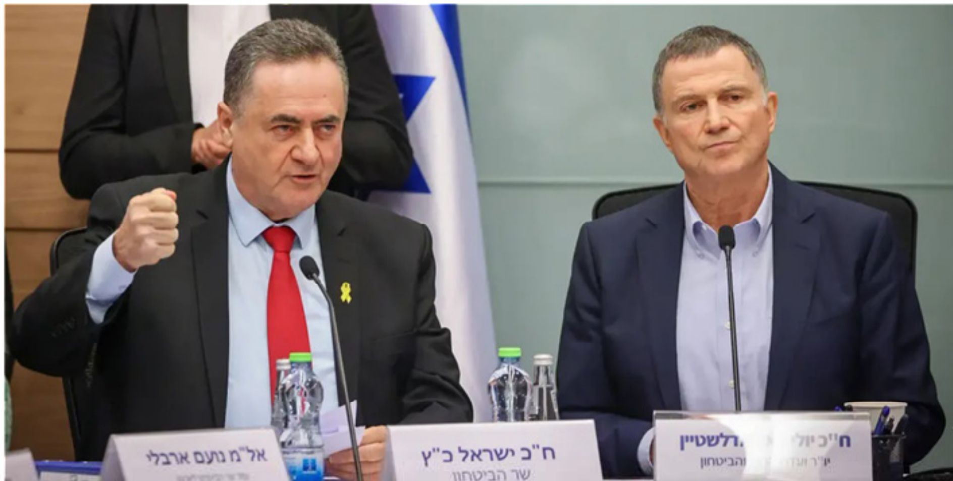
שר הביטחון ח"כ ישראל כ"ץ (מימין) ושר החינוך ח"כ נפתלי בנען (שמאל) יחד עם שרי ממשלת ישראל