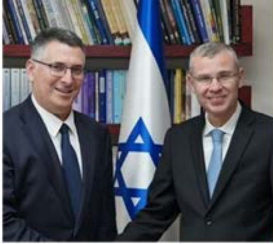
« מחדשים את הרפורמה שרי החוץ המשפטים יצאום: סראמפ וסמוסר'ץ'»

« לפי כץ, מבנה הסנקציות במקרה של אי עמידה ביעדים יהיה כדלקמן: סנקציות כלכליות מוסריות, שיוטלו על כלל הישיבות, וסנקציות אישיות כלכליות (בסגנון ביטול הסכסוד במשנות) שיוטלו באופן אישי על כלל אלו שלא יתגייסו. מנקודה אחת ניסה כץ לחמוק, והיא שאלת הסנקציות הפליליות. אם יש נושא שעשוי להבעיר את דיוני הועדה בהמשך, ועוד יוכל להתגלות כמוקש - הוא בדיוק הנושא הזה. האם במקרה של כישלון היעדים ייחשב כל בחור ישיבה גם עבריין פלילי, או שהוא רק יספוג סנקציה כלכלית גרידא. הנציגות החרדית כבר הספיקה לתדרך כי גם כץ עצמו יודע שמדובר בעו שדינה להישחט עוד לפני ההצבעה במליאה