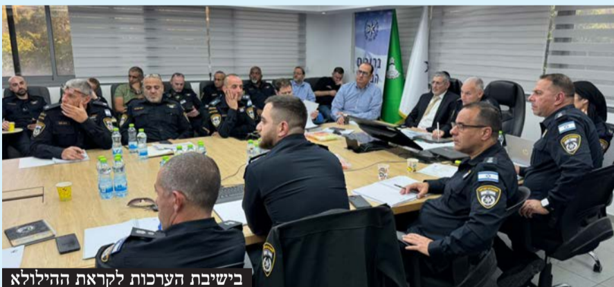
בשיבת הערכות לקראת הילולא

היערכות שיא להילולת 41 שנה לפטירת סידנא בנא סאלי זיע"א בהשתתפות בכירי המשרד לשירותי דת וקציני משטרת ישראל