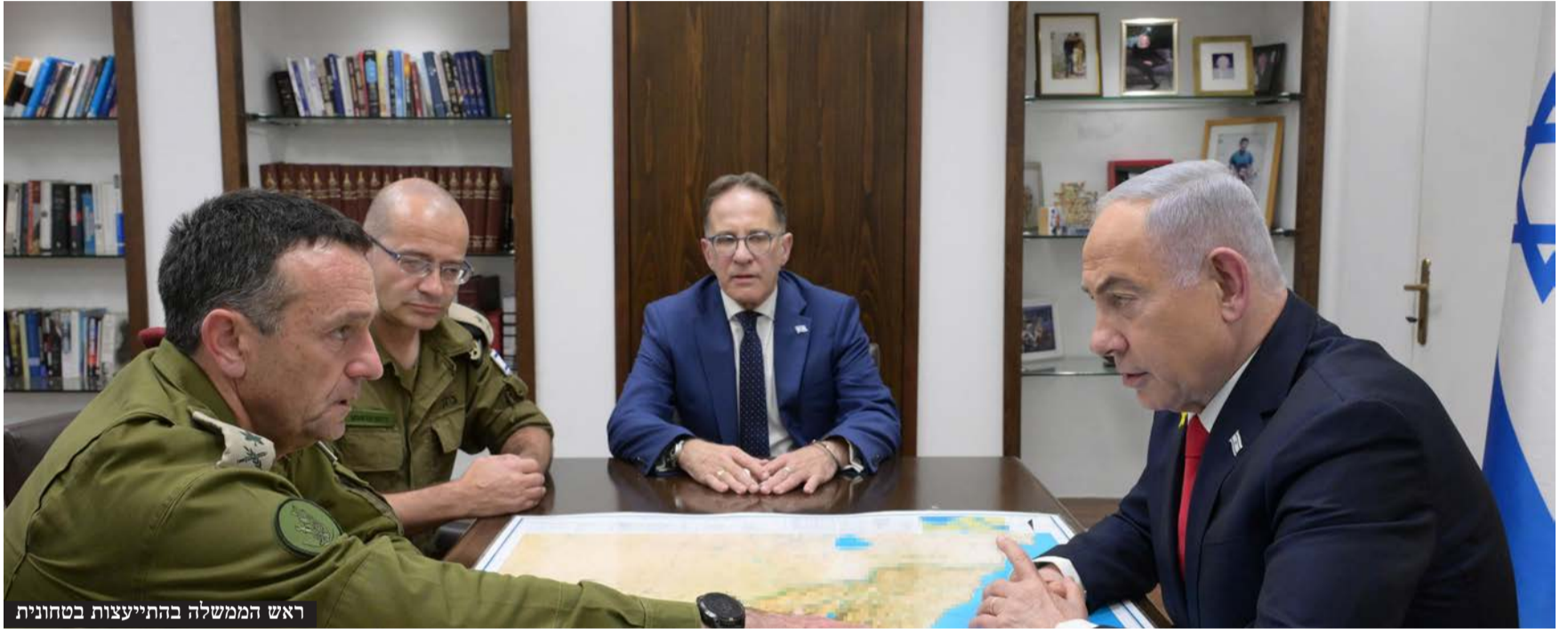
ראש הממשלה בהתייעצות בטחונית

ישראל צפויה לחתום על עסקה לשחרור 33 חטופים, תחילה נשים וילדים ואחר כך גברים מבוגרים וכמה צעירים יותר, בתמורה לשחרור כ-1,300 מחבלים, הפסקת אש ונסיגה מחלקים גדולים ברצועת עזה