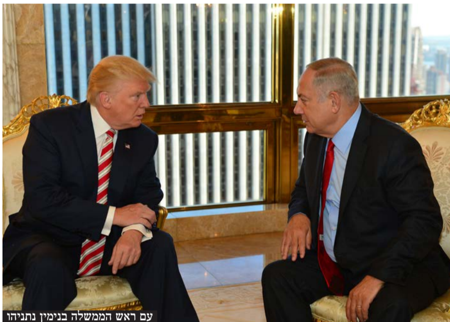
עם ראש הממשלה בנימין נתניהו

מוסרי, כפייה תרבותית והתרחקות מערכים מסורתיים.