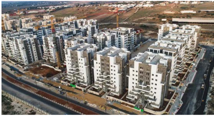
נוויקט תדהו באחיסמך