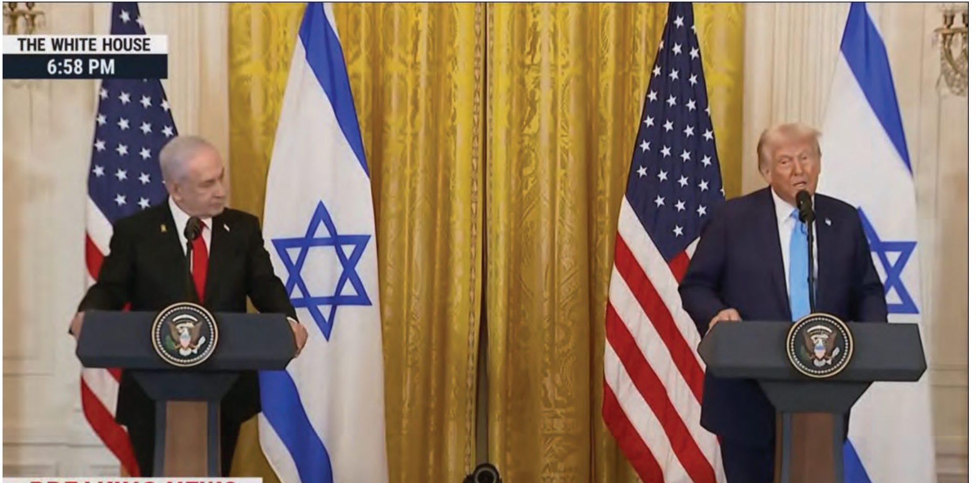
ימינה מנתניהו, ראש הממשלה ונשיא ארה"ב השבוע