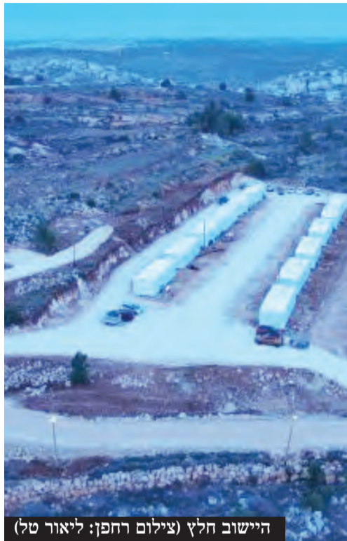
היישוב חלץ

לירושלים. השבוע, לפני 77 שנים, יצאה לדרך לוחמי שיירת הל"ה בדרכם לגוש עציון המבודד, ונהרגו בקרב קשה 'בין הרי חברון'. היום סגרנו מעגל ופרענו חוב מוסרי למייסדי גוש עציון ומגיניו ולחללי שיירת הל"ה.