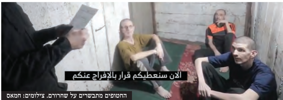
החטופים מתבשרים על שחרורם.

חמאס ברצועת עזה, אמר בהצהרה בבית החולים שיבא כי "זה לא היה אותו אור שיצא מהבית בשבעה באוקטובר. מצבו הגופני ירוד, מי שראה את התמונות - לא יכול היה להתעלם. במשך תקופת השבי אור פחד כל יום כי זה יומו האחרון".