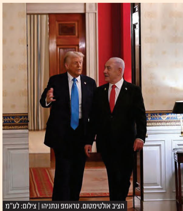
הציב אולטימטום. טראמפ ונתניהו | צילום: לע"מ