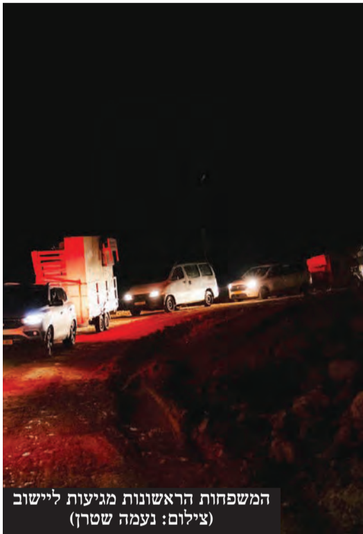
המשפחות הראשונות מגיעות ליישוב

יישוב חדש הוקם וביום חמישי האחרון החל תהליך האכלוס • זהו אחד מחמישה יישובים שהממשלה אישרה • ראש המועצה ירון רוזנטל: זוכים לחבר את גוש עציון לירושלים