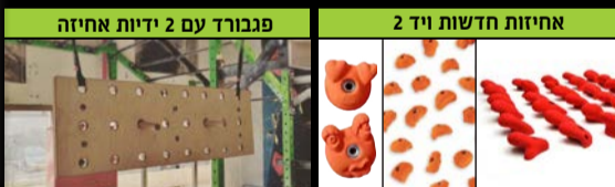
פגבורד עם 2 ידידות אחיזה

אצלינו תוכלו להזמין ערכות ביתיות להרכבה עצמית