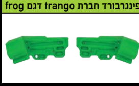
פינגרבורד חברת frog דגם frango