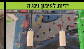
ידידות לאימון ניגנה