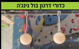
כדורי דרגון בול ניגנה