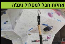
אחיזת חבל למסלול ניגנה