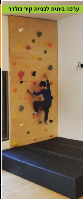
ערכה ביתית לבניית קיר בולדר

חולמים על קיר משלכם? או על פינת אימון בבית?