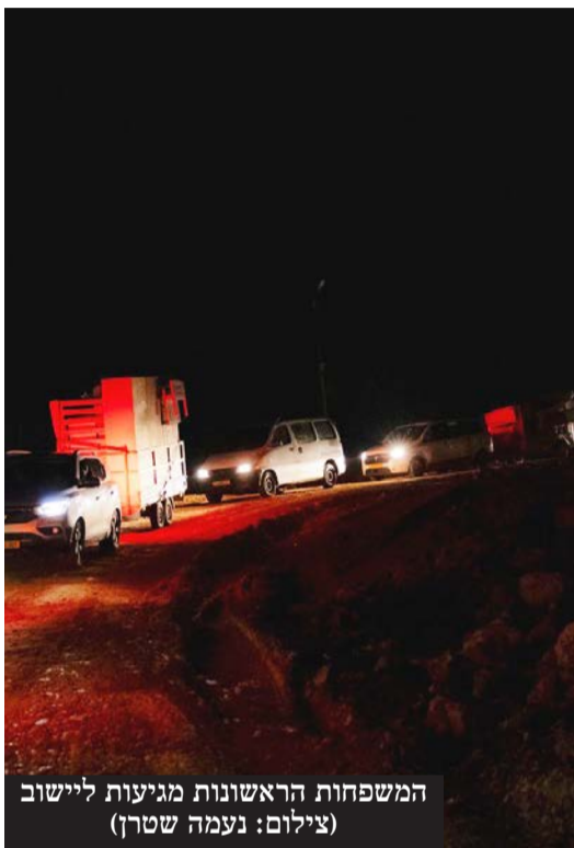
המשפחות הראשונות מגיעות ליישוב