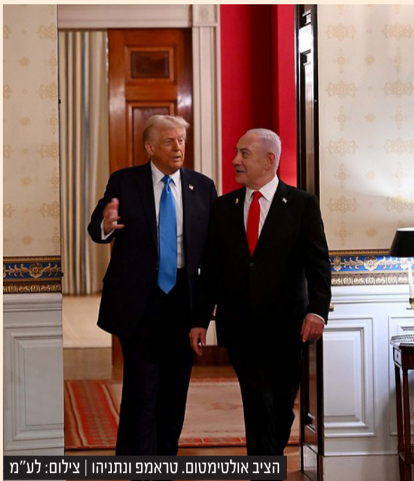
הציב אולטימטום. טראמפ ונתניהו