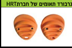
פינגרבורד תאומים של חברת HRT