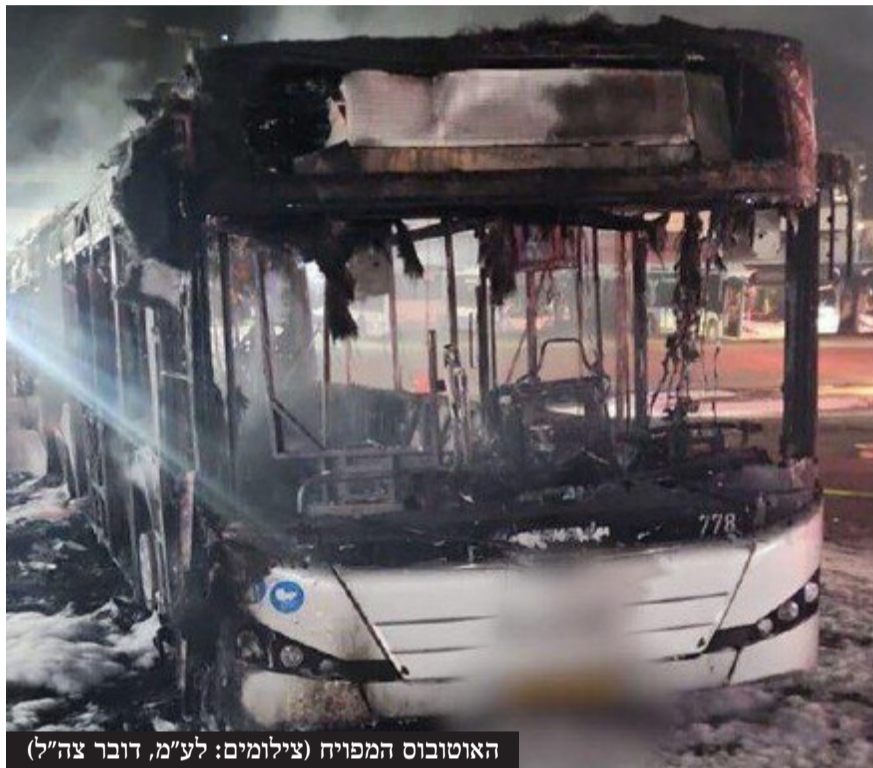
האוטובוס המפויח

מערכת הביטחון ממשיכה לחקור את הניסיון לבצע פיגוע רב זירתי בסוף השבוע שעבר, שנכשל בניסים גדולים • ראש הממשלה בנימין נתניהו הצהיר בטו-כרם: "הנחיתי לצאת לפעילות מבצעית נוספת נגד מוקדי טרור" צה"ל הרס יותר מ-120 בתים בתוך מחנה הפליטים ג'נין