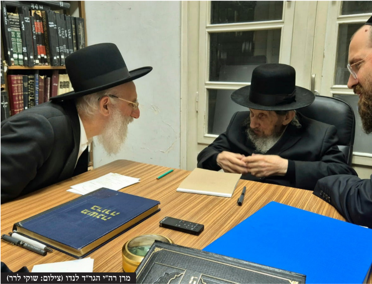
מרן רה"י הגר"ד לנדו

בכינוס דרמטי שכינס מרן ראש הישיבה הגר"ד לנדו במעונו השתתפו עשרות בחורי ישיבות ליטאיים וספרדים אשר קיבלו צווי גיוס יחד עם ראשי הישיבות הגר"ד לוי, הגר"י סטפנסקי והגר"ב פנחסי