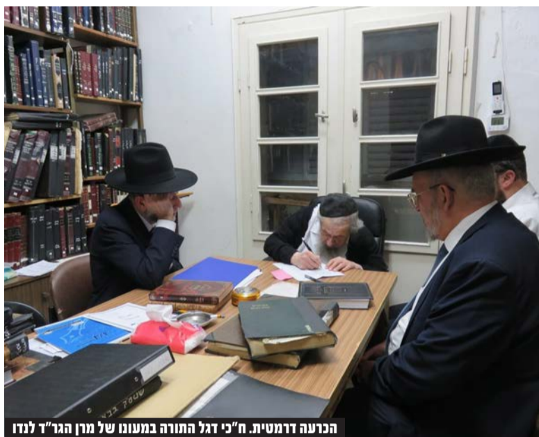
הכרעה דרמטית. ח"כי דגל התורה במעונו של מרן הגר"ד לנדו