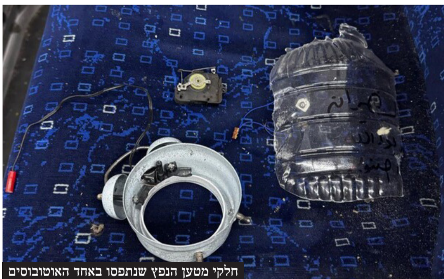
חלקי מטען הנפץ שנתפסו באחד האוטובוסים

מומנו ואומנו ע"י ציר הרשע האיראני - בניסיון להקים חזית טרור מזרחית נגד יישובי השומרון וקו התפר". על רקע ההכנות המתגברות והנחישות לחידוש הלחימה ברצועת עזה, שעשוי להתרחש אם הפסקת האש השברירית תקרוס סופית, הצהרתו של השר ממחישה כי גזרת יהודה ושומרון חוזרת לתפוס מקום מרכזי בסדר העדיפויות הביטחוני של ישראל. הדבר משקף את ההבנה במערכת הביטחון כי הזירה הזו, שבעבר נחשבה משנית לעומת עזה או גבולות אחרים, הפכה מחדש למוקד מתיחות משמעותי הדורש טיפול מיידי ומעמיק. כחלק מההיערכות הזו, נדרשת התאמה מחודשת של סדרי הכוחות, הן מבחינת כמות והן מבחינת איכות, כדי לעמוד באתגרים המבצעיים המורכבים שמציב המרחב הזה - החל מפעילות טרור מאורגנת ועד להתמודדות עם התפרעויות מקומיות.