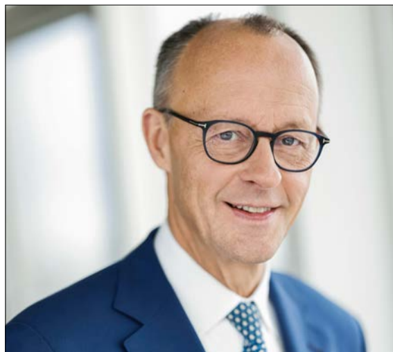
קנצלר הגרמני החדש, פרידריך מרץ

נחשוף כאן גם שנושא הפרישה מהממשלה עלה השבוע בהתייעצות שנערכה במעונו של מרן הגר"ד לנדו. סגן השר אורי מקלב המרכז את הטיפול בנושא הגיוס במפלגה וח"כ יעקב אשר, היושב בדיוני ועדת חוץ וביטחון ועוקב אחרי ההתפתחויות, עלו למעונו של מרן כדי לעדכן אותו בפרטים ולקבל הנחיות, אם ישנן. בשלב זה, על פי הוראת מרן, לא רק שאין מקום לפרוש מהממשלה, גם אין מקום לנהל שיח כזה. למעשה, ההוראה שהתקבלה ב'דגל התורה' היא שלא להשתמש אפילו בקלף האיום של פרישה מהממשלה, כל עוד התהליך מתקדם כפי שהוא