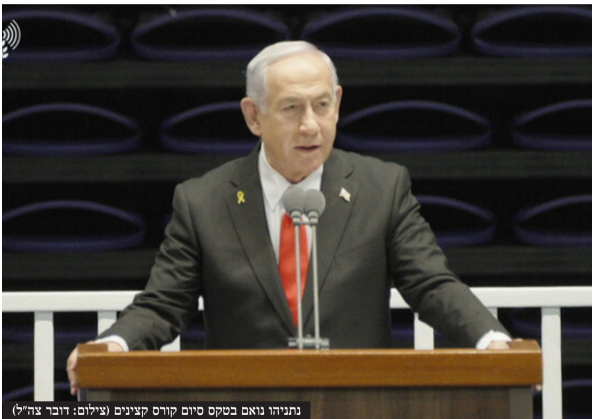
נתניהו נואם בטקס סיום קורס קצינים

בקבטיה. לראשונה ביהודה ושומרון מזה עשרות שנים הכנסנו טנקים. זה אומר דבר אחד: אנחנו נלחמים בטרור בכל האמצעים - ובכל מקום. "בלבנון - נוסיף להחזיק בשטחים שולטים לאורך גבולנו הצפוני, בתוך לבנון ואל מול יישובינו. עד שצבא לבנון וממשלת לבנון ימלאו את כל התחייבויותיהם לפי ההסכם. "בסוריה - כוחות צה"ל יישארו בכתר החרמון ובמרחב החיץ לזמן בלתי מוגבל, כדי להגן על יישובינו ולסכל כל איום. כדאי להקשיב. לא נאפשר לכוחות של ארגון ה-HTS, או צבא סוריה החדש להיכנס לשטח מדרום לדמשק. אנו דורשים פירוז מלא של דרום סוריה - במחוזות קונייטרה, דרעא וא-סוידא - מכוחות המשטר החדש. כמו כן, לא נסבול כל איום על העדה הדרוזית בדרום סוריה. "ובאשר לאיראן - משטר האייתולות הרעוע באיראן ביקש לחנוק אותנו בטבעת אש של טרור. אנחנו ריסקנו חלקים גדולים מציר-הרשע של איראן באמצעות מהלומות קטלניות, מהלומות שעוררו השתאות - אני יכול להגיד, אפילו הערצה - ברחבי העולם. גרענו חלק ניכר מכוחן של השלוחות האיראניות, ופגענו ביכולת ההגנה וייצור הטילים של איראן עצמה. "אבל היעד העליון שלנו היה ונותר ברור לחלוטין: לא נאפשר לאיראן להשיג נשק גרעיני. והיעד הזה קודם כל משרת את הביטחון הלאומי שלנו, אבל הוא גם משרת את הביטחון של העולם כולו."