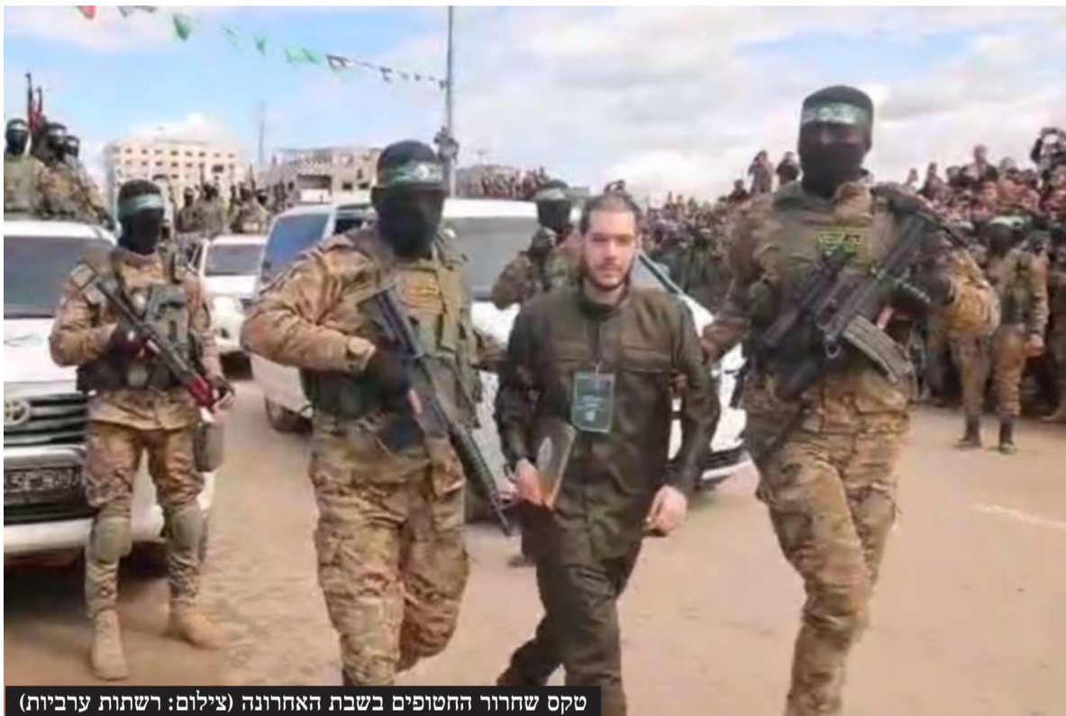
טקס שחרור החטופים בשבת האחרונה

הנשמה היהודית מתעוררת לחיים חדשים בימים אלה, בתוך תקופה של תהפוכות • אם החטוף שקיבלה על עצמה לשמור שבת בעקבות שבת מרגשת עם 'קשר יהודי' וזכתה להתאחד עם בנה בדיוק שנה לאחר מכן, החטוף שהתחיל לברך ולקרוא 'שמע ישראל' לראשונה בחייו במנהרות החמאס בעזה, והאמא שלא באה לקבל את בנה החטוף ששב לישראל כדי לא לחלל את השבת