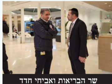
שר הבריאות ואביחי חדר

שר הבריאות הרב אוריאל בוסו הגיע השבוע לביקור פתע בבית חולים השרון כפ"ת. הוא נפגש עם מנהל בית החולים ודיבר עם מאושפזים ובני משפחה. כמו כן פגש באקראי את אביחי חדר מנהל מרחב דן במד"א והאריך איתו רבות על ענייני הבריאות והמתנדבים.