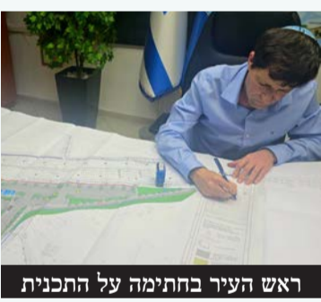
ראש העיר בחתימה על התכנית

השבוע חתם ראש העיר על התוכנית להקמת הקאנטרי החדש והמרכז מסחרי בסמוך לאיצטדיון העירוני, בעלות של למעלה מ-65 מיליון שקלים. הקאנטרי ישתרע על פני שטח של 18 דונם ויכיל בין היתר, בריכת שחיה מקורה, בריכה פתוחה ובריכה לפעוטות, סאונה יבשה וסאונה רטובה, מלתחות, חדרי כושר, חנות ספורט, חדר ספינינג, חדרי אימונים שונים, מגרשי דשא סינטטי ורב תכלתיים, שטחי חניה ומסעדות.