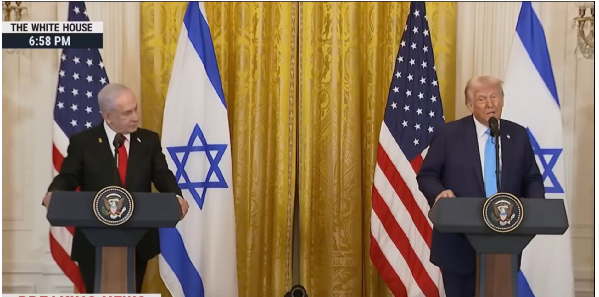
ימינה מנתניהו, ראש הממשלה ונשיא ארה"ב השבוע