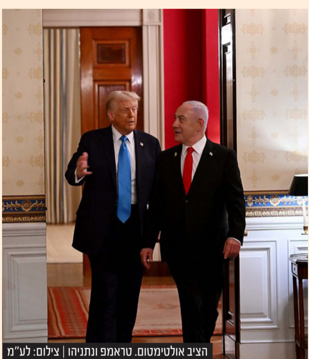
הציב אולטימטום. טראמפ ונתניהו