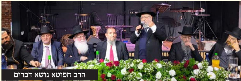
הרב חפוטא נושא דברים

יותר מאלף איש השתתפו במוצאי שבת שעברה בהילולה מרגשת לכבודו של סידנא בנא סאלי, רבי ישראל אבוחצירא זיע"א