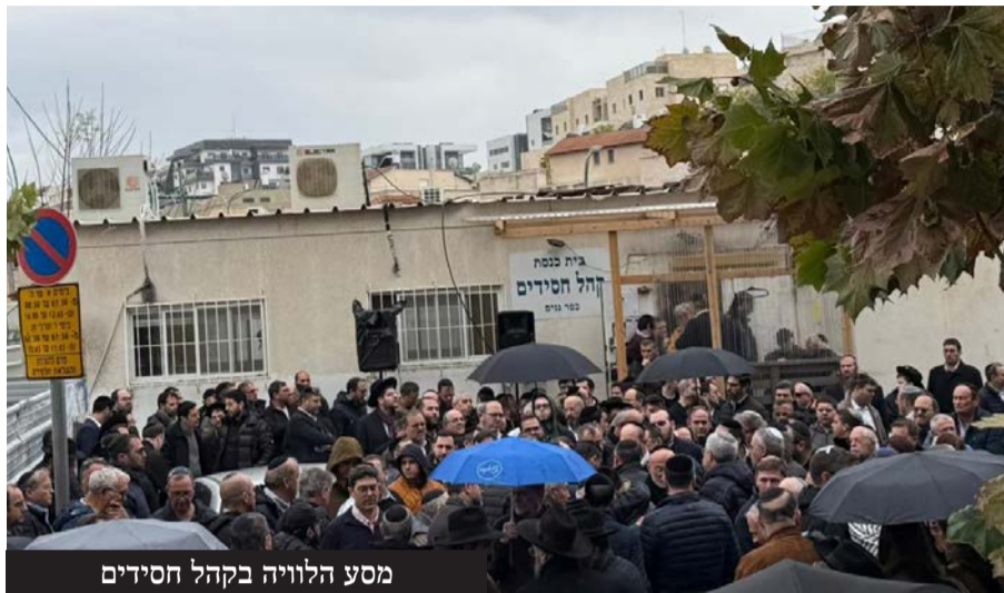
מסע הלוויה בקהל חסידים