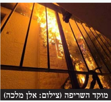
מוקד השריפה

לוחמי האש של העיר הוזעקו לשריפה של ארון חשמל בחדר מדרגות של בניין מגורים ברחוב קפלן בעיר. מדובר בארון שבער בבניין, ומפקד המשמרת דיווח על עשן רב בבניין. לוחמי האש ביצעו פעולות לכיבוי האש וסריקה אחר לכודים. לוחמי האש ביצעו כיבוי של מוקד השריפה שהיה בחדר המדרגות, וחילצו שני לכודים ששהו בדירה בקומה ה-2. בהמשך דווח כי שתי נשים פונו במצב קל לבית החולים, נזק כבד נגרם לבניין ולמספר דירות.