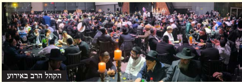
הקהל הרב באירוע