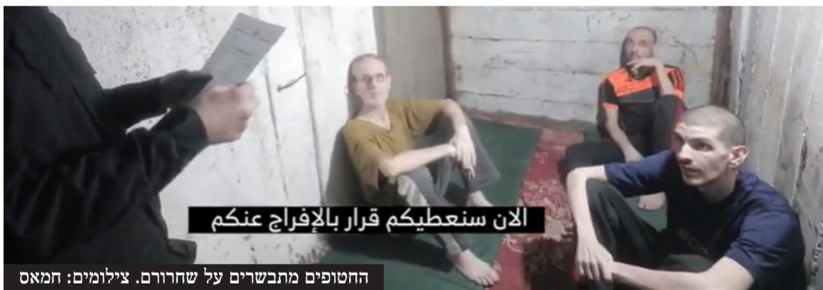
החטופים מתבשרים על שחרורם.

חמאס ברצועת עזה, אמר בהצהרה בבית החולים שיבא כי "זה לא היה אותו אור שיצא מהבית בשבעה באוקטובר. מצבו הגופני ירוד, מי שראה את התמונות - לא יכול היה להתעלם. במשך תקופת השבי אור פחד כל יום כי זה יומו האחרון".