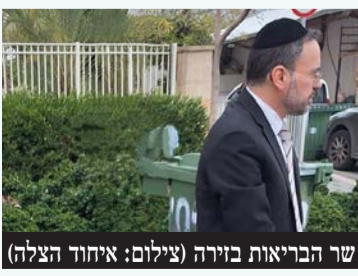
שר הבריאות בוויר

אוריאל בוסו שר הבריאות וחובש איחוד הצלה העניק טיפול רפואי לרוכבת קורקינט חשמלי כבת 35 שנפצעה באורח קל עד בינוני לאחר שהחליקה ונחבלה במהלך הנסיעה ברחוב אבשלום גיסין בפתח תקווה.