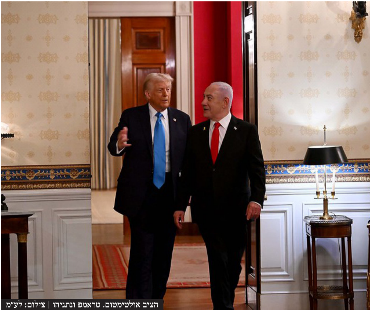
הציב אולטימטום. טראמפ ונתניהו

דובר הזרוע הצבאית של חמאס, אבו עובידה, טען כי הסיבות המרכזיות הן עיכוב בחזרתם של העקורים לצפון רצועת עזה, ירי באזורים שונים ברצועה ואי אספקת ציוד הסיוע ההומניטרי עליו סוכם. בעקבות זאת, אבו עובידה הודיע כי העברת החטופים הישראלים שהייתה אמורה להתבצע בשבת, תידחה "עד להודעה חדשה ועד שישראל