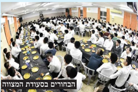
הבחורים בסעודת המצווה