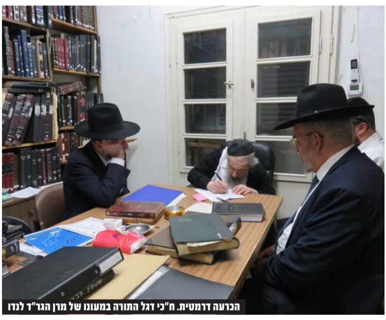
הכרעה דרמטית. ח"כי דגל התורה במעונו של מרן הגר"ד לנדו