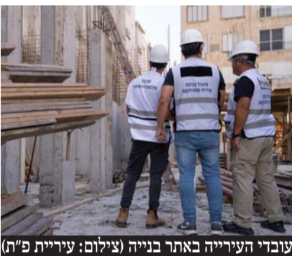
עובדי העירייה באתר בנייה

בטיחות באתרים, ארגון אתר והסדרי תנועה. ראשית, אציין כי ארגון הקבלנים מברך על קיום כנס החירום - שנקבע ליום רביעי הקרוב 26 בפברואר - ומוכן לשתף פעולה עם העירייה בכל הנושאים הנ"ל. יחד עם זאת, לא ברור לנו הקשר בין עצירת ההיתרים, אישורי אכלוס ותעודות גמר או ארגון אתר - לנושאי הבטיחות. האמת היא שאין קשר בין הדברים, והבהרנו זאת במכתב דחוף ששלח הארגון לראש העיר ומהנדס העיר שבו ביקשנו לבטל את ההחלטה. העירייה מתיימרת לבוא לעזרת תושבי פתח תקווה, אך בפועל היא רק פוגעת בהם. אותם תושבים שמחכים לדירות החדשות שרכשו וניתנות לאכלוס כבר בימים הקרובים, ייאלצו להמשיך ולשלם שכירות עד שהעירייה תואיל בטובה להוציא את האישורים. החלטת העירייה אמנם יוצרת עיכובים לקבלנים המתווספים לכל התלאות שהקבלנים עברו במוסדות התכנון של העירייה, אבל בפועל הפגיעה האמיתית היא בתושבים על כל המשתמע מכך."