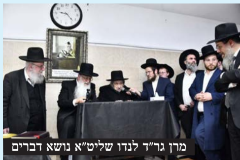
מרן גר"ד לנדו שליט"א נושא דברים

בישיבת אור ישראל התקיים מעמד סיום מרגש של מסכת בבא בתרא, שנלמדה בשקידה ובעמל במשך השנה האחרונה. המעמד, שהתקיים בנוכחות גדולי תורה ואישי ציבור, היה רגע שיא עבור עשרות מבחורי הישיבה שזכו לסיים את המסכת