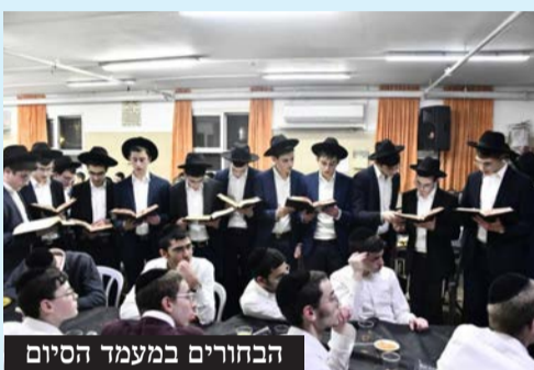
הבחורים במעמד הסיום