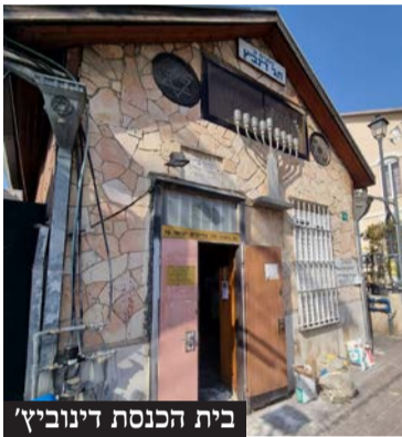
בית הכנסת דינוביץ'