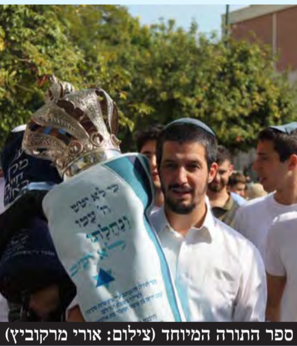
ספר התורה המיוחד