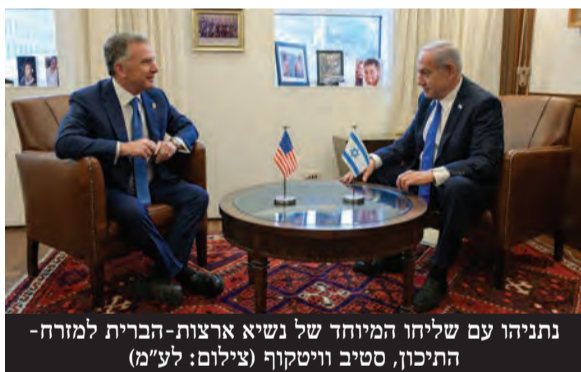
נתניהו עם שליחו המיוחד של נשיא ארצות-הברית למזרח-התיכון, סטיב וויטקוף

"אתה רואה דברים שאחרים מסרבים לראות. אתה אומר דברים שאחרים מסרבים לומר. זאת צורת חשיבה שאפשרה לנו להביא את הסכמי אברהם ותעצב מחדש את המזרח התיכון ותביא שלום. טראמפ רואה עתיד אחר לפיסת האדמה הזאת שהייתה מוקד של כל כך הרבה טרור והתקפות נגדנו. יש לו רעיון אחר. שווה לשים לב לזה. הוא בוחן את זה עם אנשיו. זה משהו שיכול לשנות את