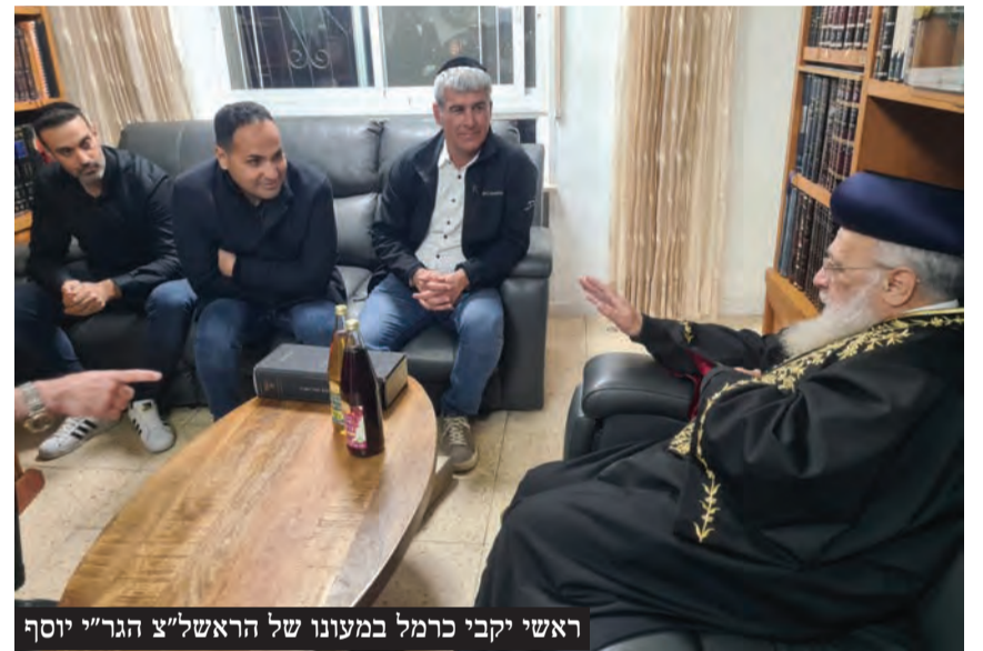
ראשי יקבי כרמל במעונו של הראשון לציון הגר"ע יוסף

ראשי הנהלת יקבי כרמל, היקב הגדול והמוביל בישראל, התקבלו במעונו של הראשון לציון הגאון רבי יצחק יוסף שליט"א נועדו עמו ממושכות על ההיסטוריה של היקב והמורשת שלו • ראשי הנהלת היקב התרגשו מהדברים שנאמרו לאורך הביקור ומכך שקיבלו עדות על יחסו של מרן הגר"ע יוסף זצוק"ל ליינות יקבי כרמל. "אבי מרן זצוק"ל התבטא כמה פעמים על כך שיינות 'כרמל' כשרים לברכת 'בורא פרי הגפן' גם לדעת מרן הבית יוסף"