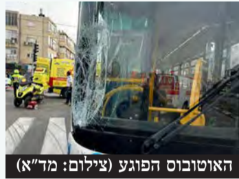
האוטובוס הפוגע

עיריית פתח תקווה, בהובלת המחלקה לתרבות ביום שני בשעה 14:15 התקבל דיווח במוקד 101 של מד"א במרחב ירקון על רוכב גלגיוע (קורקינט חשמלי) שנפגע מאוטובוס ברחוב זאב אורלוב בפתח תקווה. חובשים ופראמדיקים של מד"א העניקו טיפול רפואי ומפנים לבי"ח בלינסון נער בן 13 במצב בינוני עם חבלות באגן ובגפיים.