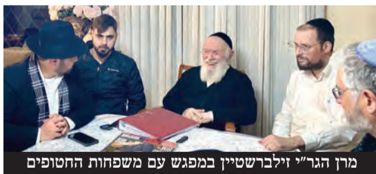
מרן הגר"י זילברשטיין במפגש עם משפחות החטופים

הגר"י זילברשטיין הדגיש כי יש לקחת פרי חדש ולברך ברכת "שהחיינו" ולכוון גם על החטוף ששוחרר. "זהו נס בתוך נס שאי אפשר לתאר ולשער. חובה עלינו להודות ולהלל את הקדוש ברוך הוא", הכריז הרב בשמחה