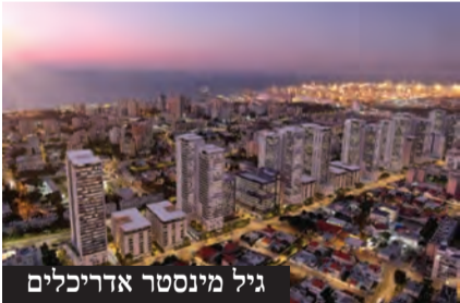
גיל מינסטר אדריכלים