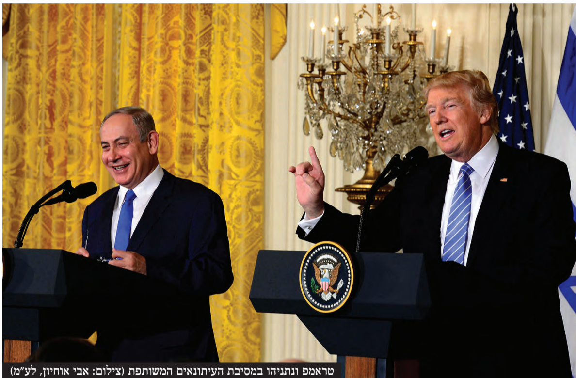
טראמפ ונתניהו במסיבת העיתונאים המשותפת

תכנית הטרונספר של טראמפ טורפת את הקלפים: נשיא ארצות הברית דונלד טראמפ נועד השבוע בבית הלבן עם ראש הממשלה בנימין נתניהו וסיפק הצהרות חסרות תקדים לגבי עזה והפלסטינים שחיים בה. בדבריו, אמר טראמפ כי עזה "נראית כמו גיהנום" וכי אם הפלסטינים יהיה "מקום יפה ללכת אליו - הם ילכו". לאחר מכן, הבהיר באופן ברור: "אני מדבר על העברת הפלסטינים מעזה לתמיד".