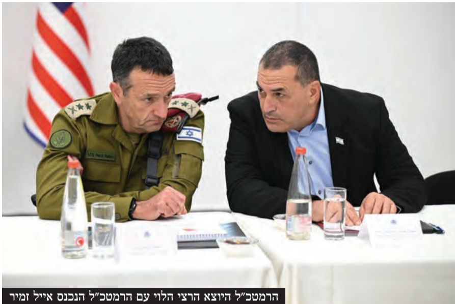
הרמטכ"ל היוצא הרצי הלוי עם הרמטכ"ל הנכנס אייל זמיר

האלוף אייל זמיר שיחליף את הרצי הלוי, מונה לרמטכ"ל ה-24 של צה"ל וצפוי לחולל שינויים דרמטיים במערכת ולהדיח את בעלי התפקידים הבכירים בזמן המחדל שהוביל לטבח