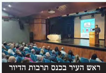
ראש העיר בכנס תרבות הדיור

עיריית פתח תקווה, בהובלת המחלקה לתרבות הדיור, קיימה השבוע כנס מקצועי בנושא הבית המשותף. הכנס התקיים בבית תרבות שרת, בו המשתתפים קיבלו מידע חיוני, פתרונות מעשיים וידע שיעזור להם לשפר את איכות החיים בבניין שלהם.