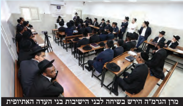
מִן הַגְרַמ"ה הִירֵשׁ בְּשִׂיחָה לִבְנֵי הַיִּשִּׁיבוֹת בְּנֵי הָעֲדָה הָאֲתִיּוֹפִית