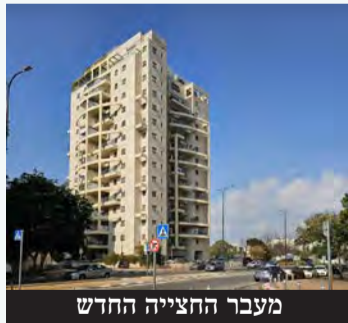
מעבר החציה החדש

עיריית פתח תקווה משלימה בימים אלה פרויקט תשתיתי נוסף - הקמת מעבר חציה בטיחותי ברחוב מנחם בגין, המחבר בין רחוב פינצ'י לרחוב וינברגר. ראש העיר, רמי גרינברג מסר: "פרויקט זה הוא חלק משדרוג תשתיות הבטיחות ברחוב מנחם בגין, שכולל גם הקמת מעגלי תנועה חדשים בצמתים מרכזיים: רחוב בגין פינת חנה רובינא וברחוב בגין פינת מנחת שלמה. אנו נמשיך לפעול למען שיפור הבטיחות והנוחות של תושבי העיר"