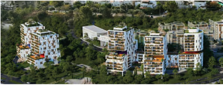
צמח המרמן ומצודות נבחרו לבצע פרויקט פיניו בינוי בנרמיאל