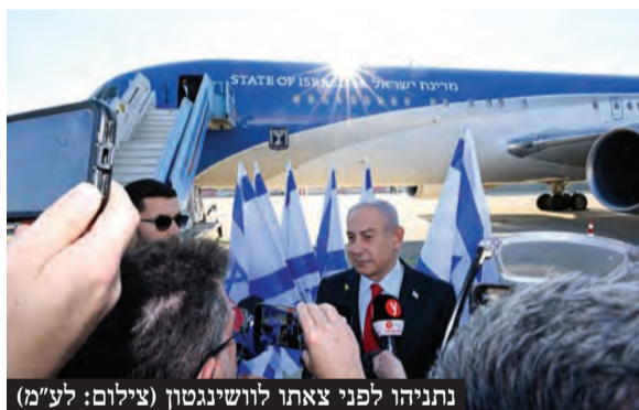
נתניהו לפני צאתו לווינגטון