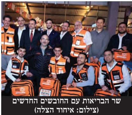
שר הבריאות עם החובשים החדשים

במהלך האירוע הגיע עו"ד אבישי ריינמן להודות לחובש שהציל את חייו לפני כמה חודשים