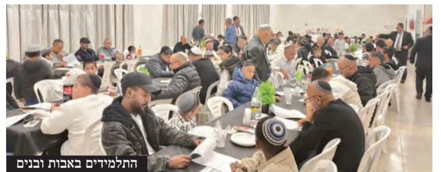
התלמידים באבות ובנים

הערב עסק בנושא קדושת השבת, וסיכם שלושה חודשים של לימוד והכנה לשבת בקרב התלמידים